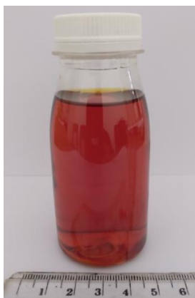
Gambar 1. Asap Cair Tandan Kosong Elaeis guineensis Jacq

Hasil analisis dengan uji lanjut Duncan menunjukkan bahwa diameter koloni jamur Colletotrichum sp. setiap perlakuan menunjukkan perbedaan yang nyata ( F_{8,18} = 13,58E3 , \rho = 0,000 ). Konsentrasi 0,40% menunjukkan pertumbuhan jamur Colletotrichum sp. dengan diameter koloni sebesar 1,604 Cm. Diameter koloni jamur Colletotrichum sp akan semakin menurun seiring dengan bertambahnya konsentrasi asap cair yang digunakan. Bahkan pada konsentrasi 0,52% dapat dilihat jamur