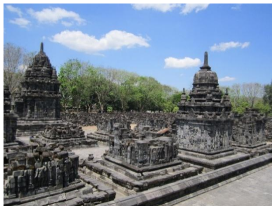
Gambar 2. Candi induk Candi Sewu (kiri) dan Reruntuhan Perwara Candi Sewu (kanan)