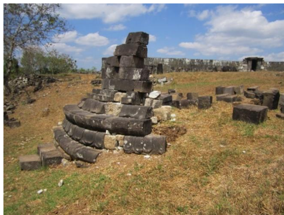
Gambar 3. Gerbang masuk Situs Ratu Boko (kiri) dan Reruntuhan Stupa di Situs Ratu Boko (kanan)

aman) (Sundström 2020, 28). Penggunaan nama yang sama di Jawa dan Srilangka bukanlah suatu kebetulan melainkan bentuk transmisi ideologis.