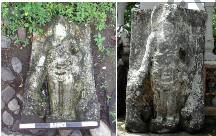
Foto 1 dan 2. Arca Agastya saat ditemukan (kiri) dan setelah dibersihkan dan ditegakkan (kanan)

Dalam interpretasi, dilakukan studi komparatif dengan membandingkan tinggalan arkeologi yang telah dideskripsikan tersebut, baik yang ada di Situs Wonoboyo maupun di luar Situs Wonoboyo. Guna memperkuat interpretasi, dilakukan pula perbandingan nama-nama tempat yang ada di DAS Bengawan Solo Wonogiri yang diperkirakan sebagai Desa Paparahuan.