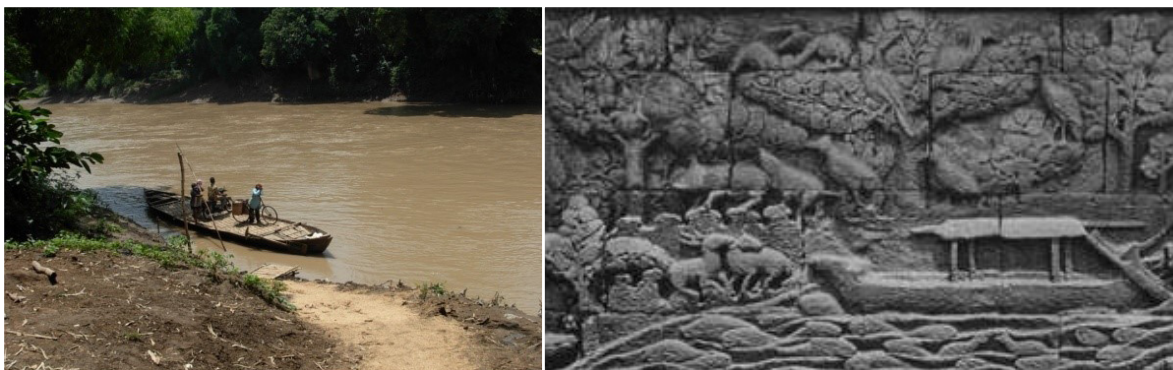
Foto 18 dan 19. Perahu tambang yang melayani penduduk Dusun Kumbu dan Dusun Ngabean, Kecamatan Kebakramat, Kabupaten Karanganyar (kiri) dan perahu yang dipahatkan pada relief Candi Borobudur dari abad ke-8 M.

Sampai saat ini, di sepanjang tepi Bengawan Solo masih ada tempat-tempat yang dijadikan tempat tambangan seperti yang tempat tambangan yang menghubungkan Dusun Kumbu, Desa Waru dengan Dusun Ngabean, Desa Kragan, keduanya termasuk wilayah Kecamatan Kebakkramat, Kabupaten Karanganyar. Penduduk Dusun Kumbu dan sebaliknya, apabila hendak pergi ke Dusun Ngabean yang berada di kedua sisi Bengawan Solo, pada umumnya menggunakan jasa perahu tambangan yang berada di Bengawan Solo. Mereka tidak memakai jalan darat karena lebih memutar. Penduduk yang menggunakan jasa tambangan ini diantaranya adalah para pedagang. Bentuk perahu tambang yang dipakai mirip dengan perahu yang dipahatkan pada relief Candi Borobudur panil Ia.115 (Krom 1927, I: 223), hanya saja perahu pada relief digambarkan memakai atap.