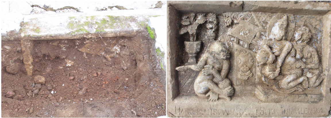
Foto 8 dan 9. Batu Panil Relief C yang dijadikan tembok (kiri) dan setelah diangkat (kanan)

depannya. Pada bagian sisi kanan panil terlihat 2 figur wanita dengan posisi duduk. Wanita pertama duduk dengan posisi tangan kanan ditumpangkan pada benda berbentuk bulat, sedangkan tangan kirinya ditempatkan lurus di atas betis kanannya. Wanita ini digambarkan memakai mahkota, dan perhiasan yang lengkap berupa kalung, anting-anting, dan kelat bahu. Pada bagian belakang kepalanya terdapat lingkaran dengan bentuk bulat telur yang menggambarkan prabhamaṇḍala dari tokoh wanita ini. Wanita kedua digambarkan duduk di belakang tokoh wanita pertama dengan posisi kedua tangannya berada di punggung dan pinggang figur wanita pertama. Wanita kedua digambarkan berambut keriting, gigi atasnya besar yang terlihat dari mulutnya yang setengah terbuka, menggunakan perhiasan sebuah kalung dengan leontin berbentuk bulat. Tampaknya wanita pertama yang digambarkan adalah tokoh penting, seorang dewi suci karena digambarkan atribut perhiasannya yang lengkap ditambah dengan adanya prabhamaṇḍala di belakang mahkotanya, sedangkan wanita kedua mungkin pelayan dari sang dewi. Adegan pada relief tersebut digambarkan di depan atau di teras sebuah rumah, kedua wanita duduk di sebuah tempat yang lebih tinggi dari si kera dan di belakang kera terdapat vas bunga besar lengkap dengan tanamannya. Pada bingkai bagian bawah terdapat tulisan latin dengan huruf besar yang berbunyi: HANOEMAN SOWAN DEWI SITA