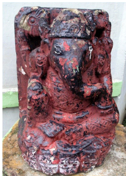
Foto 3. Arca Ganeśa yang dicat merah oleh penduduk setempat

Arca Agastya terbuat dari batu andesit dengan ukuran: tinggi keseluruhan 82 cm, tinggi sandaran 62 cm, lebar 55 cm, dan tebal 20 cm. Agastya bagian mukanya telah diganti dengan semen putih digambarkan dalam posisi berdiri di atas asana , hiasan rambutnya berupa jaṭamakuta , bertangan dua: tangan kiri memegang kamaṇḍalu (kendi) yang sudah pecah dan tangan kanan yang biasanya memegang akṣamala (tasbih) sudah diganti semen putih, dan memakai upawita . Di belakang kepala terdapat prabhamaṇḍala . Pada sandaran sebelah kiri terdapat triśūla yang sudah tipis sekali sehingga hanya kelihatan samar-samar. Di kiri-kanan kakinya terdapat pariwara (pengiring), pariwara di sebelah kanan masih utuh sementara pariwara di sebelah kiri sudah tidak ada. Pada bagian belakang sandaran arca terlihat permukaannya yang berlubang-lubang akibat adanya kegiatan penggerusan yang cukup intensif dan dalam waktu yang relatif lama. Hal ini secara tidak langsung