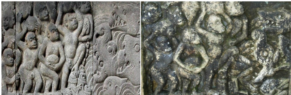
Foto 15 dan 16. Pasukan kera membendung lautan (sebelah kiri relief Candi Prambanan dan sebelah kanan dari Situs Wonoboyo)

Dari uraian di atas diketahui bahwa tinggalan arkeologis di Situs Wonoboyo, baik arca maupun relief berlatar agama Hindu. Agastya dan Ganesa jelas merupakan dewa-dewa Hindu. Sementara Rāmāyana mengisahkan