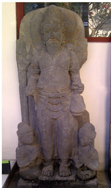
Foto 10. Agastya yang diapit pariwara dari Candi Kedulan koleksi BPCB Yogyakarta

Kecamatan Kasihan, Bantul; arca Agastya dari Candi Kedulan, Desa Tirtomartani, Kecamatan Kalasan, Prambanan, (tidak ada no. inv.), dan arca Agastya yang berasal dari Kecamatan Pajangan, Bantul yang merupakan koleksi BPCB Yogyakarta dengan no inv. 1815 dan dipamerkan di Museum Plered, Bantul. Keempat arca yang menjadi koleksi BPCB Yogyakarta berasal dari abad ke-9-10 M. Sementara arca Agastya dari Jawa Timur, yang diwakili oleh Museum Trowulan, Mojokerto tidak ada yang diapit oleh pariwara . Dengan demikian, maka arca Agastya dari Situs Wonoboyo secara ikonografis dapat disebutkan mempunyai tipe Jawa Tengah.