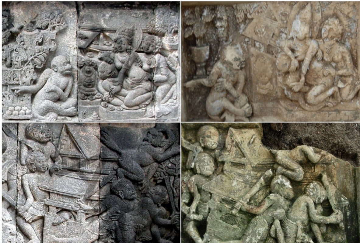
Foto 11, 12, 13, dan 14. Hanuman menghadap Dewi Sita di Alengka (sebelah kiri atas relief Candi Prambanan dan sebelah kanan atas dari Situs Wonoboyo). Hanuman membakar istana Alengka (sebelah kiri bawah relief Candi Prambanan dan sebelah kanan bawah dari Situs Wonoboyo (Sumber: Nastiti et al. 2008)

itu dibuat jauh sebelum tulisan itu digoreskan pada bingkainya. Selain itu, pahatan pada ketiga relief sangat halus dibandingkan dengan pahatan-pahatan sekarang yang dibuat dari batu putih. Mengenai relief meskipun mempunyai persamaan dengan relief Prambanan, akan tetapi mengenai kapan relief ini dibuat tidak dapat dipastikan, mungkin saja usianya jauh lebih muda dari Prambanan. Karena seperti diketahui bahwa haut relief tidak hanya ditemukan pada