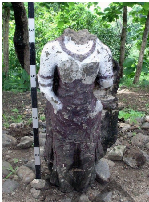
Foto 4. Arca dewa/dewi tanpa kepala yang dicat warna merah di bagian bawah dan putih di bagian atas

duduk dengan satu kaki dilipat dan kaki kiri dalam posisi sila, salah satu tangannya bertumpu pada lutut (Gupte 1972: 10), di atas asana berupa tengkorak. Arca Ganeśa bertangan empat, tangan kiri depan memegang mangkuk, tangan kanan depan yang bertumpu pada lutut sudah tidak begitu kelihatan lagi, dan tangan kanan belakang memegang bunga dan tangan kiri belakang memegang akṣamala (?). Kepala memakai mahkota dengan hiasan tengkorak, anting, kelat bahu, gelang kaki (?), dan gadingnya mungkin patah dua-duanya karena dicat dan sudah tidak kelihatan lagi, demikian pula dengan bentuk antingnya.