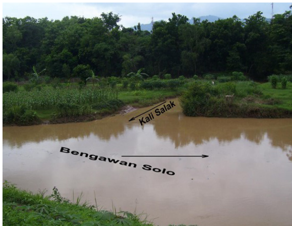
Foto 17. Muara Kali Salak di Bengawan Solo, terletak di sebelah barat Situs Wonoboyo

Sampai sekarang, kalau tidak sedang musim banjir, penghuni Panti asuhan 'Esti Tomo' jika mau menyeberang masih ada yang menggunakan perahu. Selain itu, sampai tahun 1934 masih ada tambangan antara Dusun Jatirejo ke Watu Kodok, meskipun khusus untuk mengangkut ternak. Ternak-ternak itu diangkut pada hari-hari pasar dari desa di sekitar Watu Kodok ke pasar hewan yang berada di seberangnya. Ternak-ternak tersebut merupakan barang komoditi yang penting yang diperjualbelikan di pasar hewan. Dengan demikian, jika melihat lokasi Situs Wonoboyo lebih tepat jika diidentifikasi dengan Desa Paparahuan, dibandingkan dengan Dusun Kedungprahu, Desa Pare dan Dusun Kedungprahu, Desa Selogiri yang secara geografis terletak pada dataran tinggi dan tidak mempunyai akses transportasi sungai.