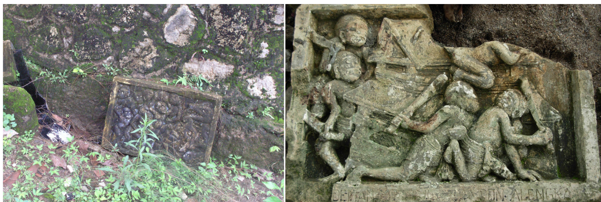
Foto 5 dan 6. Kondisi panil relief A dan B pada saat ditemukan (kiri) dan panil relief A (kanan)

Seperti telah disebutkan bahwa selain ketiga arca tersebut, di Situs Wonoboyo ditemukan 4 buah relief. Di halaman samping kiri Rumah Yatim Piatu “Esti Tomo” terdapat dua panil relief dari batu putih (tufa). Berdasarkan hasil pembicaraan dengan pegawai “Esti Tomo” diketahui ada satu panil relief lagi yang dijadikan tembok di sebelah kiri dekat tangga menuju ke mushola. Setelah dibongkar, maka