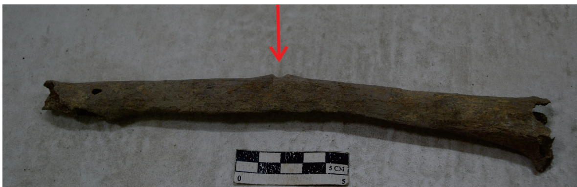
Gambar 8. Radius kanan dengan fraktur pada bagian tengah tulangnya

Pada kehidupan sehari-hari pencabutan gigi tersebut akan menimbulkan masalah pada proses mastikasi. Individu itu akan kesulitan mengunyah sehingga akan cenderung memakan makanan yang lembut. Pada bagian molar mandibulanya terdapat bekas yang menunjukkan bahwa alveolus molar mandibulanya masih dalam proses penyembuhan setelah gigi molar dicabut. Hal itu menunjukkan bahwa proses pencabutan molar individu tersebut baru berlangsung beberapa bulan sebelum individu itu mati.