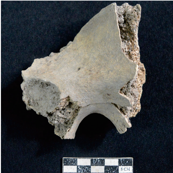
Gambar 3. Os Coxae dengan Incisura Ischiadica Major -nya yang menyempit.