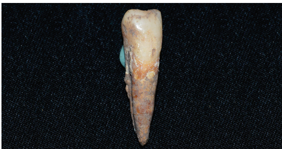
Gambar 10. Modifikasi gigi taring kanan memperlihatkan occlusal gigi caninus -nya sudah tidak lancip (kiri).

Jika dibandingkan dengan dua individu dari Caruban yang terletak relatif berdekatan dengan situs Terjan, individu dari Terjan memiliki tinggi badan sedikit lebih tinggi dari individu Caruban. Individu I Caruban merupakan individu perempuan dengan umur 15 – 16 tahun ketika mati. Individu itu memiliki tinggi badan 154,69 cm berdasarkan rumus Bergman & The dan 157 cm berdasarkan rumus Trotter & Glesser (1958). Individu II Caruban merupakan individu laki-laki dengan umur ketika mati sekitar 40 tahun. Individu itu memiliki tinggi badan 163,82 cm berdasarkan rumus Bergman & The dan 165 cm berdasarkan rumus Trotter & Glesser (1958) (Prayudi and Suriyanto 2017, 164). Berdasarkan perbandingan tersebut, individu dari Terjan memiliki ukuran badan yang lebih tinggi daripada individu II yang merupakan individu tertinggi dari situs Caruban.