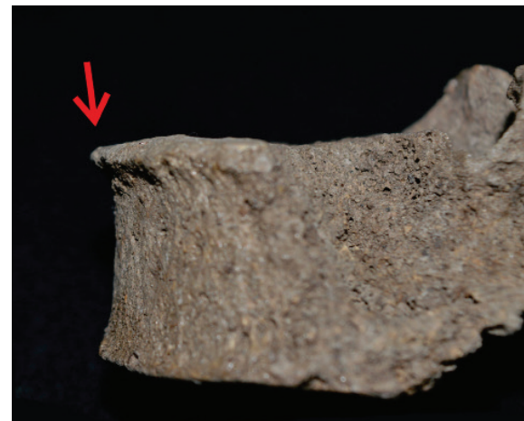
Gambar 6. Osteopit (tanda panah) pada vertebrae thoracicae yang menunjukkan osteopit pada corpus vertebrae -nya.

penutupannya. Pada bagian kranium masih terlihat sutura pada bagian tepi parietal menunjukkan bahwa individu ini belum memasuki umur yang lanjut, tetapi karena kondisinya yang sangat fragmentaris membuat penentuan umur secara mendetail menjadi mustahil.