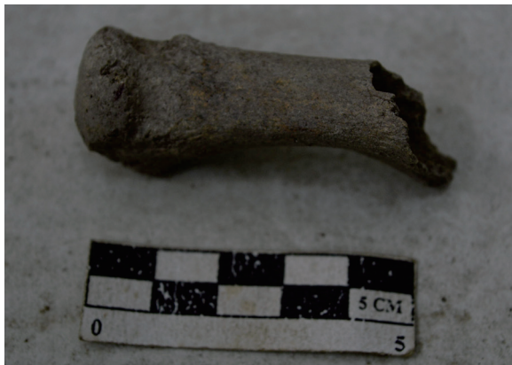
Gambar 7. Metatarsal kiri dengan perluasan fasies pada caput osis metatarsi dan ekstensi penulangan pada distal superior metatarsal -nya.

Terdapat juga fraktur pada radius bagian kanan yang terletak pada bagian tengah tulang (Gambar 8). Fraktur ini mematahkan tulang, namun telah sembuh dan menyambung dengan sempurna. Penyebab terjadinya fraktur diperkirakan karena individu tersebut menopang tubuhnya dengan menggunakan tangan kanan ketika badannya terjatuh pada posisi yang salah.