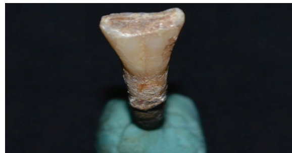
Gambar 11. Atrisi tingkat lanjut pada incisor-nya (kanan)