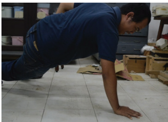
Gambar 15. Rekonstruksi tangan kanan menahan jatuhnya tubuh individu agar tubuh tidak membentur tanah.

Trauma pada individu yang memiliki greenstick fracture biasanya terjadi sebelum berumur 11 tahun. Pada umur tersebut lenturnya tulang membuat fraktur cepat menyambung kembali dan hampir tidak menimbulkan bekas (Lewis 2007, 165). Walaupun demikian, tidak dapat ditentukan dengan pasti umur ketika individu tersebut mengalami fraktur dan berapa lama yang dibutuhkan untuk sembuh. Proses penyembuhan bergantung pada beberapa faktor, di antaranya tingkat keparahan fraktur, kondisi nutrisi, umur, kesejajaran tulang yang patah, dan keberadaan infeksi (Lewis 2007, 167).