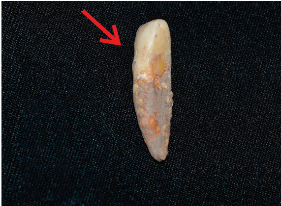
Gambar 9. Enamel hipoplasia yang terlihat samar pada permukaan labial gigi kaninus kanannya.

Tulang femur kanan individu itu masih dalam kondisi relatif baik sehingga dapat diperkirakan tinggi badannya. Panjang femur individu Terjan adalah 45 cm. Pengukuran tinggi badan dilakukan dengan menggunakan dua rumus regresi, yaitu rumus Bergman & The untuk rangka dari individu Jawa dan rumus Trotter & Glesser (1958) untuk rangka dari individu ras mongoloid. Tinggi badan individu tersebut adalah 166 cm, yang diukur dengan menggunakan rumus regresi Bergman dan The yang diterapkan pada femur kanan. Jika