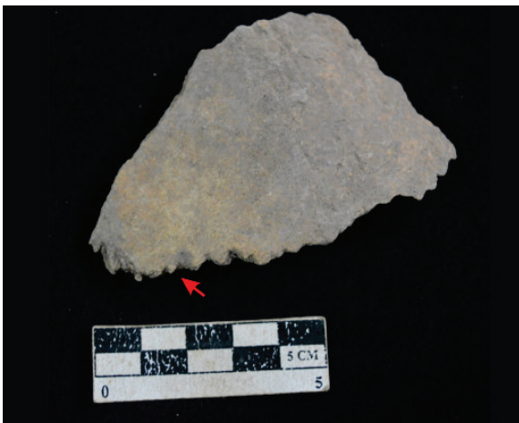
Gambar 5. Sutura pada parietal (tanda panah) yang menunjukkan suturnya belum tersambung sepenuhnya.