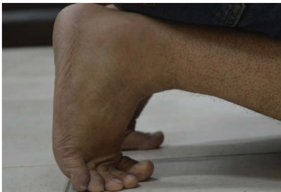
Gambar 14. Rekonstruksi kegiatan berlutut dengan penekukan persendian pada metatarsal dengan sudut yang melebihi batas.

Atrisi gigi atau bekas pakai pada gigi disebabkan oleh proses gesekan dan tumbukan pada proses mastikasi makanan antara gigi mandibula dan maksila, dan terjadi pada permukaan oklusal (Ortner, 2003, 604). Pada umumnya atrisi gigi sebanding dengan umur individu tersebut ketika mati. Seiring dengan bertambahnya umur, derajat atrisi juga akan bertambah. Pada individu dari Terjan, derajat atrisinya menunjukkan umur yang lebih muda. Hal itu bisa disebabkan oleh makanan yang relatif lembut ketika dimakan oleh individu Terjan ketika hidup sehingga tidak menghasilkan derajat atrisi yang tinggi. Oleh karena itu, penentuan umur individu dari Terjan dilakukan dengan menggunakan permukaan symphysis pubica -nya yang menunjukkan umur ketika mati berkisar antara 40 – 45 tahun.