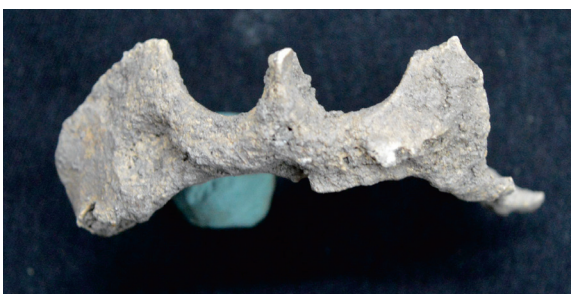
Gambar 12. Tidak ada gigi anterior pada maksilanya.