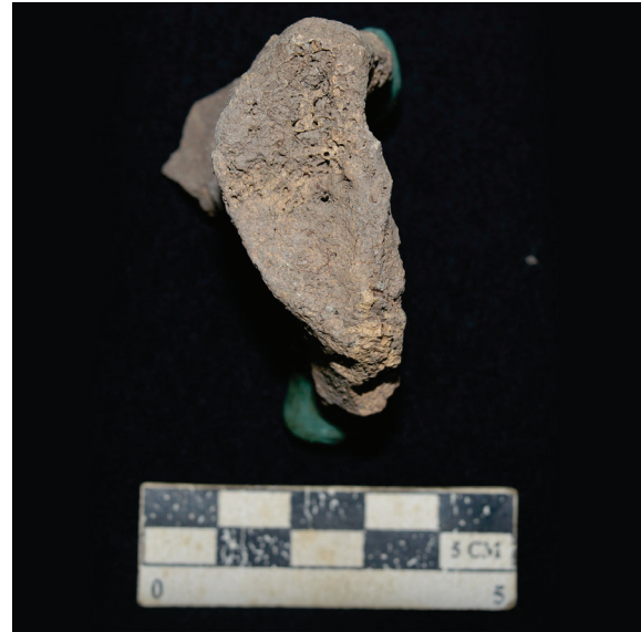
Gambar 4. Facies Symphysialis (permukaan Symphysis Pubica )-nya yang menunjukkan umur mati 40-45 tahun (Sumber: Prayudi).