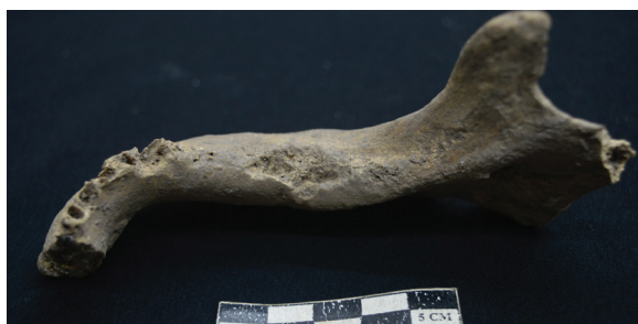
Gambar 13. Mandibula kanan dengan alveolus molarnya yang masih dalam masa penutupan.