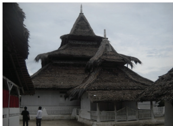
Foto 3. Masjid Kuno Hatuhahamarima di Negeri Rohomoni, Pulau Haruku, Maluku Tengah .