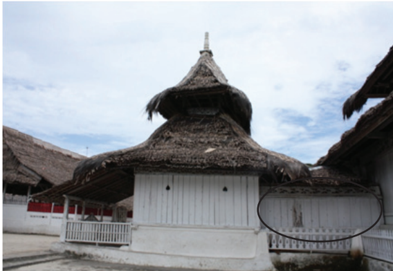
Foto 4. Bagian depan masjid, dilihat dari samping yang memperlihatkan koridor yang menyambungkan bangunan badan masjid yang lebih besar dengan masjid yang lebih kecil dan serambi.