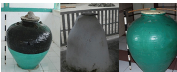
Foto 10. Tempayan kuno berukuran besar di Masjid Kuno Pelauw, Rohomoni dan Kabauw, sebagai simbol kesucian sebelum memasuki masjid yang terletak di beranda masjid.

Barat Daya, bahwa sebuah gentong ditempatkan di bagian depan masjid untuk ritual penyucian diri sebelum memasuki masjid (Dijk, 2009: 51). Di lapangan ditemukan fakta bahwa masjid kuno di bekas Kerajaan Hatuhaha, Pulau Haruku terutama di desa Pelauw, Rohomoni dan Kabauw, sampai saat ini masih mempertahankan adanya tempayan kuno di beranda masjid. Tempayan kuno yang difungsikan sebagai tempat air wudhu, juga menjadi simbol kesucian. Manusia harus suci sebelum masuk ke dalam masjid. Di masjid akan dijumpai bedug dan tempayan air, biasanya tempayan air di sebelah kanan pintu beranda, dan bedug di sebelah kiri beranda masjid.