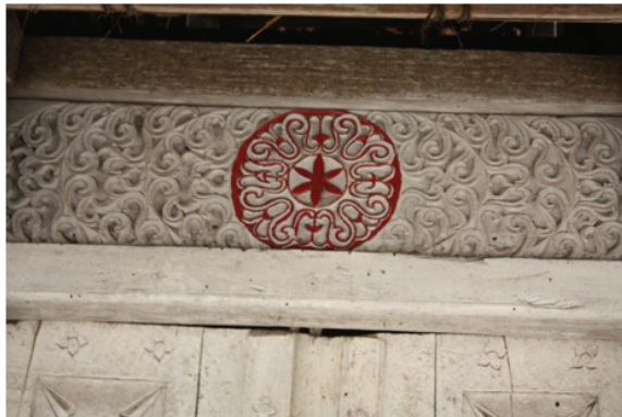
Foto 8. Pintu masjid kuno Rohomoni yang kaya akan ragam hias pada panel-panel pintu.