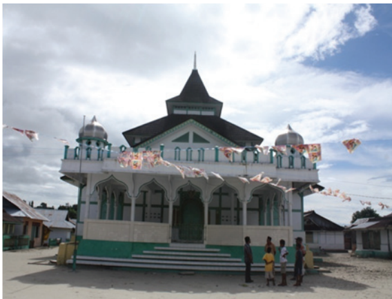
Foto 1. Masjid Kuno di Negeri Pelauw, Kecamatan Pulau Haruku, Maluku Tengah.