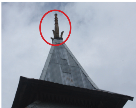
Foto 7. Tiang Alif (dalam lingkaran warna merah) Pada Masjid Kuno Kabauw, di Negeri Kabauw Pulau Haruku.

Ciri spesifik lainnya dan mungkin karakteristik khusus masjid kuno di Maluku, yakni di tiga masjid kuno di Pulau Haruku, seluruhnya hanya memiliki satu pintu, yakni