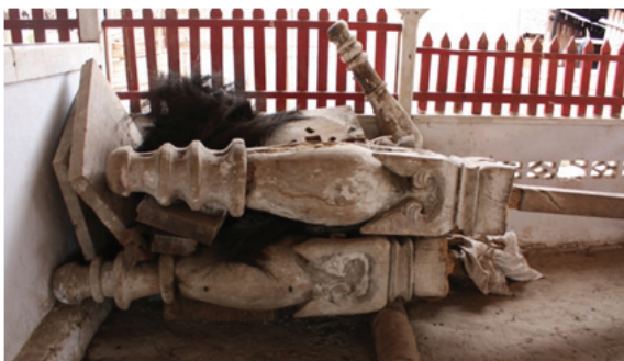
Foto 6. Tiang Alif di Masjid Kuno Rohomoni, terbuat dari kayu Bintanggur yang sudah tidak digunakan lagi.

budaya prasejarah dalam konsep Islam pada masyarakat-masyarakat lokal, termasuk di Maluku yang kental mempertahankan adat dan tradisi dari para leluhur. Dari segi arsitektur, atap tumpang dan simbolisasi tiang alif, menunjukkan bahwa di Pulau Haruku antara sinkretisme dan sufisme dipahami dalam konteks yang saling berintegrasi atau berasosiasi. Tiang alif, sebagai simbol 'tauhid' adalah sebuah upaya sufisme Islam yakni tingkatan ma'rifat menuju Ketuhanan Yang Tunggal (monotheisme), di satu sisi berbaur dengan kepercayaan lokal bahwa tiang alif tersebut merupakan simbol laki-laki (phallus) sekaligus sebagai simbol pelindung umat, yang merupakan budaya pada masa berkembangnya megalitik.