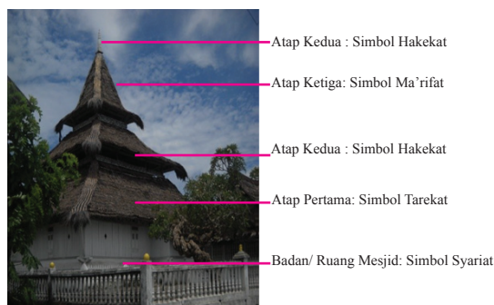
Foto 5. Makna simbol masjid dan atap tumpang dalam pemahaman komunitas Islam di Pulau Haruku

Selain itu, masjid-masjid kuno di wilayah penelitian, semuanya mempunyai ‘tiang alif’ dipuncak atap tumpang. Tiang alif merupakan ciri spesifik yang paling menonjol yang