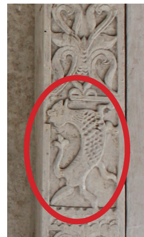
Foto 12. Hiasan pada panel pintu (sebelah kanan) Masjid Hatuhaha, Desa Rohomoni, Pulau Haruku, yang menggambarkan tubuh binatang (dalam lingkaran merah).

Selain itu salah satu aspek lainnya yang menarik adalah ornamen dan hiasan masjid kuno, contohnya adalah hiasan pada pintu masjid kuno Hatuhaha, di negeri Rohomoni, Pulau Haruku. Pada masjid tersebut, di bagian luar terdapat ornamen berupa mahluk antropomorphis , yakni penggambaran mahluk bertubuh binatang namun berkepala menyerupai wajah manusia. Ornamen