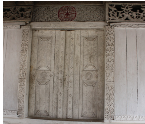
Foto 8. Pintu masjid kuno Rohomoni yang kaya akan ragam hias pada panel-panel pintu.

Ciri spesifik lainnya dan mungkin karakteristik khusus masjid kuno di Maluku, yakni di tiga masjid kuno di Pulau Haruku, seluruhnya hanya memiliki satu pintu, yakni