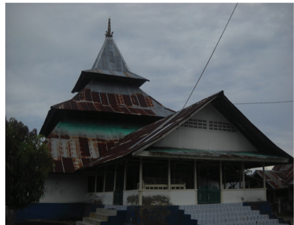
Foto 2. Masjid Kuno di Negeri Kabauw, Kecamatan Pulau Haruku, Maluku Tengah.