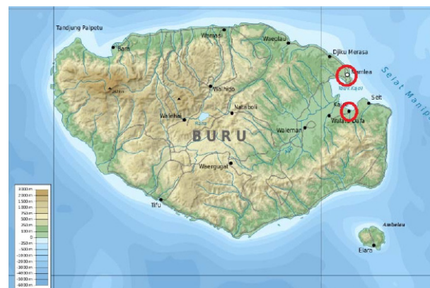
Peta 1. Judul peta (Sumber: .....)