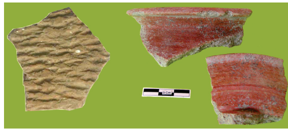
Foto 3. Pecahan tembikar Neolitik: hias tera tali khas kawasan Indonesia Barat (kiri) dan slip merah khas kawasan timur (kanan)

Di antara teknologi itu, tembikar merupakan produk yang paling umum, seperti terbukti dari tinggalannya yang selalu ditemukan