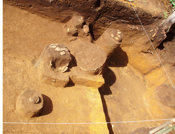
Foto 8. Kubur tempayan dari Situs Paleometalik Lologadang, Kerinci, Jambi

Di lain pihak keberadaan ketiga unsur budaya itu memaknai kondisi sosial-budaya masyarakat di kala itu. Keberadaan bangunan Megalitik dan tempayan mencerminkan keberadaan undagi atau ahli pahat batu dan pembuat tembikar di masyarakat, sementara kehadiran benda-benda logam mengindikasikan telah terciptanya aktivitas perdagangan regional. Di sisi lain pemanfaatan tempayan dan sarkofagus sebagai wadah kubur di samping keberadaan kubur tanpa wadah memmanifestasikan keberadaan