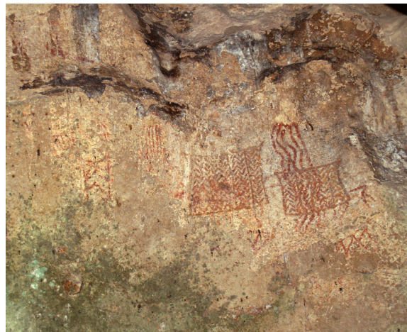
Foto 1. Lukisan di Gua Harimau, OKU satu-satunya ditemukan di Sumatra

Isu utama dan menjadi perdebatan yang berkepanjangan tentang Austronesia Prasejarah adalah: “Asal-usul, diaspora, perkembangan penutur dan budaya Austronesia di Nusantara”. Beberapa situs yang menjadi acuan pada periode ini, antara lain: kompleks situs Kalumpang di sepanjang DAS Karama, Sulawesi Barat (Simanjuntak et al. 2007); Passo dan situs lain di seputar Danau Tondano, Sulawesi Utara (LPA 2009; 2010); Kerinci dengan sebaran situs-situsnya di Jambi (Simanjuntak 2010a); serta Gua Harimau dan gua-gua lain di wilayah Padang Bindu, Sumatra Selatan (LPA 2009; 2010). Data dari situs-situs ini dilengkapi dengan studi kompilasi dan hasil-hasil penelitian