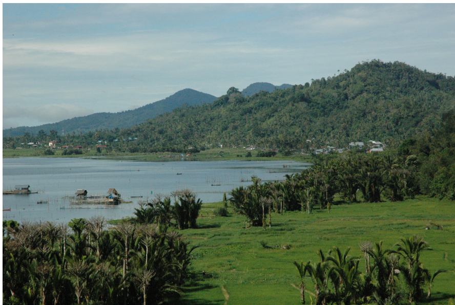
Foto 2. Situs Passo yang menempati Desa Passo di tepi baratdaya Danau Tondano

Situs Passo merupakan salah satu contoh yang menarik dari hunian terbuka. Sebelum kedatangan Penutur Austronesia, situs yang terletak di tepi Danau Tondano ini sudah dihuni manusia lain sejak sekitar 7500 BP. Penghuninya memanfaatkan kerang-kerangan danau sambil berburu hewan darat dengan menggunakan alat-alat batu, terutama obsidian (Bellwood 1976). Cangkang-cangkang yang isinya sudah dimakan lama-lama bertumpuk hingga membentuk gundukan. Belum jelas apakah kedatangan