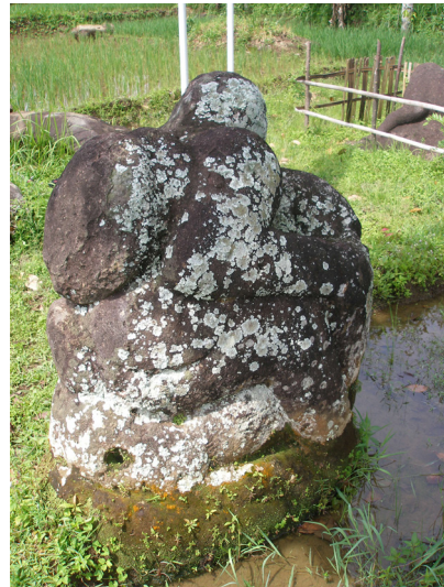
Foto 7. Arca manusia menunggang kerbau sambil menggendong nekara di Situs Geramat, Pasemah.

Tinggalan Megalitik sebagai simbol atau sarana pemujaan leluhur sangat menonjol di Nusantara. Hal ini menunjukkan budaya ini diterima masyarakat luas, bahkan sangat cocok dengan alam pikir masyarakat Nusantara. Buktinya, seperti yang kita lihat sekarang, budaya tersebut terus berlanjut dan masih bertahan di masyarakat tertentu. Jenis-jenis tinggalan yang paling umum adalah menhir, dolmen, arca manusia dan hewan, punden berundak, menhir, lumpang, dan wadah kubur dari batu. Di luar itu masih ada kursi batu, batu bersusun, batu dakon, batu silindris, dll. Menyangkut wadah kubur, bentuk-bentuknya bervariasi dengan kekhasan-kekhasan lokal. Seperti contoh, peti kubur batu ( stone cist ) terdapat di situs kubur kalang di pegunungan Kendeng Utara antara Blora dan Bojonegoro; Tong batu ( stone vat ) dijumpai di