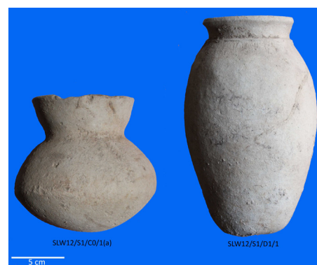
Foto 4. Contoh tembikar dari situs Neolitik Sulengwaseng, Solor, NTT