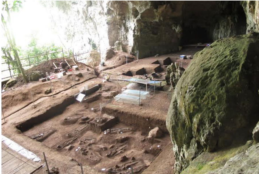
Foto 6. Temuan kubur Neolitik-Paleometalik di Gua Harimau, Sumatra Selatan