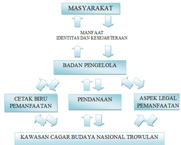
Gambar 1. Satu contoh penyebaran informasi paket wisata sejarah yang ditempelkan di kaca jendela tempat satpam PIM

Model pemanfaatan KCBN Trowulan (Gambar 1) secara konseptual, berhulu pada KCBN Trowulan yang harus dimanfaatkan dengan berbasis keinginan masyarakat dan sejalan dengan konsep pelestarian. KCBN Trowulan memerlukan aspek legal yang mengatur seluruh aktivitas yang dilakukan di situ, sebuah perencanaan program yang tertuang dalam cetak biru, dan dukungan dana dari berbagai sumber. Keseluruhan komponen-komponen tersebut dikelola oleh badan pengelola sesuai dengan amanat UUCB. Pengelolaan KCBN Trowulan pada akhirnya bermuara untuk kepentingan masyarakat yaitu masyarakat memperoleh setidaknya-tidaknya dua manfaat besar, yaitu pembentukan jatidiri bangsa dan kesejahteraan.