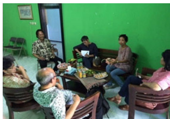
Foto 1. Wawancara dengan Ketua Gotrah Wilwatikta (komunitas pelestari budaya) di Mojokerto

pedagang yang menjual patung terakota dan perunggu yang juga menjual kaos sablon serta makanan dan minuman. Tindakan ilokusinya pun sesuai dengan tindak perlokusi yang diharapkan. Pendekatan yang baik menghasilkan 200 pemilik rumah bersedia rumahnya dipugar walau pun ia tidak terlalu jelas rumah model apa sementara dari pihak pemerintah sudah dirancang oleh Dinas Pekerjaan Umum (PU) Cipta Karya dan Tata Ruang Jatim. Istilah atau kata-kata yang diutarakannya dalam bahasa Jawa selalu diusahakan untuk diterjemahkan. Dengan demikian, penyampaian informasi yang banyak dimilikinya tercapai.