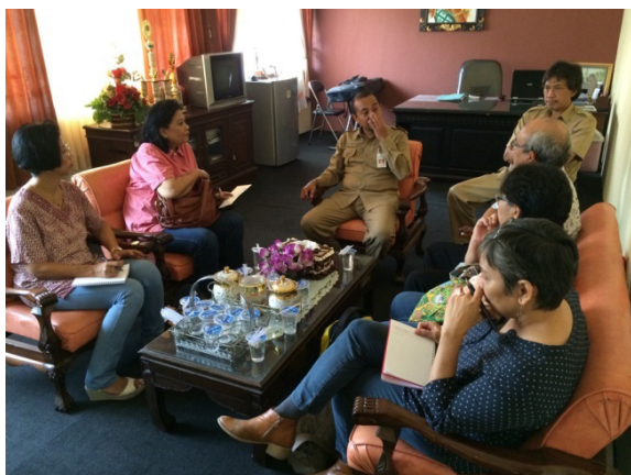
Foto 4. Wawancara dengan Kepala Dinas Pemuda, Olahraga, Pariwisata, dan Kebudayaan, Kabupaten Mojokerto

Meskipun Perda cagar budaya kawasan Trowulan belum diterbitkan, namun Pemkab Mojokerto secara rutin melaksanakan beberapa program fisik dan non fisik berkenaan dengan upaya pelestarian cagar budaya di Trowulan. Menurut narasumber dari Dinas Kebudayaan, Pariwisata, dan Olahraga program fisik yang dilaksanakan antara lain: