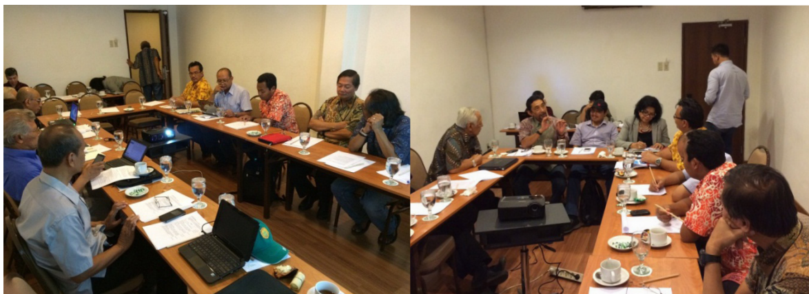
Foto 2 dan 3. Diskusi group dengan para pejabat dan mantan pejabat pemerintah pusat, pejabat Pemda, dan pemerhati di Hotel Cemara Jakarta, 2015