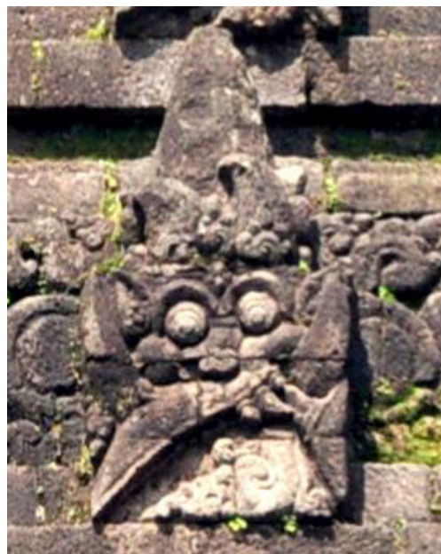
Foto 5. Antefiks dihias Kepala Garuda di Lapisan Atap Candi Kidal

Selain itu pada atap Candi Kidal terdapat antefik yang diberi hiasan relief kepala-kepala Garuda, berderet menghias lapisan atap. Secara sepintas terlihat seperti kepala kāla , tetapi apabila diamati ternyata masing-masing “kepala kāla ” tersebut mempunyai paruh yang digambar miring (Foto 5).