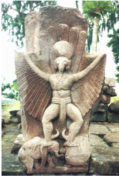
Foto 6. Garuda berdiri menginjak Gajah dan Kura-Kura

diinjak Garuda tersebut adalah “bekal” dari Sang Winata, ibu Garuda, dengan pesan boleh dimakan apabila Garuda lapar.