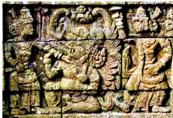
Foto 2. Relief Garuḍa diapit Siwa dan Wisnu di Candi Kedaton

Selain adegan Samudramanthana, terdapat relief Garuḍeya yang ditemukan di dinding Candi Kedaton, di lereng Gunung Hyang, Probolinggo. Cerita Garuḍeya dipahat pada 9 buah panil. Relief ini menceritakan Garuḍa berangkat mencari amṛta untuk menebus ibunya dari perbudakan, dan diakhiri dengan adegan Garuḍa berhasil merebut guci amṛta dan menyerahkannya kepada Wisnu.