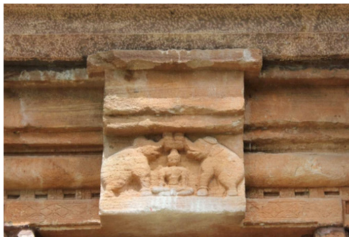
Foto 4. Ornamen Gaja-Lakṣmī di pintu kuil Badami-Mahakuta