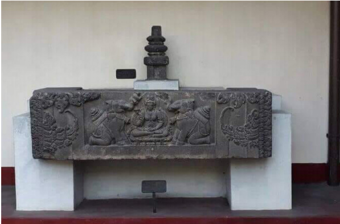
Foto 1. Relief Gaja-Lakṣmī di Museum Sonobudoyo

Berdasarkan keterangan diperoleh dari Buku Induk Koleksi Museum Sonobudoyo , koleksi tersebut merupakan hibah dari Java Instituut, yaitu instansi yang bergerak untuk melestarikan budaya Indonesia, khususnya Jawa, Bali, dan Madura. Kapan tepatnya hibah ini dilakukan tidak tercatat secara jelas, tetapi diperkirakan tahun 1952 ketika pengelolaan museum pindah dari Java Instituut ke Pemerintah Kasultanan Yogyakarta. Koleksi yang memiliki nomor registrasi 11704 dan nomor inventaris 04.2.57 berukuran panjang 171 cm, lebar 47 cm, dan tebal 48,5 cm. Berdasarkan bentuk, koleksi ini diperkirakan ambang pintu atas candi yang ditemukan di Candi Nagasari, Sorogedug, Jawa Tengah.