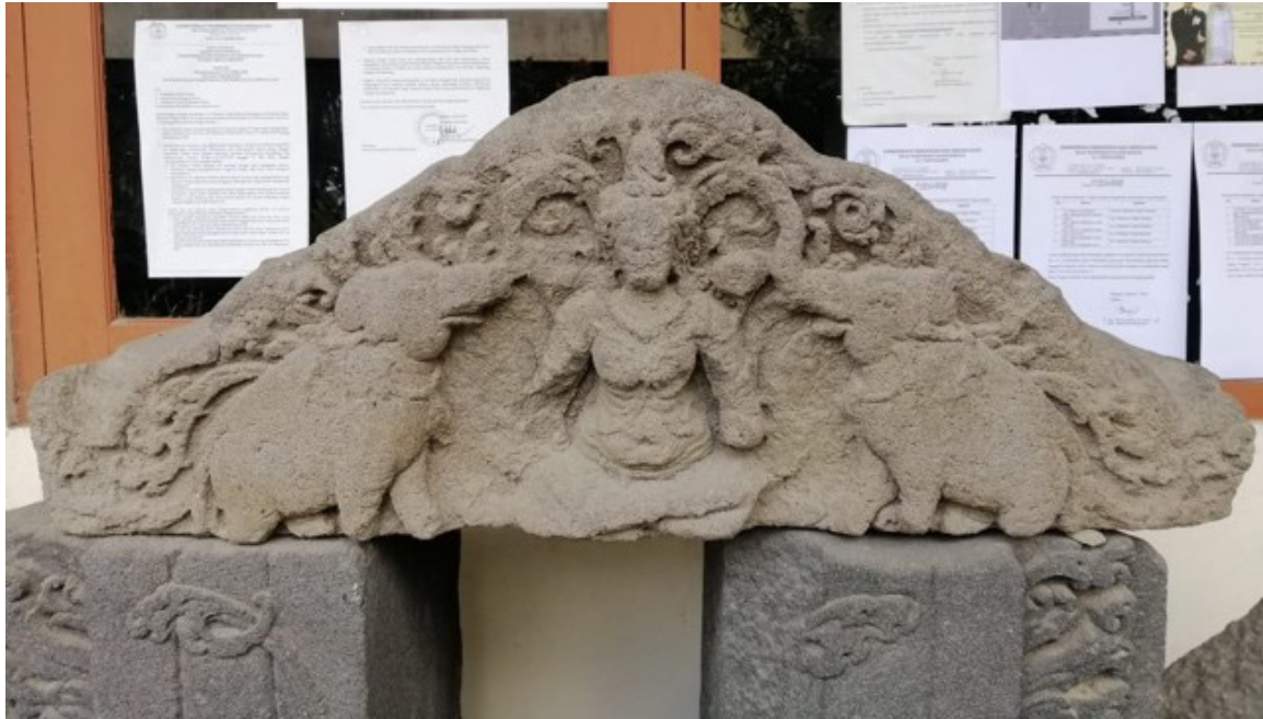
Foto 6. Ornamen Gaja-Lakṣmī yang berada di Kantor BPCB Yogyakarta Unit Prambanan

Gaja-Lakṣmī sering disebut juga dengan Gaja Abhiseka-Lakṣmi. Penyebutan ini didasarkan pada gambaran gajah yang menyiramkan air kepada Dewi Lakṣmī yang mirip dengan prosesi penabrisan ( abhiseka ) seorang raja (Suresh 1991, 351 dan Sankrityayan 2016, 304). Lebih lanjut, Sankrityayan menegaskan bahwa gerakan tersebut diibaratkan sebagai kekuatan agung. Dewi diasosiasikan dengan kekuasaan kerajaan, sedangkan proses penabrisan (air yang dituangkan oleh gajah) tersebut diartikan sebagai pengharapan terhadap pengaruh raja bagi keberlangsungan kerajaan dan kesejahteraan.