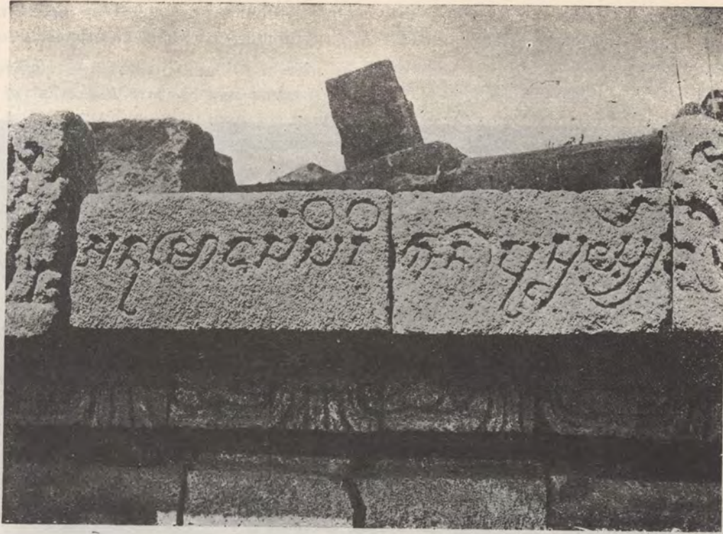
21. Pertulisan: Anumoda Sang Sirikan Pu Surya, Plaosan (Surakarta).

Dalam penafsiran kami sering mendapatkan bahwa dalam beberapa bagian yang tertentu kami sama sekali tidak dapat melihat ujung pangkalnya. Dalam hal yang telah betul pembacaannya, maka kami kembali lagi demikian kami harus menimbang, apakah bagian-bagian itu ke batu (maupun cetakan atau foto) dan memeriksa samanya satu sama lain, sehingga akhirnya kami mendapatkan pembacaan yang betul.