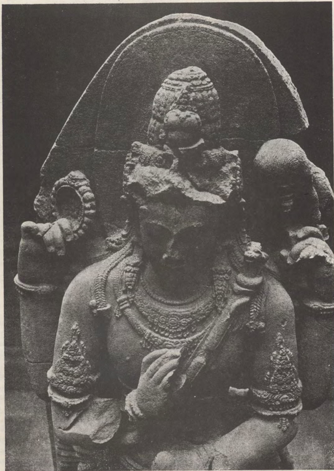
22. 22. Patung Mahadewa, Loro Jonggrang, Prambanan (900 M.). M.).