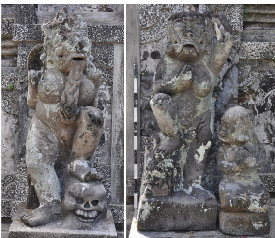
Foto 3 dan 4. Arca Ratna Nan Girah (Rangda) (kiri); Arca Kalika dan Kaliki (kanan)

Arca Rangda merupakan arca penjaga yang berada di sebelah kanan depan gapura berbentuk candi bentar . Gapura ini merupakan pintu masuk halaman terluar Pura menuju halaman jaba tengah . Posisi arca duduk di atas