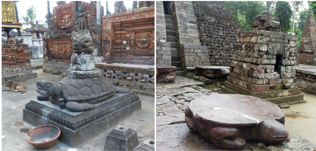
Foto 7 dan 8. Hiasan kura-kura dalam halaman Pamerajan (kiri); Hiasan kura-kura di halaman Candi Suku (kanan)