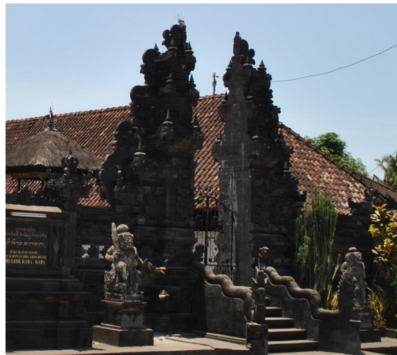
Foto 1. Hiasan Naga pada pipi tangga

Pipi tangga Pura pada halaman terluar dihiasi oleh ular naga, hiasan seperti ini meskipun bentuknya tidak sama, sudah ada pada bangunan