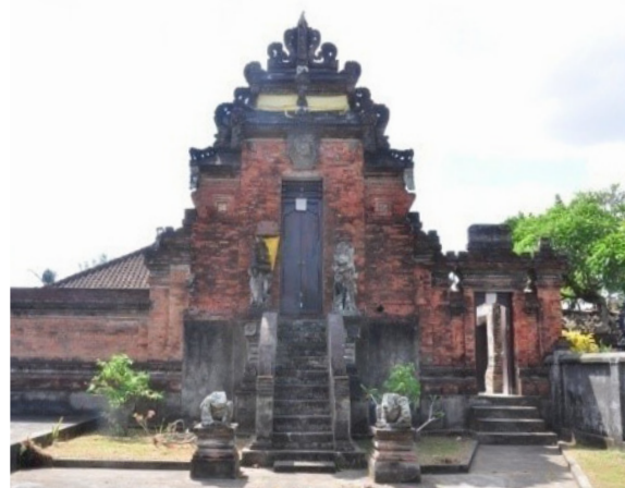
Foto 2. Gapura paduraksa menuju halaman jeroan

Pintu gerbang Pamĕrajan Kaba-Kaba berbentuk candi bentar yaitu bentuk gapura yang dibelah di bagian tengah secara vertikal (Foto 1), gapura ini berada di halaman jaba menuju halaman jaba tengah . Selain gapura candi bentar juga terdapat pintu gerbang berbentuk paduraksa (Foto 2) yang berada di halaman jaba tengah menuju halaman jeroan atau menuju tempat