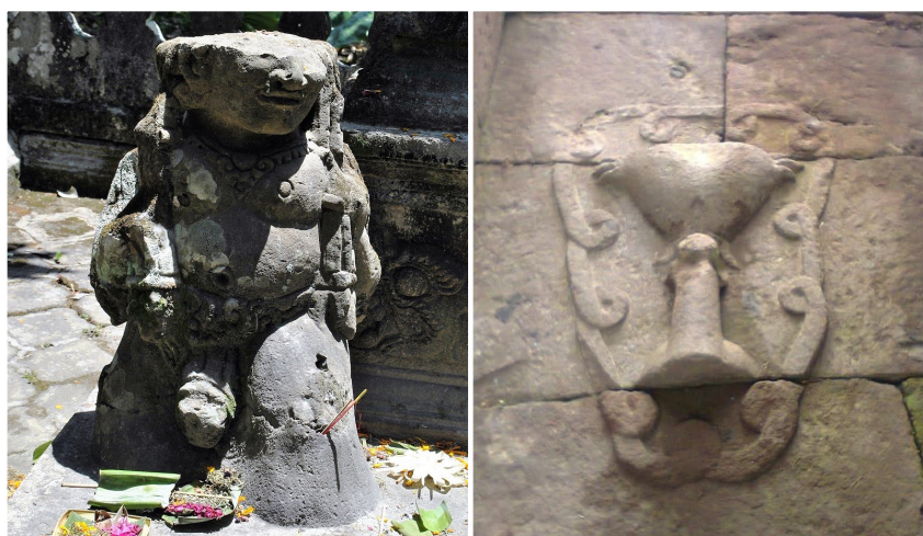
Foto 5 dan 6. Arca penjaga bersifat tantrayana (kiri); Relief timbul pada Candi Sukuh (kanan)

Mengenai penggambaran alat kelamin yang bersifat vulgar dapat kita temukan juga di bagian bawah gapura Candi Sukuh, suatu candi yang dibangun pada masa Majapahit. Relief yang dimaksudkan berbentuk alat kelamin laki-laki dan wanita yang digambarkan naturalistik. Alat kelamin laki-laki menghadap ke arah luar sedangkan alat kelamin wanita menghadap ke arah dalam. Relief timbul tersebut sesungguhnya merupakan lambang kesuburan, yang telah ada sebelum zaman Hindu, misalnya ditemukan di Kalimantan Tengah diberi istilah kelot yang dipergunakan untuk menjauhkan roh-roh jahat pengganggu manusia (Padmapuspita tt: 124). Arca penjaga Pamērajan ini digambarkan vulgar dimaksudkan untuk menolak bala atau menjauhkan roh-roh jahat yang akan mengganggu manusia yang akan melakukan pemujaan.