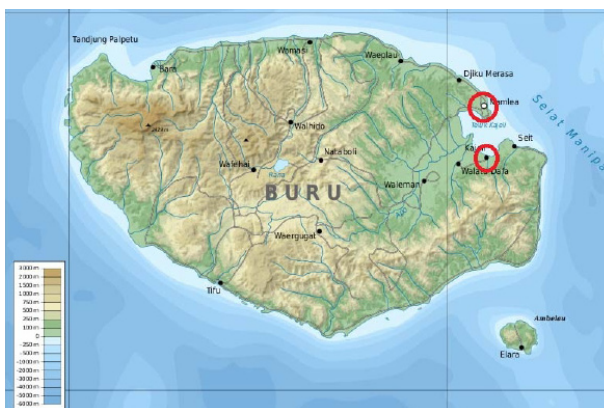
Peta 1. Judul peta