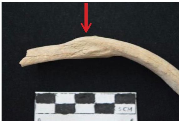
Foto 6. Fraktur pada rusuk (tampak superior)

bagian kanan. Tulang rusuk tersebut patah ketika individu ini masih hidup dan telah tersambung kembali. Bagian ini dapat terlihat secara visual sehingga tidak memerlukan pemeriksaan menggunakan Sinar-X sebab dari patahnya tulang rusuk tidak dapat diketahui.