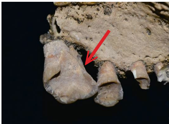
Foto 1. Fraktur pada molar pertama maxilla kiri

karena trauma dan tidak terdapat tanda-tanda bahwa trauma tersebut disebabkan oleh karies gigi. Selain itu, atrisi pada Individu Nomor 38 dapat dikategorikan sebagai atrisi tingkat lanjut dan terdapat pada seluruh permukaan oklusal. Pada individu ini tidak ditemukan karies yang merupakan penyakit gigi umum.