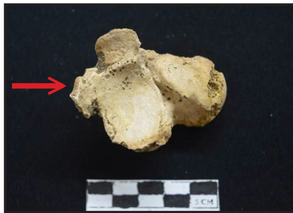
Foto 3. Osteopit pada talus (tampak inferior). Eburnasi tidak tampak pada foto

osteopit dan porositas. Pada pergelangan kaki, terutama bagian talus , calcaneus , dan jari-jari kaki terdapat osteopit di bagian persendian dengan tulang lain. Terlihat adanya eburnasi atau kilapan pada bagian facies intervertebralis dan talus . Osteopit, eburnasi dan porositas pada persendian menunjukkan osteoarthritis.