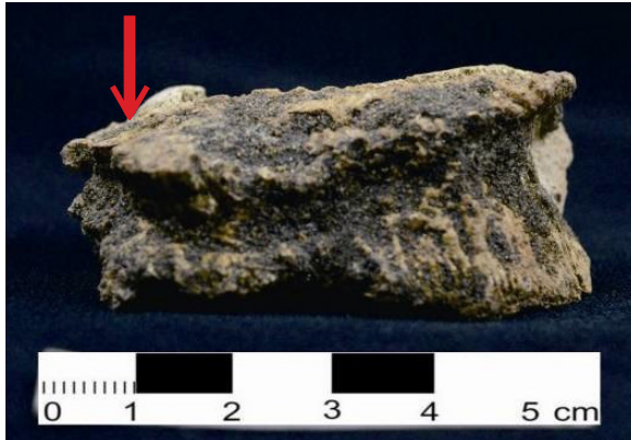
Foto 5. Tubuh lumbar yang runtuh (tampak anterior)

bagian kanan. Tulang rusuk tersebut patah ketika individu ini masih hidup dan telah tersambung kembali. Bagian ini dapat terlihat secara visual sehingga tidak memerlukan pemeriksaan menggunakan Sinar-X sebab dari patahnya tulang rusuk tidak dapat diketahui.