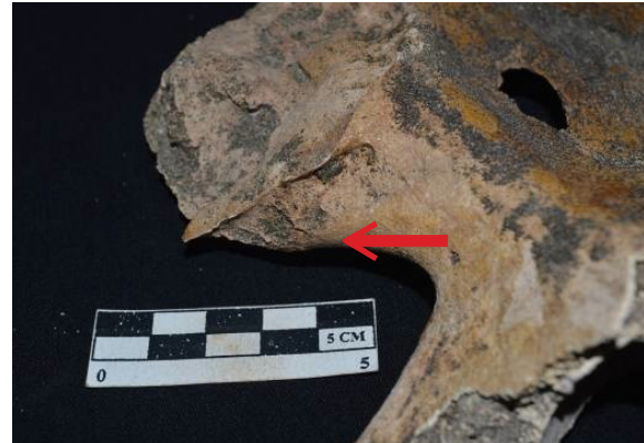
Foto 7. Sulcus preauricularis pada os coxa kiri

Pada Individu Nomor 38 terdapat sulcus preauricularis yang digunakan sebagai penentu jenis kelamin dan dapat digunakan sebagai penanda bahwa individu tersebut telah melalui proses melahirkan. Sulcus preauricularis terletak pada sisi inferior dari facies auricularis yang merupakan persambungan antara pelvis dan sacrum . Sulcus preauricularis terdapat pada pelvis sebelah kiri dan kanan dengan keadaan sedikit tertutup pasir di beberapa bagian, namun dapat dengan jelas terlihat bahwa ukurannya lebar dan dalam. Selain itu, dasar sulcus preauricularis individu ini berada dalam keadaan yang tidak rata dan berlubang.