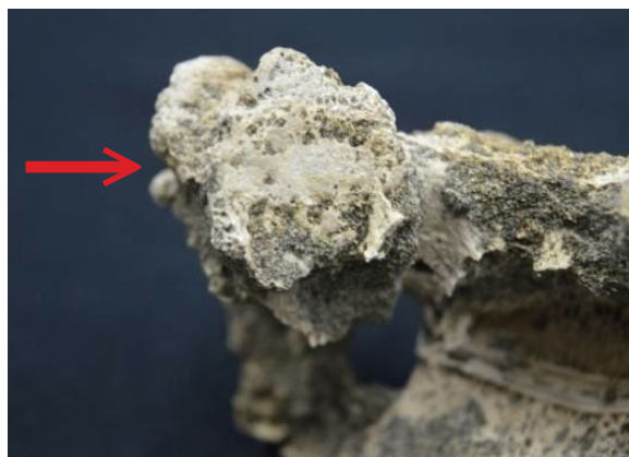
Foto 4. Porositas facies articularis superior pada sacrum

Pada bagian lumbar kelima tubuh lumbar sebelah kiri lebih tinggi dari sebelah kanan sehingga membuat tubuh individu lebih condong ke arah kanan. Hal ini terjadi karena runtuhnya badan lumbar yang bisa disebabkan oleh faktor usia atau kebiasaan mengangkat beban yang berat. Pada penelitian ini runtuhnya lumbar dikategorikan pada faktor usia karena individu ini berumur sekitar lima puluh tahun ketika meninggal.