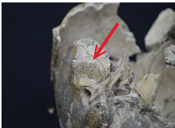
Foto 2. Degenerasi persendian Temporomandibular pada fossa mandibularis

Gangguan kesehatan yang paling mendominasi adalah osteopit dan porositas pada bagian persendian. Gangguan ini dapat ditemukan pada clavicula , patella , bagian tubuh lumbar dan facies articularis lumbar , serta basis ossis sacri dan facies articularis superior pada sacrum . Pada tulang tangan ( os carpi ) terdapat osteopit dan porositas yang menunjukkan bahwa individu ini mendapatkan rasa nyeri ketika menggerakkan pergelangan tangan dan jari-jarinya. Pada bagian facies articularis capitatis dan tuberculum costae juga terdapat