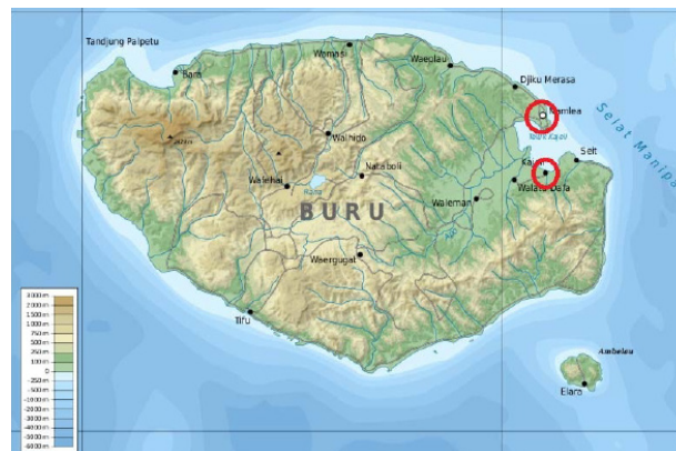
Peta 1. Judul peta (Sumber: .....)