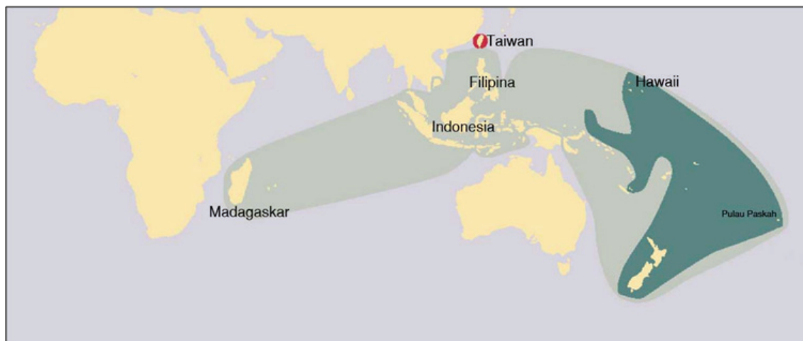
Peta 1. Peta persebaran Penutur Austronesia di Polinesia, Pasifik, Asia Tenggara hingga pantai timur Afrika (Diamond 2000)

sebagai dasar pemahaman kontekstual, sekaligus sebagai pedoman dalam penentuan strategi dan rancangan komprehensif penelitian. Kegiatan ini disusul oleh penyelenggaraan seminar nasional dan internasional, penelitian lapangan, dan publikasi (Simanjuntak 2011).