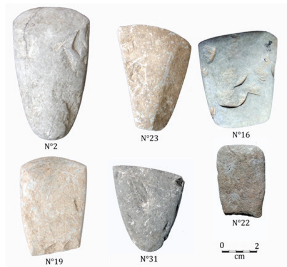
Foto 1. Variasi tipe beliung persegi dari Situs Pain Haka

Salah satu sumber data terbaru tentang kehadiran dan kehidupan Penutur Austronesia awal berasal dari Situs Pain Haka, di wilayah Kecamatan Tanjung Bunga, Kabupaten Flores Timur. Situs yang terletak di bagian ujung semenanjung dan yang jauh dari permukiman sekarang ini merupakan situs yang sangat penting untuk mengisi kelangkaan data dari Flores. Penelitian kerjasama Puslit Arkenas dan IRD yang masih berlangsung hingga kini menggambarkan situs hunian pantai dengan penguburan di dalam tempayan dan penguburan tanpa wadah. Temuan asosiasi berupa cangkang moluska dan sisa ikan membuktikan adanya pemanfaatan biota laut. Sejumlah kecil jenis cangkang tertentu bahkan dimanfaatkan sebagai bahan baku perhiasan atau ornamen. Penemuan beberapa beliung persegi dari batuan