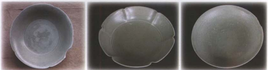
Foto 8. Contoh piring