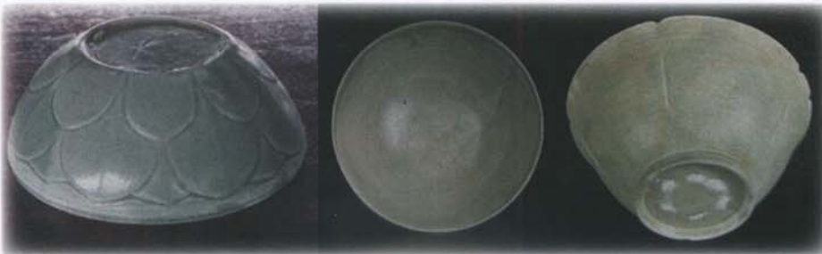
Foto 3. Contoh mangkuk