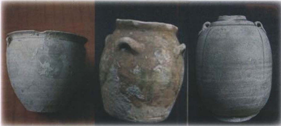
Foto 2. Contoh Yue ware pasu dan guci