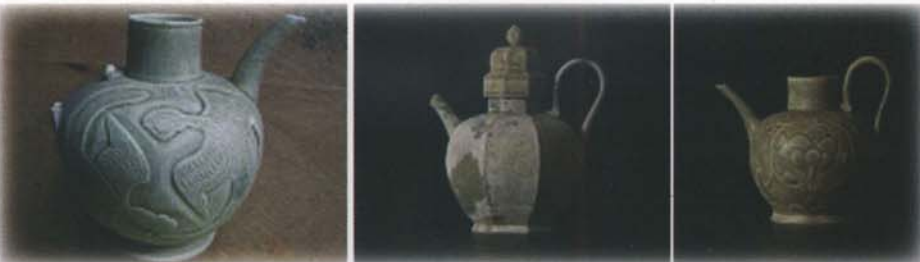
Foto 4. Contoh teko