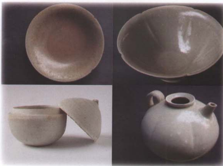
Foto 17. Piring (dasar dalam samar-samar hiasan kura-kura); mangkuk; cepuk; teko