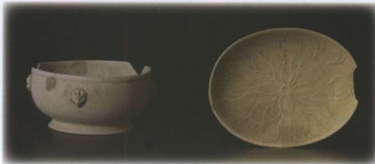
Foto 15. Mangkuk dan piring