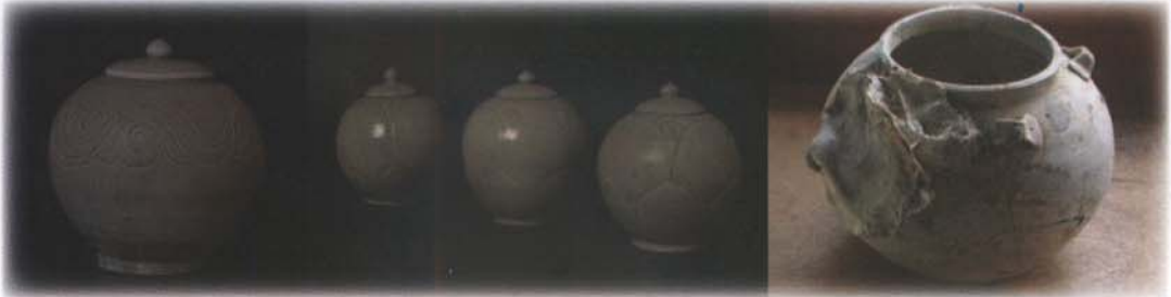
Foto 5. Contoh guci