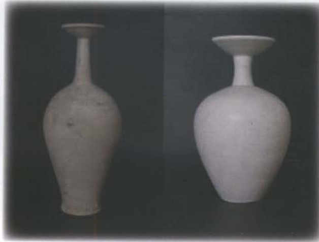
Foto 18. Botol leher panjang dan leher pendek

Barang-barang komoditi lainnya dalam muatan kapal ini, ialah: manik-manik, tembikar bahan halus ( fine paste ware ), botol kaca, mata uang (kepeng), pipisan batu, barang-barang dari emas, timah, dan perunggu, kristal, batu permata, dan teleskop kapal