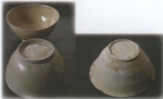
Foto 14. Contoh mangkuk