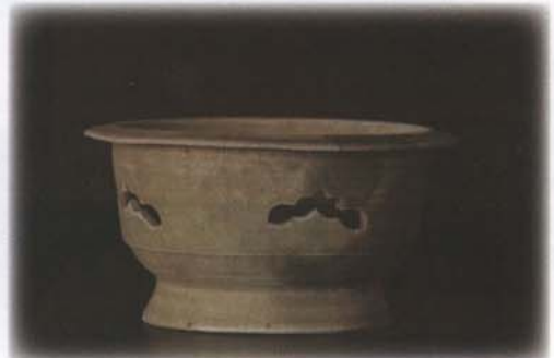
Foto 7. Pedupaan