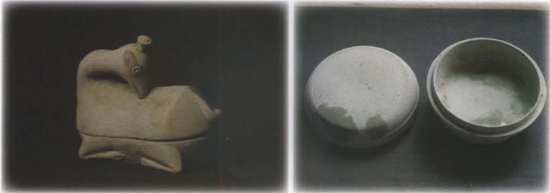
Foto 13. Cepuk bertutup binatang dan bulat