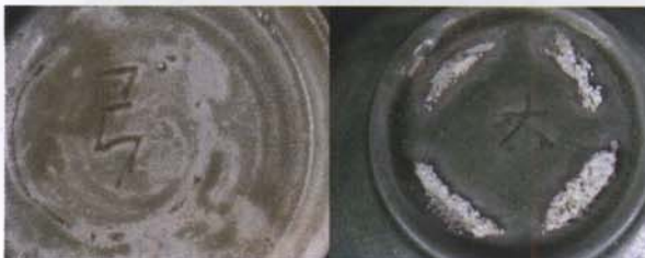
Foto 21. Tanda di bagian dasar luar

Beberapa keramik, di bagian dasar luar terdapat tanda da/ta: yang menunjukkan arti kebesaran: