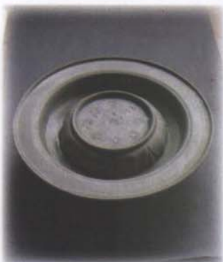
Foto 11. Tempat tinta