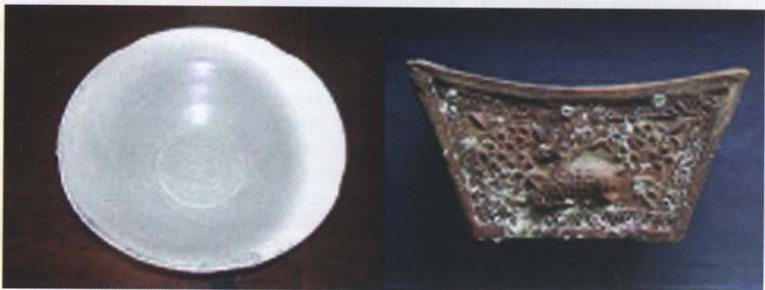
Foto 1. Contoh Hebei ware mangkuk dan bantal