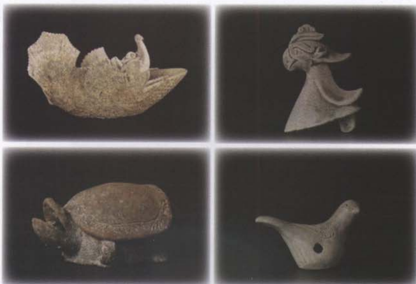
Foto 10. Berbagai figurine