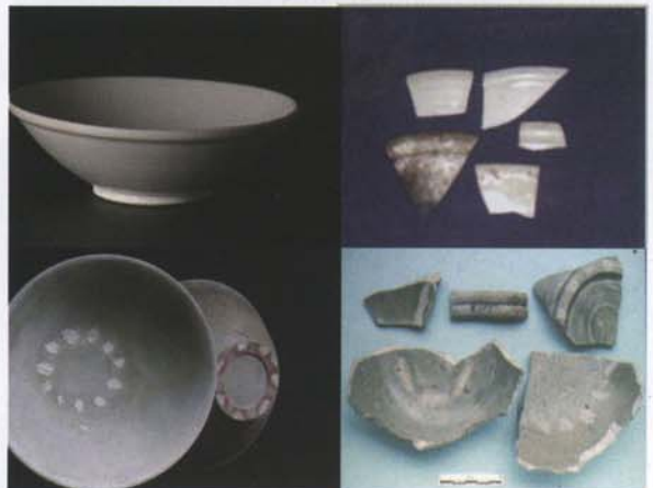
Foto 22. Persamaan kualitatif keramik muatan kapal karam dengan pecahan dari situs arkeologi (Jombang dan Banten Girang)

Perbandingan kualitatif keramik muatan kapal ini menunjukkan persamaan dengan hasil penelitian di beberapa situs, baik di Nusantara maupun luar Nusantara dalam hal ini negara-negara Asia Tenggara dan Asia Timur. Situs-situs di Nusantara , antara lain: Barus (Situs Lobu Tua); Medan (Kota Cina); Palembang (Bukit Seguntang, Karanganyar); Jambi (Lambur, Nipah Panjang, Siti Hawa, Muara Sabak); Jawa Barat (Situs Banten Girang, DAS Citarum-Krawang); Jawa Timur (Situs Leran Manyar Gresik, Situs Jombang, Trowulan). Sementara itu, persebaran keramik di luar Nusantara , antara lain terdapat di Korea, Jepang (Nabuo Yamamoto 1994), Philipina (WP Ronquillo 1994), dan Thailand (Amara Srisuchat 1994). Jenis yang sama barang-barang hijau produk Zhejiang, Yue ware berupa mangkuk, baik polos dengan tanda bekas tumpangan maupun bermotif teratai ( lotus ), floral, dan phoniex berhadapan dan guci yang biasa disebut dengan olive green glazed .