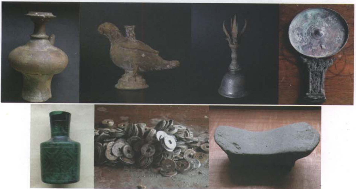
Foto 19. Tembikar fine paste ware; artefak logam; botol kaca; pipisan batu;