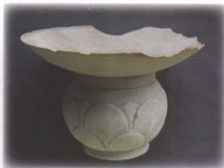
Foto 9. Paidon