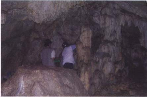
Foto 21. Gua Batu Meja dengan keindahan ornamen-ornamennya

Dengan memperhatikan kondisi fisik gua berupa sirkulasi udara dan intensitas sinar yang buruk, kondisi gua yang sangat lembab, tidak adanya temuan arkeologi, baik di dalam ruang maupun di sekitar gua, maka disimpulkan bahwa gua ini bukan merupakan gua hunian masa lalu.