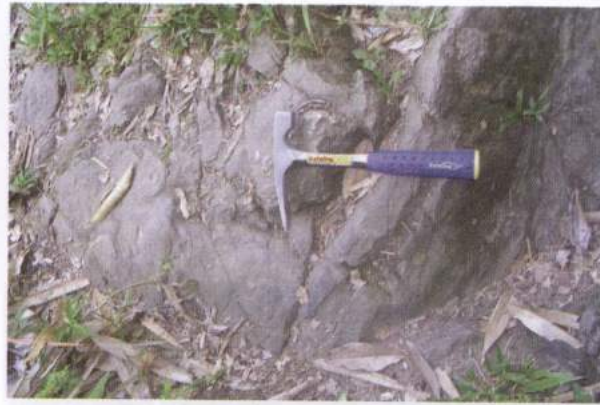
Foto 8. Batuan Sabak, salah satu batuan penyusun wilayah Amahai

Batusabak ( slate ) termasuk dalam jenis batuan metamorf yang berwarna abu-abu tua, dan lapuk berwarna hitam keabu-abuan. Bertekstur blastopelitik yaitu palimpsest (tekstur sisa) yang bersifat lempung. Struktur slaty cleavage yaitu foliasi dari penjajaran mineral dalam suatu bidang tertentu dan rekristalisasi kecil. Berbutir halus dan mudah terbelah melalui bidang-bidang foliasi. Batusabak merupakan hasil metamorfis regional ( epizone ).