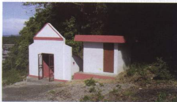
Foto 13. Pintu masuk Gua Akohi yang dibangun oleh Pemda setempat, gua tersebut merupakan objek wisata

Gua ini berjarak 200 meter dari laut ke arah selatan. Saat ini gua tersebut telah dijadikan objek wisata oleh Dinas Kebudayaan dan Pariwisata Kabupaten Maluku Tengah (Jatmiko dkk. 2007).