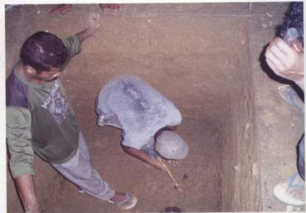
Foto 10. Kotak TP-1 Gua Tanah Merah, kedalaman kotak tersebut adalah 325 cm

Kotak TP-1 terletak di tenggara datum point (dp 0,0) dengan jarak sekitar 1 meter dari dinding barat gua. Ekskavasi dilakukan hingga mencapai kedalaman 325 cm, tanpa menemukan satupun artefak yang dapat memberikan indikasi terhadap pola hunian gua.