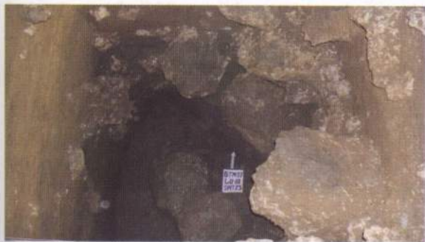
Foto 12. Kotak TP-3 berjarak 300 cm dari sisi selatan kotak TP-2, kedalaman kotak tersebut adalah 250 cm

Kotak TP-3 dibuka pada arah 90^{\circ} dan berjarak 300 cm dari sisi selatan kotak TP-2. Dengan demikian, sisi selatan kotak TP-2 sejajar dengan sisi utara kotak TP-3. Pada kedalaman 175 cm ditemukan satu buah fragmen batuan sekis yang diduga sebagai artefak, mempunyai bentuk datar dan terdapat jejak cekungan (bekas tumbukan). Pada salah satu bagian permukaan yang datar dan halus terdapat bekas jejak asahan, sehingga batu ini diduga juga dimanfaatkan sebagai batu asah. Adapun ukuran batu panjang: 21 cm, lebar: 15 cm, dan tebal: 6,5 cm. Fragmen batuan ini diduga berasal dari masa Resen serta diduga telah tertransformasi dari atas luar gua, mengingat banyaknya tanah urugan. Ekskavasi dilakukan hingga mencapai kedalaman 250 cm (Jatmiko dkk. 2007).