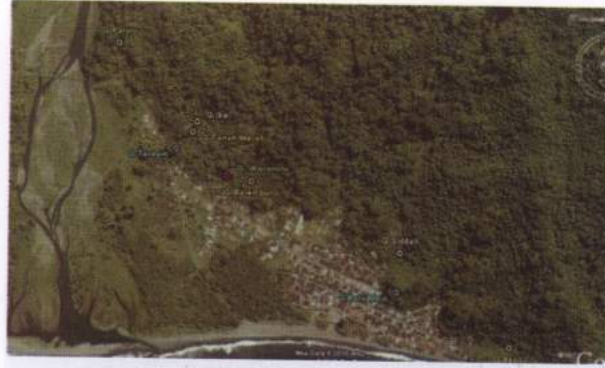
Peta 3. Lokasi gua-gua di wilayah Amahai (Desa Tamilaow)

Dengan memperhatikan kondisi fisik gua berupa sirkulasi udara dan intensitas sinar yang buruk, kondisi gua yang sangat lembab, tidak adanya temuan arkeologi, baik di dalam ruang maupun di sekitar gua, maka disimpulkan bahwa gua ini bukan merupakan gua hunian masa lalu.