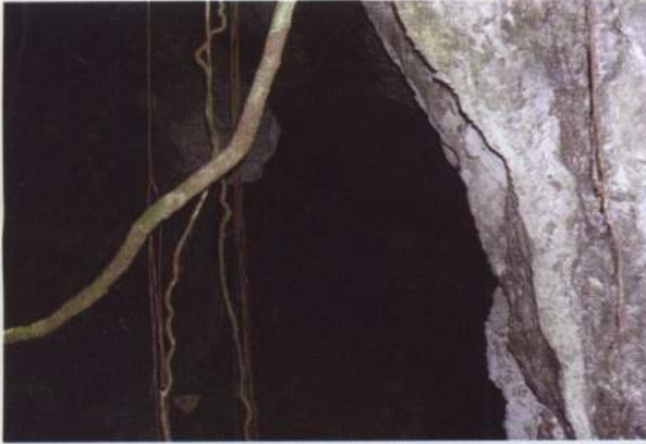
Foto 18. Gua Haopinalo yang terletak di sebelah barat dari kelompok gua-gua di Desa Tamilaow

Gua Haopinalo terletak pada 3^{\circ}19'11,8'' Lintang Selatan dan 128^{\circ}56'08,2'' Bujur Timur dengan ketinggian 16 meter di atas permukaan airlaut, serta tercantum pada Peta Topografi No. SA 52-14 Series T503 (Ambon), berskala 1:250.000. Gua Haopinalo terletak di sebelah barat dari kelompok gua-gua yang berada di Desa Tamilaow dengan jarak \pm 30 km (garis lurus).