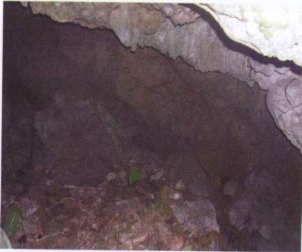
Foto 17. Gua Palalu, di dalamnya penuh dengan runtuhan atap, gelap dan lembab

Gua Palalu terletak pada 3^{\circ}22'53,5'' Lintang Selatan dan 129^{\circ}11'39,7'' Bujur Timur dengan ketinggian 47 meter diatas permukaan airlaut, serta tercantum pada Peta Topografi No. SA 52-15 Series T503 (Bula), berskala 1:250.000.