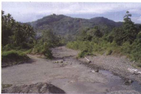
Foto 2. Satuan morfologi bergelombang lemah, di depannya mengalir Sungai Lata

dengan prosentase kemiringan lereng antara 2 - 8%. Satuan morfologi ini menempati 30% dari wilayah penelitian, terletak di bagian utara. Satuan morfologi bergelombang lemah, pada umumnya berupa hutan yang ditumbuhi oleh pohon-pohon besar, dan semak belukar.