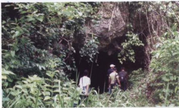
Foto 9. Pintu masuk Gua Tanah Merah tempat dilaksanakan kegiatan ekskavasi

Gua Tanah Merah merupakan gua tebing yang termasuk wilayah Dusun Babalangu, Desa Tamilaow, Kecamatan Amahai, Kabupaten Maluku Tengah. Secara geografis, terletak pada 3°23'01,2" Lintang Selatan dan 129°11'46,9 Bujur Timur, dengan ketinggian 34 meter di atas permukaan airlaut, serta tercantum pada Peta Topografi No. SA 52-15 Series T503 (Bula), berskala 1:250.000