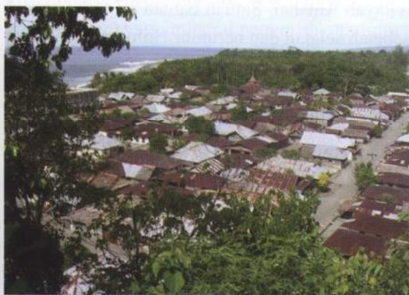
Foto 1. Satuan morfologi dataran yang dimanfaatkan sebagai lokasi pemukiman (Desa Tamilaow)

(1) Satuan Morfologi Dataran, dicirikan dengan bentuk permukaan yang sangat landai dan datar, dengan prosentase kemiringan lereng antara 0 - 2%. Satuan morfologi ini menempati 40% dari wilayah penelitian, terletak di bagian selatan atau dekat pantai selatan yang berhadapan langsung dengan Laut Banda. Satuan morfologi dataran, pada umumnya ditempati oleh penduduk sebagai wilayah pemukiman dan pertanian.