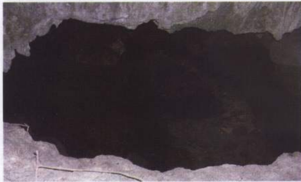
Foto 15. Gua Balembano yang berbentuk ceruk, di dalam gua terdapat mataair abadi

Gua yang berbentuk ceruk ini berarah hadap N0^{\circ}E (utara) dengan lebar mulut gua 6 meter, dari mulut gua ke dinding dalam 4 meter, serta tinggi mulut gua 2 meter. Sirkulasi udara dan intensitas sinar termasuk baik.