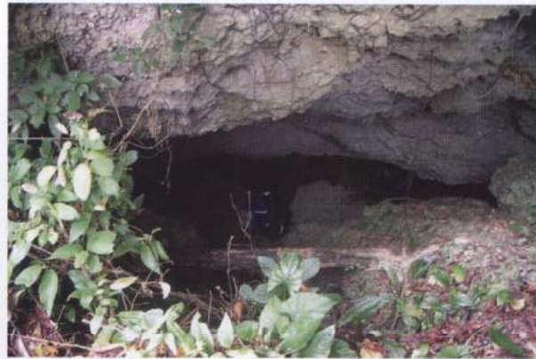
Foto 22. Gua Ikei, di bagian dalamnya terdapat genangan air

ketinggian 38 meter di atas permukaan airlaut, serta tercantum pada Peta Topografi No. SA 52-15 Series T503 (Bula), berskala 1:250.000.