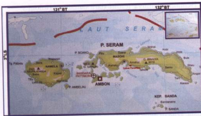
Peta 1. Lokasi Wilayah Amahai, Kab. Maluku Tengah, Prov. Maluku

Maluku Tengah, Provinsi Maluku terletak pada posisi 2.5°-7.5° Lintang Selatan dan 127.25°-132.5° Bujur Timur. Di sebelah utara, dibatasi oleh Laut Seram, sebelah selatan oleh Laut Banda, sebelah barat oleh Laut Buru, dan di sebelah timur oleh Laut Papua. Di bagian tengah, berbatasan dengan Kota Ambon.