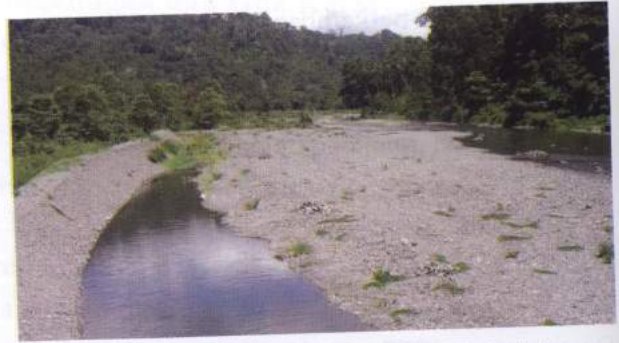
Foto 4. Sungai Lata, salah satu sungai induk yang mengalir di wilayah Amahai, berhulu di di Gunung Damar dan bermuara di Laut Banda

Keseluruhan sungai-sungai di wilayah Amahai dan sekitarnya (sungai besar dan sungai kecil), memberikan kenampakan pola pengeringan dendritik. Pola dendritik bentuknya seperti urat-urat daun, pola ini khas pada daerah dataran dengan lithologi yang homogen (Lobeck 1939; Thornbury 1964). Berdasarkan klasifikasi kuantitas air, maka sebagian dari sungai-sungai tersebut, termasuk pada sungai periodik/permanen. Sungai periodik atau sungai permanen adalah sungai yang volume airnya besar pada musim hujan, tetapi pada musim kemarau volumenya kecil (Lobeck 1939; Thornbury 1964).