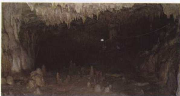
Foto 14. Untuk menikmati keindahan Gua Akohi, Pemda setempat telah memasang penerangan (listrik)