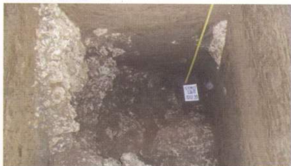
Foto 11. Kotak TP-2 terletak di sebelah utara kotak TP-1 dengan jarak sekitar 3 meter, kedalaman kotak tersebut adalah 203 cm

dilakukan hingga mencapai kedalaman 203 cm, tanpa menemukan satupun artefak yang dapat memberikan indikasi terhadap pola hunian gua (Jatmiko dkk. 2007).