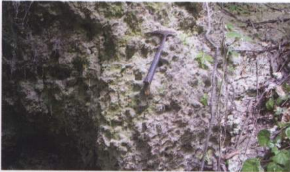
Foto 6. Batugamping terumbu, salah satu batuan penyusun wilayah Amahai

Berdasarkan klasifikasi petrologi, batugamping terumbu ( reef-limestone ) termasuk dalam jenis batuan sedimen organik, segar berwarna putih kekuningan dan lapuk berwarna putih kecoklatan. Tekstur termasuk dalam kelompok non klastik dengan struktur bioherm ( external structure ). Komposisi mineralnya adalah kalsium karbonat ( \text{CaCO}_3 ).