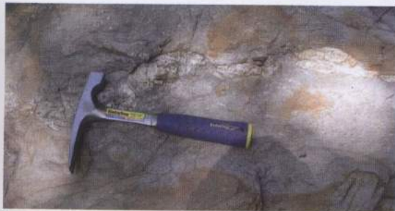
Foto 7. Batuan Sekis ( schist ), salah satu batuan penyusun wilayah Amahai

Sekis ( schist ) termasuk dalam jenis batuan metamorf yang berwarna abu-abu terang, dan lapuk berwarna abu-abu gelap. Bertekstur kristaloblastik-lepidoblastik ( crystalloblastic – lepidoblastic ) yaitu mineral penyusun, umumnya berbentuk pipih. Strukturnya termasuk pada struktur schistose , yaitu kenampakan dari foliasi dimana bentuk penjajaran mineral pipih relatif jauh lebih banyak daripada mineral butiran. Komposisi mineralnya adalah kuarsa, mika, khlorit, dan serpentinit. Batuan sekis merupakan hasil metamorfis regional ( mesozone-katazone ).