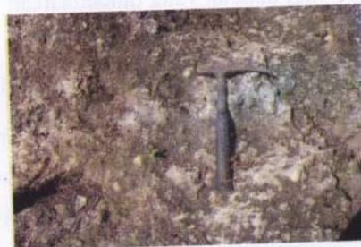
Foto 5. Batugamping, salah satu batuan penyusun wilayah Amahai

Berdasarkan klasifikasi petrologi, batugamping ( limestone ) termasuk dalam jenis batuan sedimen karbonat, segar berwarna putih kekuningan dan lapuk berwarna putih kecoklatan. Tekstur termasuk dalam kelompok non klastik dengan struktur tidak berlapis ( non stratified ), terdiri atas kalsium karbonat ( \text{CaCO}_3 ).