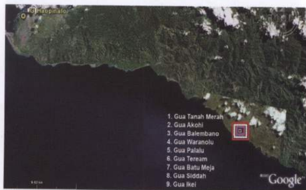
Peta 2. Lokasi gua-gua di wilayah Amahai, Gua Haopinalo dengan gua-gua yang terletak di Desa Tamilaow berjarak \pm 30 km (garis lurus)

Penelitian di wilayah Amahai, difokuskan di Gua Tanah Merah dan sekitarnya. Identifikasi kondisi gua-gua sebagai berikut: