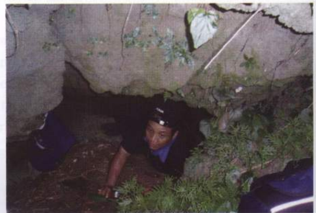
Foto 16. Gua Waranolu, untuk masuk ke dalam harus dengan cara merangkak

Gua Waranolu terletak pada 3^{\circ}23'05,1'' Lintang Selatan dan 129^{\circ}11'50,2'' Bujur Timur dengan ketinggian 19 meter di atas permukaan airlaut, serta tercantum pada Peta Topografi No. SA 52-15 Series T503 (Bula), berskala 1:250.000.