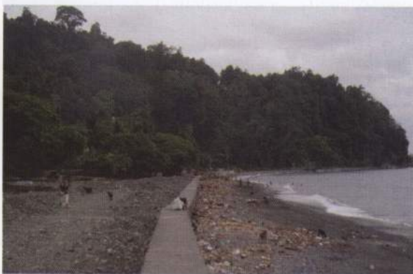
Foto 3. Satuan morfologi Karst yang berhadapan langsung dengan Laut Banda

(3) Satuan Morfologi Bergelombang Karst, menempati 30% dari wilayah penelitian, terletak di bagian tengah, dan pada beberapa tempat di bagian selatan dan utara. Satuan morfologi bergelombang karst, pada umumnya berupa hutan yang ditumbuhi oleh pohon-pohon besar dan semak belukar. Satuan morfologi karst tersusun oleh batu gamping, dengan kenampakan khas seperti bentuk bukit bulat, lereng tegak, dolena, pipa kras, stalaktit dan stalagmit, travertin, sungai bawah tanah, voclus , ponore , gua-gua sisi lereng dan gua-gua kaki bukit ( clift foot cave ).