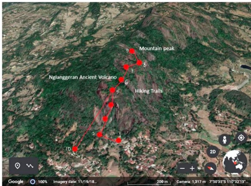
Gambar 1. Lokasi pengoleksian sampel kupu-kupu di Gunung Api Purba Nglanggeran (Sumber: Google Earth , 31/10/2021). ( The location of the butterfly sampling collection at Nglanggeran Ancient Volcano ) (Source: Google Earth , 31/10/2021).

Lokasi penelitian bertempat di kawasan Gunung Api Purba Nglanggeran, Kabupaten Gunungkidul, Yogyakarta. Gunung ini memiliki ketinggian antara 200–700 meter di atas permukaan laut (mdpl) dengan luas area 48 ha dan kemiringan lerengnya curam terjal > 45% (Ferra et al. , 2013; Saputra, 2017). Lokasi pengambilan data berada di sepanjang jalur pendakian Gunung Api Purba Nglanggeran, mulai dari gerbang masuk jalur pendakian (7°50'33"S 110°32'16"E) sampai puncak Gunung Api Purba Nglanggeran (7°50'28"S 110°32'35"E) dengan ketinggian 430–621 mdpl.