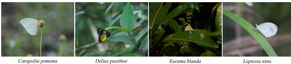
Gambar 2. Jenis-jenis kupu-kupu yang ditemukan di Gunung Api Purba Nglanggeran ( Butterflies that were found at Nglanggeran Ancient Volcano ). A. Papilionidae, B. Nymphalidae, C. Pieridae, D. Lycaenidae.