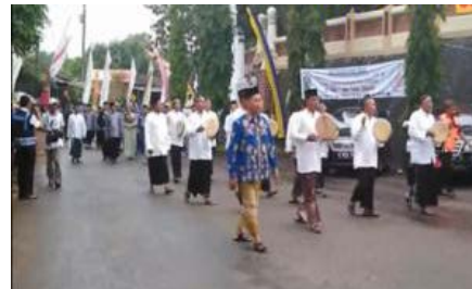
Gambar 6. Grup Rebana Pada Parade Budaya

saat Ratu Kalinyamat dinobatkan menjadi penguasa Jepara. Pada acara ini terdapat beberapa kegiatan, dimulai dengan wilujengan negari, yaitu prosesi ruwatan sebagai simbol pembersihan diri bangsa dan negara (Jepara). Acara ini