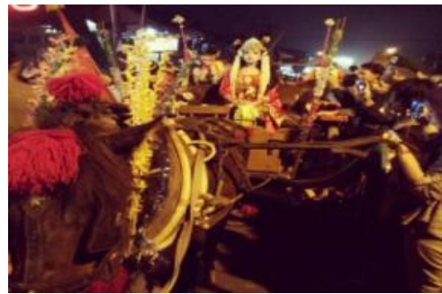
Gambar 12. Ratu Kalinyamat Dalam Pesta Baratan

Tradisi menyalakan lampu uplik, menaruh obor, atau menaruh impes (lampion) di depan rumah pada malam nisfu sya'ban 15 sudah menjadi kebiasaan masyarakat Jepara. Bahkan bagi anak-anak, pada malam tersebut, mereka berkeliling kampung sambil membawa obor atau lampion. Pada malam itu, setelah sholat maghrib, mereka juga membawa jadah ke mushola atau masjid untuk didoakan dan dimakan bersama-sama.