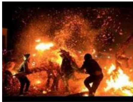
Gambar 10. Perang Obor

Perang Obor diselenggarakan di Desa Tegalsambi setiap setiap malam Selasa Pon bulan Dzulhijah. Pada mulanya upacara ini dilakukan karena untuk mengusir pageblug 13 dan puso 14 yang menimpa mereka. Menurut masyarakat