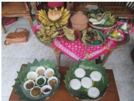
Gambar 17. Berbagai Jenis Kuliner Sesaji