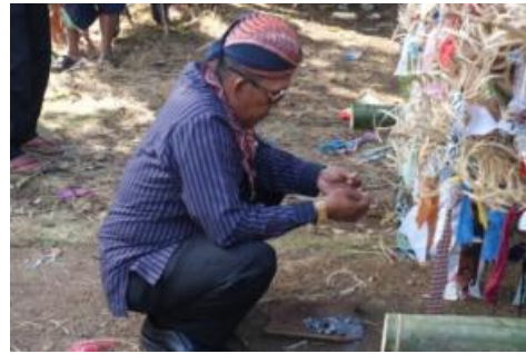
Gambar 14. Kamituwa Berdoa di Depan Jembul dan Kemenyan Bakar