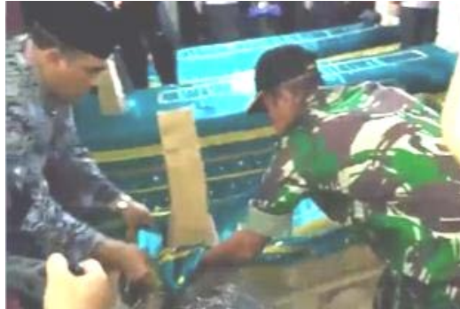
Gambar 7. Bupati Jepara Mengganti Luwur

diselenggarakan di alun-alun Jepara pada tanggal 8 April malam. Keesokan harinya dilakukan kirab budaya dimulai dari alun-alun Jepara menuju Mantingan. Puncak acara dilakukan di Mantingan dengan mengganti luwur 8 makam Sultan Hadiri dan Ratu Kalinyamat yang dilakukan oleh Bupati Jepara beserta jajarannya.