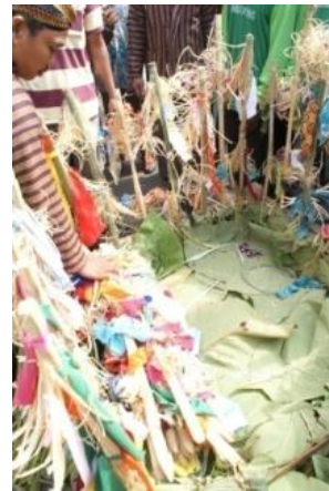
Gambar 3. Jembul Wadon