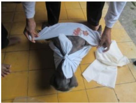
Gambar 15. Kepala Kerbau Untuk Sesaji

Pada upacara sedekah laut di Ujung Batu, rupanya makhluk halus yang menguasai laut, besar pengaruhnya terhadap kehidupan nelayan di sekitarnya. Sehingga diperlukan adanya sesaji khusus yang hanya bisa dibuat dan didoakan oleh keturunan mantan petinggi pada masa lalu. Sesuai dengan namanya, sedekah laut, maka sesaji yang telah dibuat itu disedekahkan atau dilarung ke laut setelah melalui beberapa prosesi yang cukup panjang. Antara lain, sesaji dibuat sehari sebelum hari pelaksanaan upacara, didahului adanya penyembelihan kerbau. Kepala kerbau dan sesaji inilah yang akan dilarung di laut. Pada sore hari sebelum pelarungan, dilakukan selamatan terlebih dahulu di makam-makam sesepuh desa, tokoh cikal-bakal desa. Pada malam harinya diselenggarakan wayang semalam suntuk di Tempat Pelelangan Ikan Ujungbatu (wawancara dengan Drs. Agus Tri Raharjo, M.Hum. dan Drs. Yunismar, M.Hum. pada tanggal 12 Juli 2016).