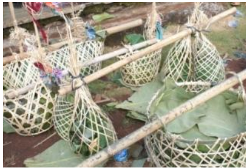
Gambar 4. Bulu Bekti untuk Petinggi Tulakan

Upacara tradisi ini berkaitan erat dengan sejarah Desa Tulakan, yang memiliki lima dusun, yaitu Krajan, Winong, Ngemplak, Drojo, dan Pejing. Pada upacara tradisi ini dibuat empat 7 jembul lanang dan empat jembul wadon