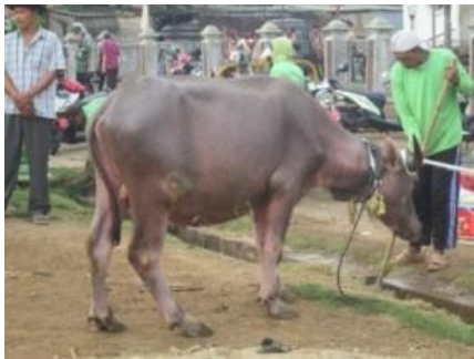
Gambar 8. Kerbau Berkalung Ketupat dan Lepet

Upacara ini disebut sedekah laut, karena latar belakang beberapa masyarakat Jepara sebagai nelayan. Upacara ini diselenggarakan sebagai ungkapan rasa syukur mereka atas rizki yang telah diberikan oleh dhanyang laut