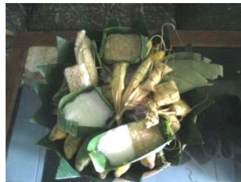
Gambar 18. Jajan Pasar