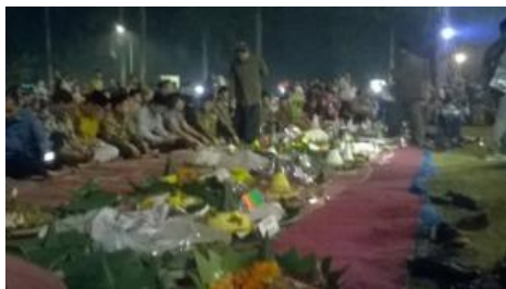
Gambar 5. Wilujengan Negari Jepara

Upacara ini diselenggarakan setiap tanggal 10 April yang diyakini sebagai