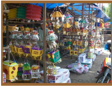
Gambar 11. Berbagai Jenis Lampion yang Dijual