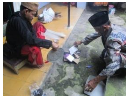
Gambar 16. Menyiapkan Dupa, Sarana Untuk Mendoakan Kepala Kerbau