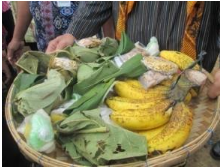
Gambar 13. Jajan Pasar Untuk Sesaji

yang masih angker dan gawat, diperlukan usaha untuk dapat menakhlukkan dhanyang penunggu desa. Upaya itu dilakukan oleh Kyai Agung Barata bersama