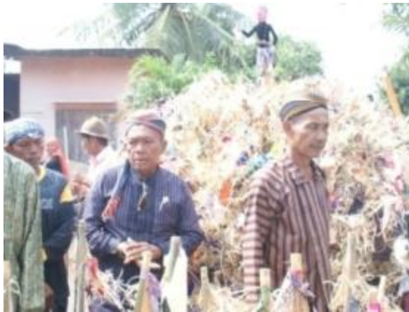
Gambar 2. Jembul Lanang dan Kamituwa