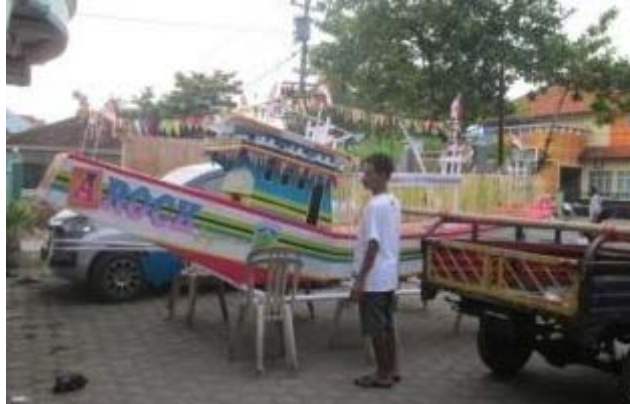
Gambar 19. Miniatur Perahu Untuk Wadah Sesaji

Kuliner untuk sesaji yang dilarung meliputi ayam dhekem, ayam bacem, urap dari tujuh jenis sayuran, bucu 20 putih, bucu kuning, jajan pasar, degan ijo, gula jawa, gulapisir, kopi, teh, serta ketupat dan lepet. Ada pula lima nasi nukukan, serta sayur kunci godhong kelor, cengkaruk (nasi aking digoreng) anyep,