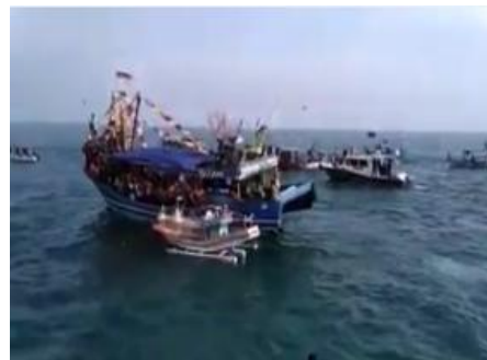
Gambar 9. Pelarungan Sesaji di Laut

kepada para nelayan selama setahun yang lalu 9 . Harapan mereka, pada tahun yang akan datang rizki itu tetap melimpah kepada mereka. Upacara ini diselenggarakan setiap tanggal 7 Syawal, sehingga upacara tradisi ini oleh masyarakat Jepara sering disebut pula dengan Syawalan 10 , badakupat 11 , dan lomban 12 (Indrahti, dkk., 2018, hlm. 25-26). Sebelum upacara tradisi ini