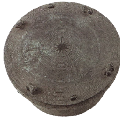
Gambar 1. Bidang Pukul Nekara Dong Son Tipe Heger I Mahakarya Indah dengan Dekorasi Raya. Nampak Motif Bintang dan Ornamen Empat Patung Katak yang menjadi ciri khas

dari Berlin. Segenap informasi Rumphius tentang 'benda perunggu dari langit' ini ditulis dalam bukunya Ambonische Rariteitkamer yang terbit tahun 1705 (Kempers, 1988). Karya yang sekaligus menjadi sumber Eropa paling awal yang menyebutkan mengenai genderang perunggu Asia yang kini dikenal sebagai nekara.