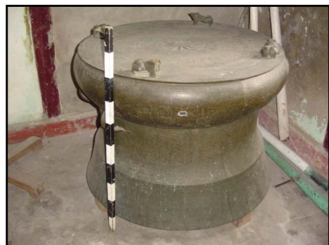
Gambar 3. Nekara Dong Son Heger I di Desa Kataloka Gorom Seram Timur di Tahun 2006

adalah karena persebarannya yang sedemikian luas di seluruh Asia Tenggara. Membentang dari Vietnam ke Burma, Thailand, Laos hingga Kepulauan Asia Tenggara. Termasuk dalam wilayah yang disebut terakhir adalah beberapa pulau utama di Indonesia seperti Jawa, Sumatera, Kalimantan, Sulawesi, Kepulauan Nusa Tenggara, Kepulauan Maluku hingga wilayah Kepala Burung di Papua. Diperkirakan bahwa nekara pertama kali mencapai wilayah bagian barat Indonesia pada sekitar seratus tahun setelah masehi, dan meluas penyebarannya hingga mencapai pulau-pulau di belahan timur Nusantara antara dua ratus hingga tiga ratus tahun setelah masehi. Dua abad kemudian dalam pandangan Bellwood, perkembangan baru muncul di Jawa dan Bali ketika nekara perunggu mulai diciptakan secara lokal.