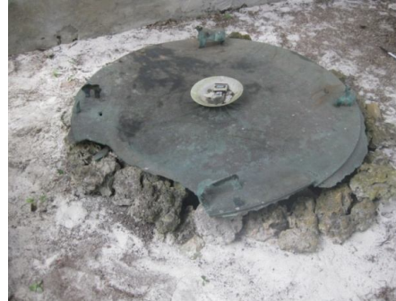
Gambar 4. Kondisi terakhir Nekara Heger I di Pulau Dullah Kei Kecil tahun 2013. Sebelah kiri: bagian pinggang hingga kaki nekara yang terbelah di Desa Vaan. Sebelah Kanan: Bagian bahu hingga Bidang Pukul di Desa Madwair.