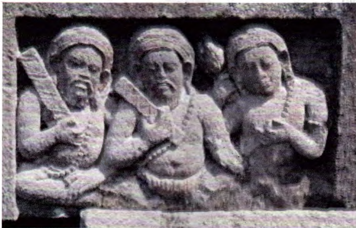
Gambaran para Brahmana pada Candi Morangan, kira-kira dari Abad VIII-IX M

menjelaskan proses Indianisasi di Kepulauan Nusantara, keempat teori tersebut antara lain adalah (Soepomo, 1995:291-292); teori Brahmana , teori Ksatriya , teori Vaisya dan teori arus balik yang diperkenalkan oleh FDK. Bosch (lihat juga: Bosch, 1961).