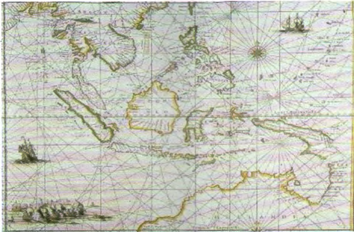
Kepulauan Oost Indien pada tahun 1700, menurut gambaran pelaut Belanda

Kebudayaan India (Hindu-Budha), Kebudayaan Islam, dan Kebudayaan Eropa.