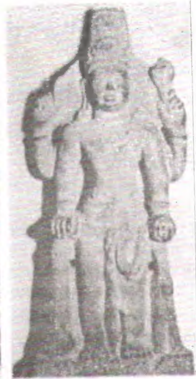
Kiri: Arca Wisnu Tersana (Repro: Satari, 1977) dan Kanan: Arca Wisnu Cibuya (Repro: Manguin, 2002)

(Sekte Ganapatya ). Ganesha adalah dewa ilmu pengetahuan, dewa kemakmuran, dewa penyelamat dan dewa penghancur segala macam rintangan. Sebagai dewa penghancur rintangan, Dewa Ganesha dipuja dalam setiap permulaan perjalanan, membangun rumah, dan menulis buku. Pada umumnya penempatan dewa ini dilakukan di daerah yang dianggap berbahaya seperti di pinggir jurang, persimpangan jalan dan pinggir sungai. Secara arkeologis temuan Arca Ganesha di Kabupaten Batang terdapat di Kelurahan Deles, Kelurahan Jlamprang, Desa Ngrecu, Kelurahan Candirejo, Kelurahan Rejosari, dan Desa Silurah. Arca Ganesha yang ditemukan di Kelurahan Deles, Kecamatan Bawang terletak pada Candi Silembu di pinggir jurang Kali Putih yang berhulu di Gunung Prahur, Dieng. Dapat diperkirakan bahwa pada masa lampau perjalanan dari pantai utara Jawa Tengah menuju ke dataran tinggi Dieng cukup berat dan berbahaya.