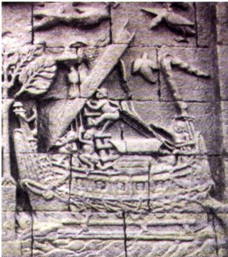
Relief dari Candi Borobudur yang menggambarkan pelayaran-perdagangan pada masa lampau

Teori Vaisya menyatakan bahwa Kebudayaan India yang berkembang di Kepulauan Nusantara di bawa oleh kaum pedagang yang aktif melakukan kontak dengan masyarakat lokal. Teori ini didukung oleh data arkeologi maupun sejarah yang mengindikasikan pesatnya arus pelayaran-perdagangan antara Kawasan India-Nusantara-Cina pada tarikh permulaan abad Masehi. Pada masa tersebut terdapat dua jalur utama pelayaran-perdagangan, yaitu; jalur sutra yang melewati daratan Asia Tengah dan jalur laut yang melewati perairan Asia Tenggara Kepulauan.