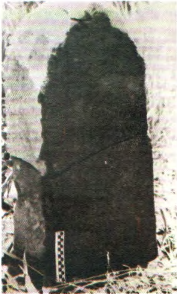
Prasasti Balekambang pada Petirthaan Balekambang, di Dusun Bendosari, Desa Kebondalem, Kecamatan Gringsing.

pada beberapa suku bangsa di Nusantara. (lihat: Bosch, 1961: 153-170). Pentingnya penguasaan dan pengelolaan air bagi kepentingan praktis maupun religius oleh para penguasa politik, nampaknya sudah menjadi kecenderungan sejak awal munculnya peradaban India di tanah Jawa. Seperti misalnya Prasasti Tugu dari abad \pm V Masehi di Tanjung Priok, mengisahkan Purnawarman seorang raja Tarumanegara, pemuja Dewa Wisnu yang pada tahun ke 22 masa pemerintahannya memerintahkan untuk membangun terusan di Sungai Candrabâgâ menuju ke laut setelah melewati istana sang raja, dan sebuah terusan lainnya bernama Gomati dengan panjang 6122 dhanus ( \pm 10 km) selama 21 hari sehingga melewati pertapaan nenek dari sang raja. Peresmian saluran tersebut dilakukan oleh para Brahmana yang dihadiahi 1000 ekor sapi (Poerbatjaraka, tanpa tahun :5). Kemungkinan besar,