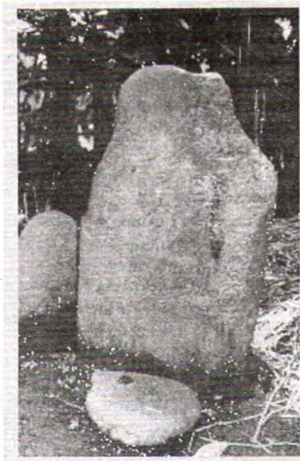
Prasasti Sajamerta dari Desa Sajamerta, Kecamatan Reban.

Deles, Kecamatan Bawang. Istilah Selaraja kemungkinan berasal dari kata Sela ( Saila berarti gunung) dan Raja (pemimpin) sama dengan Indra (pemimpin para dewa), jadi istilah Selareja dapat disamakan dengan Selendra atau Sailendra . Berdasarkan hasil penelitian sebelumnya dapat diketahui bahwa arca tersebut memiliki ciri ikonografi; sikap duduk bersila ( vajrāsana atau paryankāsana ), sikap tangan kiri dhyānimudra dan sikap tangan kanan menunjuk ke arah atas (semacam mudra kematian) (Nitihaminoto, 1977: 28-29). Berdasarkan ciri ikonografi dan istilah penyebutan arca tersebut dapat diperkirakan bahwa arca tersebut merupakan arca perwujudan dari tokoh Dapūnta Selendra setelah beliau wafat dan diperdewakan oleh rakyatnya.