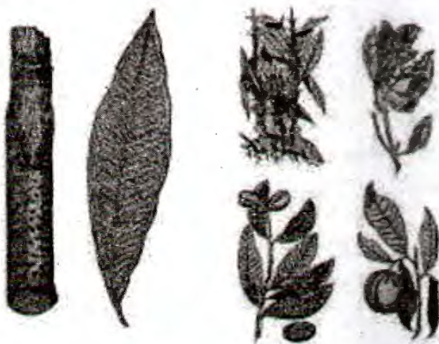
Rempah-rempah, Komoditas Kepulauan Nusantara yang Mahal di Pasaran Barat.