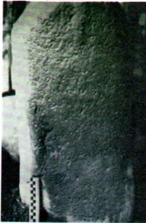
Prasasti Blado, Dukuh Kepokoh, Desa Blado, Kecamatan Blado

Sedangkan daerah kebanyakan ( non sima ) biasanya rakyatnya dikenakan kewajiban drawya haji (pajak), gawai haji atau buat haji (pekerjaan untuk raja) kepada raja. Dengan adanya sima diketahui bahwa terdapat suatu institusi politik dengan perangkat pemerintahannya yang melakukan pengelolaan hasil bumi, pajak dan pemeliharaan bangunan suci. Berdasarkan pada isi Prasasti Blado tersebut maka semakin kuat dugaan bahwa daerah pantai utara Jawa Tengah merupakan awal daerah perkembangan institusi politik yang mendapat pengaruh India. Sebagai perbandingan dengan kawasan Jawa Tengah bagian selatan, data awal kemunculan institusi politik di daerah ini baru terjadi pada tahun 654 Çaka atau 732 Masehi berdasarkan Prasasti Canggal yang baraksara Jawa Kuno dan berbahasa Sansekerta, dari Candi Gunung Wukir di Kabupaten Magelang. Prasasti tersebut berisi tentang pendirian sebuah Lingga di Bukit Stirangga oleh seorang tokoh bernama