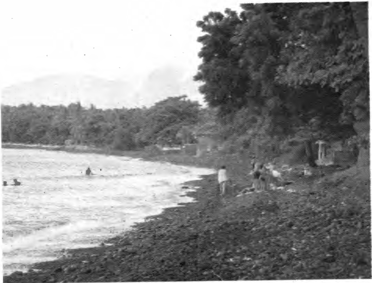
Keindahan Pantai Tulamben yang Menarik Wisatawan Mancanegara