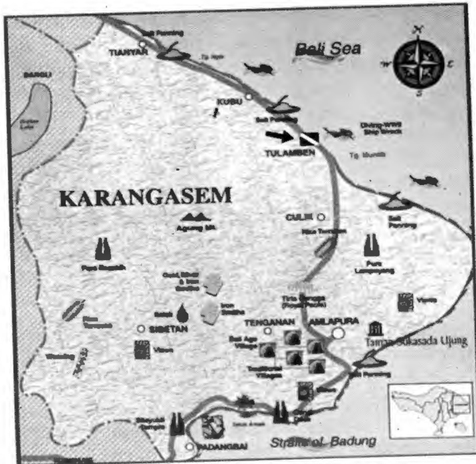
Situs Kapal Karam "USS Liberty" Tulamben dan Potensi Pariwisata Lainnya di Kabupaten Karangasem

Di balik keganasan alam daerah timur Bali tersebut, ternyata disana juga menyimpan "harta karun" yang terpendam di dasar laut. Pada tahun 1942 saat Perang Dunia II berlangsung, terjadi musibah pada sebuah kapal dagang uap yang dipersenjatai dengan dua meriam milik Amerika Serikat yaitu "USS Liberty". Pada tanggal 11 Januari 1942, kapal tersebut sedang berlayar di sekitar 15 kilometer di sebelah barat daya perairan Selat Lombok dan membawa muatan kayu mentah dan komponen rel kereta api. Namun tiba-tiba disergap oleh kapal selam angkatan laut Jepang dan terpedo menghantam bagian lambung kapal tersebut. Kapal "USS Liberty" mengalami kerusakan mesin dan kemudian berusaha ditarik oleh "US Destroyer" menuju Pulau Bali. Namun, karena terlalu banyak kemasukan air, kapal tersebut tidak dapat berlabuh dan kemudaian karam tidak jauh (sekitar 200 meter) dari tepi pantai Pantai Tulamben sedangkan awak kapalnya berhasil dievakuasi. Setelah Belanda kalah dan menyingkir ke