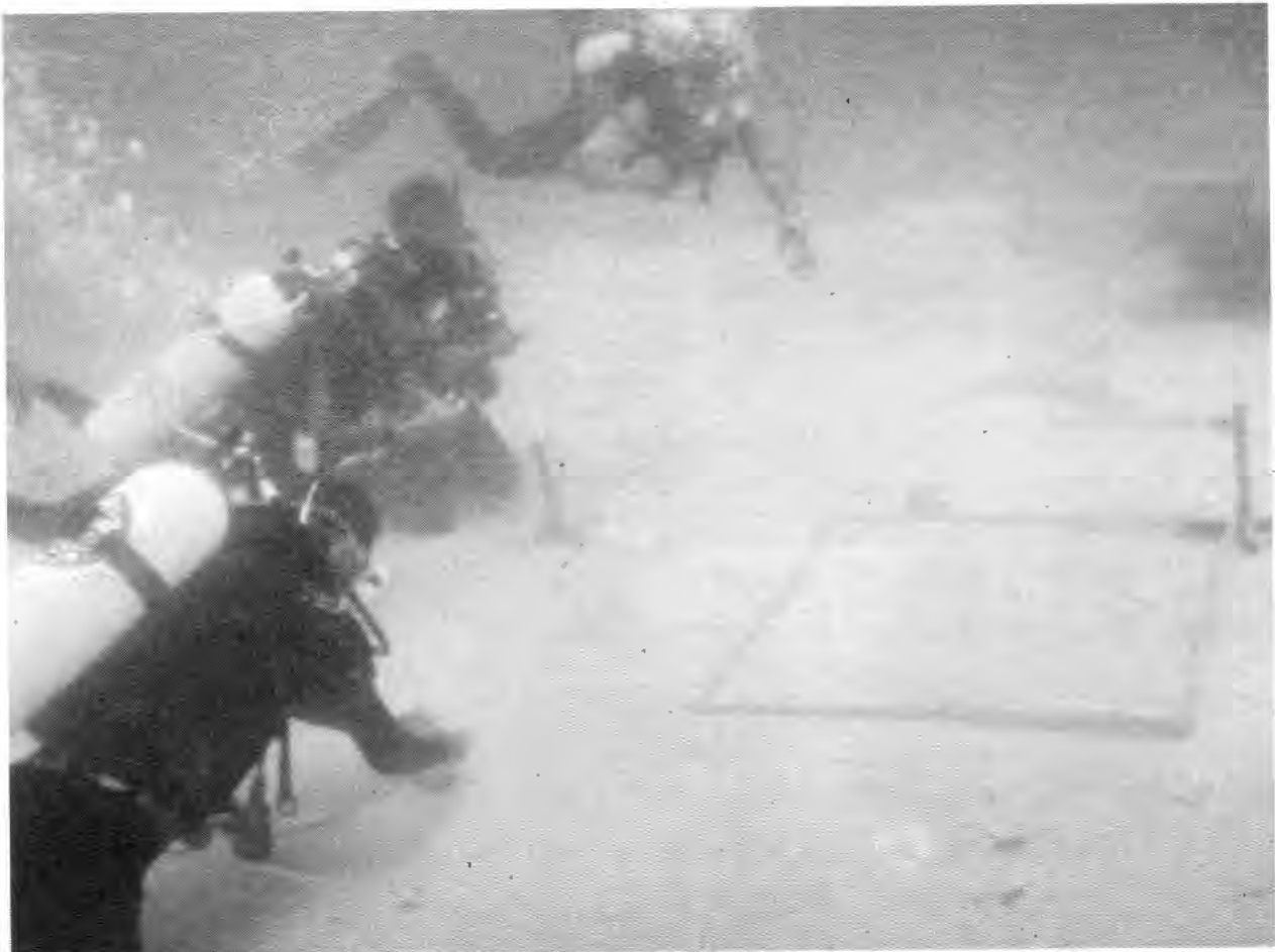
Pelatihan Ekskavasi Arkeologi Bawah Air Tahun 2007 di Perairan Karimunjawa, Jepara

Hasilnya kini telah dimiliki beberapa arkeolog yang cukup mampu diandalkan dalam kegiatan penelitian maupun pelestarian sumberdaya arkeologi bawah air. Namun hal ini hanyalah salah satu upaya untuk melihat kembali bahwa sumberdaya arkeologi bawah air ternyata sangat portensial untuk dimanfaatkan dan dikembangkan. Salah satu konsep konservasi yang berkembang pada masa kini adalah pelestarian, pemanfaatan, dan lagi. 5.