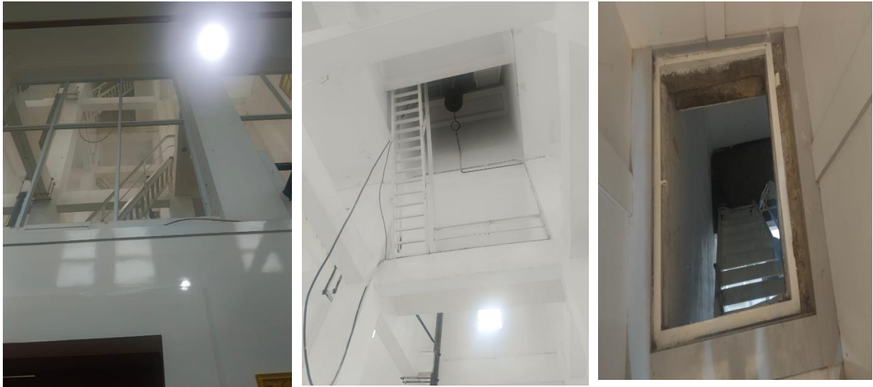
Gambar 5. Tangga-Tangga Naik ke Lantai Atas di Kantor Walikota Palembang saat ini

Bagian bak air utama memiliki empat daun jendela besi di atap datar, sehingga orang dapat menikmati pemandangan kota yang indah. Sirine elektrik otomatis terdapat di atas atap datar balai kota untuk menunjukkan waktu dan keadaan bahaya di kota. Sirine secara otomatis akan berbunyi dengan keras dan terdengar di seluruh kota pada jam 12.00 siang. Ada dua tombol kontrol sirine di balai kota antara lain: satu, di ruang listrik, dan dua, di ruang telepon, juga dikenal sebagai telepon mandoer , yang terletak di lantai dasar dekat teras pintu masuk utama. Selain sirine yang terletak di atas atap datar menara, ada empat tiang bendera besi di empat sudutnya yang dialirkan ke bak air utama untuk penangkal petir. Gedung Balai Kota Palembang setelah selesai memiliki banyak fasad yang menarik, termasuk dinding dan seluruh ruang kantor yang dicat dengan warna putih semen krem. Semua ruang, kecuali ruang rapat komisi khusus dan ruang wali kota ( burgemeester ), dihiasi dengan wallpaper modern dengan gaya atmosferik . Dinding keramik di sebelah kiri meja kerja wali kota memiliki lukisan Peta Kota Palembang yang indah.