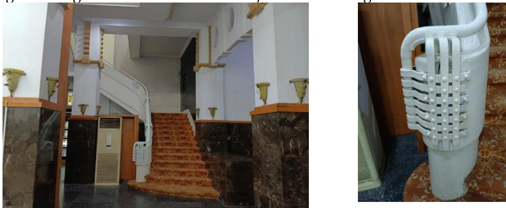
Gambar 2. Tangga di Balai Kota Palembang (Kantor Wali kota Palembang)

Bentuk bangunan yang dirancang dengan arsitektur modern serta disesuaikan dengan fungsinya, sebagai kantor pemerintah kota dan menara air, sehingga konsep wayfinding Balai Kota Palembang menampakkan visual bangunan, area, dan ruang yang sesuai dengan fungsinya masing-masing. Dengan menggambarkan karakteristik yang ada di setiap ruang di Balai Kota Palembang, bangunan gedung balai kota memiliki kemampuan untuk membuat peta pikiran yang luar biasa bagi para pengunjung (Sures, 1966). Pengunjung dapat merasakan fungsi pelayanan di ruang pemerintahan Balai Kota Palembang, terutama di lantai dasar dan lantai satu. Ruangan lantai dasar dibangun lebih lebar dan luas. Lantai 2 dan 3 memiliki fungsi sebagai instalasi saluran air yang lebih utama, sehingga ruangan tersebut lebih memanjang dan tinggi dengan tangga besi. Lantai dasar sebagai pusat pelayanan pemerintah kota, ruangnya dihiasi dengan ornamentasi, sedangkan ruang di lantai 2 dan 3 lebih ditujukan untuk fungsi industri.