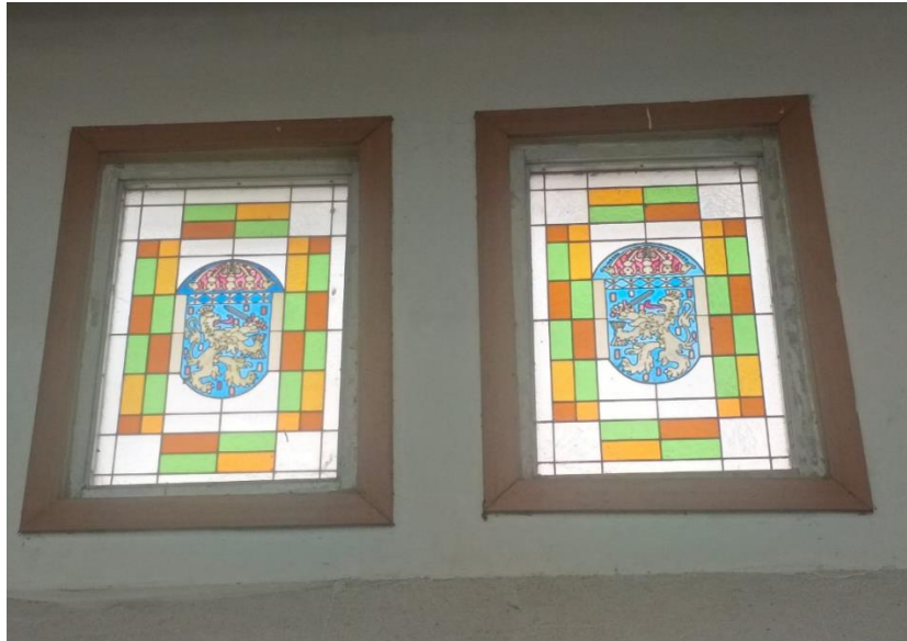
Gambar 6. Kaca patri jendela atas bergambarkan logo masa kolonial Kota Palembang

Akibat modernisasi kota dan cara memperoleh kendaraan sudah mudah, hampir semua kapala dinas dan pegawai kota saat itu sudah memiliki mobil. Menariknya, Wali Kota Palembang saat itu, Lissa van Nessel telah membuat aturan bahwa semua pejabat, termasuk dirinya dan semua kepala dinas dan pegawai di Balai Kota Palembang harus bekerja dengan menaiki sepeda atau berjalan kaki, sehingga terdapat ruang parkir di dekat ruang Dinas Pekerjaan Kota ( Gemeentewarken ). Ruang parkir ini terdiri dari shelter beton yang dapat menampung 27 sepeda, dan rak sepeda dipasang di tempatnya. Untuk keperluan dinas pejabat Kota Palembang yang diparkir selama jam kantor saja, garasi terbuka semi permanen di belakang ruang Dinas Pekerjaan Kota dapat menampung hanya tiga mobil.