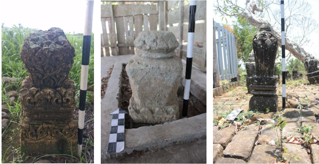
Gambar 4. Nisan Tipe Lombok-Bugis di Situs Makam Kuna Anggareksa (Kiri), Situs Makam Kuna Belungis (Tengah), dan Situs Makam Kuna Sanggeng (Kanan)

Nisan Tipe Lombok-Bugis memiliki bentuk kaki persegi dengan variasi bentuk badan, seperti phallus , gada dan segitiga terbalik. Sebagian besar bagian kaki nisan memiliki ragam hias, namun ditemukan juga yang polos tanpa ragam hias. Bagian kepala nisan juga bervariasi antara betuk kuncup bunga (variasinya dengan ragam hias kelopak bunga yang mekar) hingga susunan pelipit yang semakin atas semakin mengecil ( Gambar 4 ). Serupa dengan Nisan Tipe Lombok-Tralaya, bagian kaki nisan berfungsi sebagai bates ujan atau batas penanaman nisan yang biasanya dihiasi motif geometris sebagai wujud local genius masyarakat Sasak ( Magetsari, 2010 ). Pada bagian batas antara kaki dan badan nisan, terdapat bentuk menyerupai antefiks pada bangunan candi Hindu-Buddha era Jawa kuno. Ornamen antefiks tersebut jika diperhatikan dengan seksama merupakan stilisasi kala-makara yang diwujudkan dalam motif kelopak bunga, suluran, dan selur gelung. Tingkat kerapatan ragam hias pada badan nisan sangat bergantung pada bentuk dasarnya ( Gambar 5 ). Nisan yang memiliki badan bentuk segitiga terbalik biasanya memiliki ragam hias yang sangat raya, terutama pada makam bangsawan kerajaan. Sebaliknya, nisan berbentuk phallus atau gada cenderung lebih sederhana, hanya menampilkan garis-garis geometris yang memanjang dari atas hingga bawah badan nisan. Ragam hias yang biasanya digunakan pada badan nisan, seperti suluran, kelopak bunga, dan dedaunan.