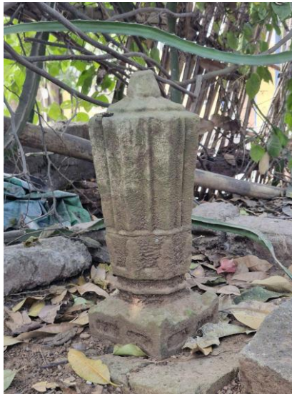
Gambar 9. Nisan Aceh Tipe K di Situs Makam Kuna Raja Langko tanpa skala

dan badan nisan. Pada badan bagian bawah, terdapat ragam hias “Teratai” berupa figurasi berbentuk hati, satu hati utuh di bagian tengah dan dua hati separuh di bagian sisi kiri serta kanan (Yatim, 1988). Area atas badan nisan terdiri dari dua komponen utama, yaitu garis vertikal di kedua sisi yang disebut “tangga” dan “panel teks”. Pada temuan ini, panel teks menyerupai jendela berpanel dua dengan ujung meruncing, namun tidak ditemukan epitaf di dalamnya. Bagian bahu nisan memanjang ke samping dan melengkung ke atas dengan hiasan motif mawar bulat yang dikelilingi pola jaring laba-laba. Struktur ini berlanjut hingga ke bagian kepala yang berbentuk bulat, yang mana bagian kepala secara internal dibagi menjadi panel kalimah dan ragam hias jaring laba-laba (Yatim, 1988).