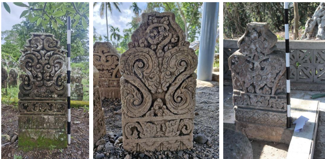
Gambar 7. Nisan Tipe Lombok perempuan di Situs Makam Kuna Karang Dalem (Kiri), Situs Makam Kuna Beleq Bonjeruk (Tengah) tanpa skala, dan Situs Makam Kuna Batu Mulut (Kanan)

Bentuk kepala Nisan Tipe Lombok laki-laki sangat bergantung pada morfologi badannya ( Gambar 6 ). Jika badan nisan berbentuk segitiga terbalik, maka makuta -nya cenderung berbentuk segitiga dengan ujung datar atau pipih. Sebaliknya, badan nisan bertipe phallus umumnya dipadukan dengan makuta berbentuk kuncup Bunga Teratai ( padma ). Pada nisan berkepala segitiga, bagian batas antara badan dan kepala nisan biasanya terdapat ragam hias dedaunan, suluran, dan sulur gelung yang diikuti susunan pelipit sebelum mencapai puncak kepala nisan yang umumnya memiliki ragam hias (suluran dan dedaunan) maupun polos. Sementara itu, pada nisan berkepala kuncup bunga padma , transisi antara badan dan kepala lebih sederhana tanpa ragam hias tambahan selain pelipit penyangga. Kepala nisan yang berbentuk kuncup bunga padma biasanya memiliki ragam hias kelopak Bunga Teratai kuncup dengan detail dedaunan di bagian dasarnya. Secara gaya, bentuk badan Nisan Tipe Lombok mengadopsi pengaruh dari Nisan Tipe Lombok-Bugis, sedangkan ragam hias tumpal-nya merupakan pengaruh dari Nisan Tipe Lombok-Tralaya.