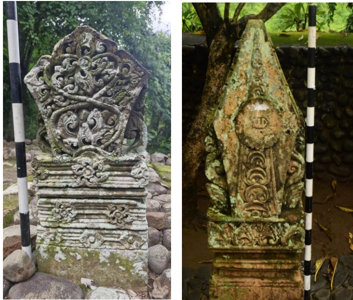
Gambar 1. Nisan Tipe Lombok-Tralaya laki-laki di Situs Makam Kuna Kenaot (Kiri) dan Situs Makam Kuna Raja-Raja Selaparang (Kanan)

Nisan Tipe Lombok-Tralaya memiliki bentuk yang pipih dengan dua variasi sudut, yaitu membulat dan lancip, serta bagian kepala berbentuk runcing untuk laki-laki ( Gambar 1 ) atau datar untuk perempuan ( Gambar 2 ). Pada bagian kaki nisan, terdapat unsur penting yang menjadi tempat batas penanaman nisan atau bates ujan dalam bahasa Sasak. Biasanya, bates ujan pada nisan berbentuk ragam hias geometris. Sebagian besar badan nisan memiliki motif tumpal berisi ragam hias suluran, sulur gelung, ceplik bunga, atau garis geometris dengan proporsi tinggi yang bervariasi – mulai dari seperempat badan hingga mencapai bagian kepala. Sementara itu, nisan yang tidak memiliki motif tumpal biasanya diganti dengan ragam hias suluran, sulur gelung, atau ceplik bunga yang dapat diaplikasikan secara bebas tanpa batas di seluruh bagian badan nisan. Pada nisan milik kelompok bangsawan, ragam hias ini sering kali dibuat lebih padat hingga memenuhi seluruh permukaan badan hingga bagian samping nisan. Dengan demikian, kehadiran motif tumpal berfungsi sebagai elemen pembingkai ragam hias, sedangkan nisan tanpa motif tumpal menggunakan ruang badan secara terbuka untuk mengekspresikan ragam hias yang serupa.