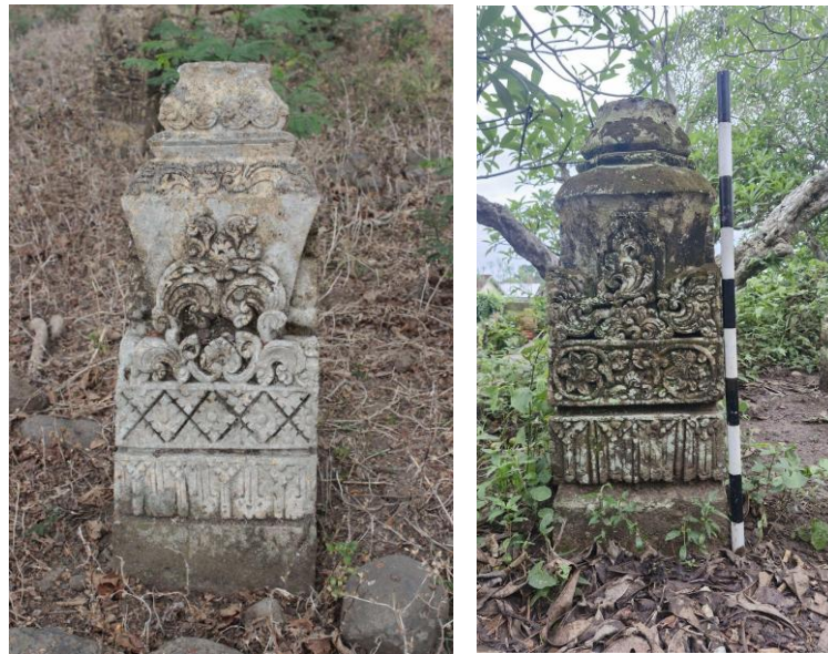
Gambar 6. Nisan Tipe Lombok laki-laki di Situs Makam Kuna Batu Keloq (Kiri) tanpa skala dan Situs Makam Kuna Karang Dalem (Kanan)

Lombok-Tralaya yang telah mengalami modifikasi dan kreasi lokal sehingga memunculkan bentuk yang baru ( Magetsari, 2010 ). Penggunaan Nisan Tipe Lombok diperkirakan bermula sekitar tahun 1700-an berdasarkan pada tradisi lisan masyarakat Sasak yang masih mengingat tahun kematian mendiang. Meskipun, sebagian besar nisan kuna berhias di Pulau Lombok hampir tidak ada yang menuliskan epitaf nama atau angka tahun pada nisannya sampai masuknya masa modern. Secara umum, Nisan Tipe Lombok memiliki morfologi yang sama dengan nisan-nisan tipe sebelumnya, yaitu kaki, badan, dan kepala nisan. Perbedaan mendasar antara nisan laki-laki dan nisan perempuan terletak pada bentuk dasarnya, yang mana nisan laki-laki berbentuk persegi ( Gambar 6 ), sedangkan nisan perempuan berbentuk pipih ( Gambar 7 ).