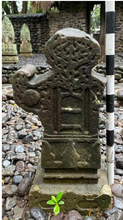
Gambar 8. Nisan Aceh Tipe C di Situs Makam Kuna Raja-Raja Selaparang

Nisan Tipe Aceh memiliki dua bentuk dasar utama, yaitu lempengan tegak dan pilah terpisah. Variasi bentuk pilar batu mencakup balok persegi panjang dengan atau tanpa tambahan di samping, serta bentuk kerucut terbalik di atas alas persegi. Kompleksitas struktur Batu Aceh menjadi tantangan bagi para ahli dalam mengklasifikasikan variasinya secara akurat ( Yatim, 1988 ). Secara umum, morfologinya mengikuti pembagian pada nisan kuna berhias sebelumnya yang terdiri atas kepala, badan, dan kaki (pangkal). Bagian kepala nisan biasanya kaya akan ragam hias, sedangkan badan nisan melengkung ke dalam mengikuti bentuk kepala sehingga membentuk “bahu”. Area bawah atau kaki nisan dilengkapi poros yang tertanam langsung ke tanah atau dasar batu tanpa pelapis. Meskipun terminologi anatomi manusia digunakan untuk menyederhanakan rujukan bentuk, aspek ini memiliki makna simbolis yang kuat. Catatan penting, bagian puncak sering dianggap sebagai representasi kepala almarhum, sehingga kerap dihiasi dengan kain penutup kepala saat ditanam di makam ( Yatim, 1988 ).