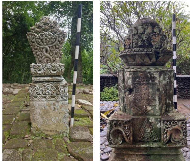
Gambar 5. Nisan Tipe Lombok-Bugis di Situs Makam Kuna Kenaot (Kiri) dan Situs Makam Kuna Raja-Raja Selaparang yang memiliki epitaf (Kanan)

berbentuk phallus atau gada . Pada varian ini, bagian kepala nisan menjadi pusat estetika dengan ragam hias yang raya karena bagian badan nisan umumnya cenderung polos atau minim ragam hias ( Gambar 5 ).