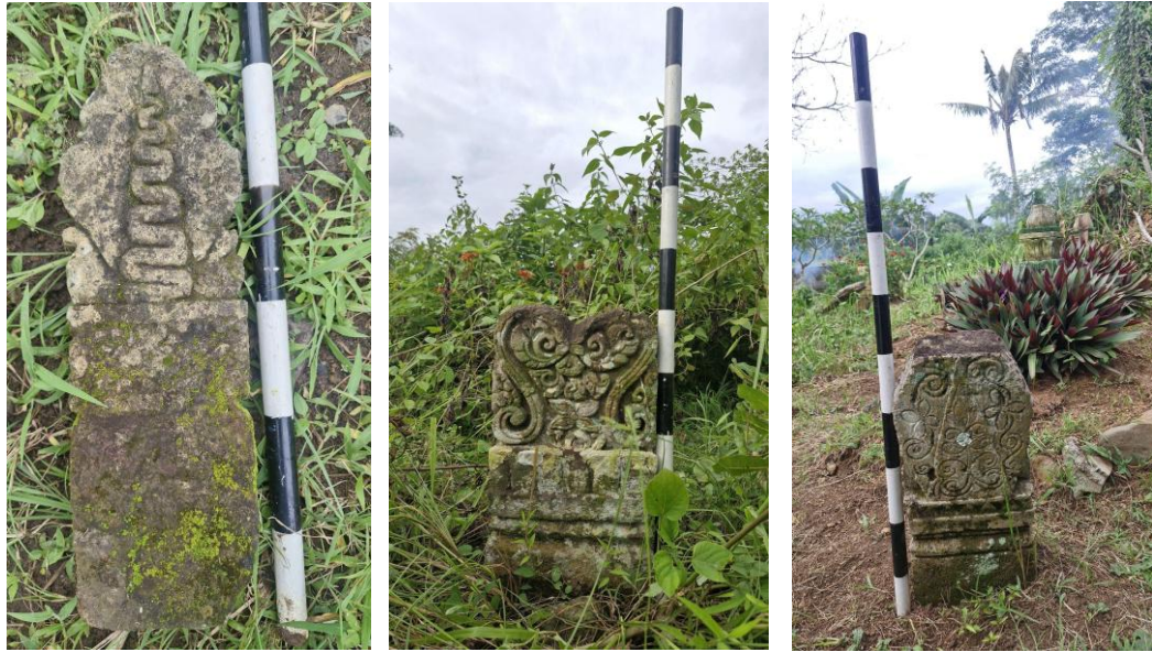
Gambar 2. Nisan Tipe Lombok-Tralaya perempuan di Situs Makam Kuna Karang Dalem (Kiri) dan Situs Makam Kuna Panti (Tengah dan Kanan)

Nisan Tipe Lombok-Tralaya memiliki bagian sayap ( kembang awan ) yang dapat diklasifikasikan menjadi tiga bentuk utama, yaitu simbar (segi tiga), makara yang distilir menggunakan suluran, dan sayap burung ( Gambar 3 ) ( Rachmiati, 1988 ). Selain itu, terdapat variasi pengaruh local genius berupa bulatan ikal yang menyerupai ujung rambut keriting yang membulat ( Magetsari, 2010 ). Bagian kepala nisan merupakan elemen krusial untuk mengidentifikasi jenis kelamin dari orang yang dimakamkan. Nisan laki-laki ditandai dengan ujung runcing, baik yang berbentuk segitiga tajam maupun sedikit membulat dengan lekukan setengah lingkaran di sepanjang tepinya. Sebaliknya, nisan perempuan memiliki ujung yang datar atau pipih. Pada bagian tepi kepala nisan, beberapa Nisan Tipe Lombok-Tralaya memiliki ragam hias, sebagian lainnya ditemukan polos tanpa ragam hias. Umumnya, nisan yang bagian tepi kepalanya terdapat ragam hias, biasanya bagian badan nisan tidak penuh dengan ragam hias, begitupun sebaliknya, jika tidak terdapat ragam hias di bagian tepi kepala nisan maka bagian badan nisan akan penuh dengan ragam hias.