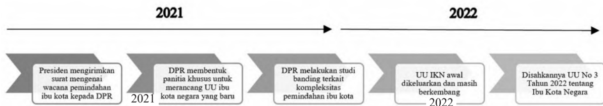
Gambar 1. Lini masa pembentukan landasan hukum pemindahan ibu kota baru

RI merespons dengan membentuk panitia khusus untuk merancang undang-undang terkait. Pada awal tahun 2022, DPR melakukan studi banding ke Kazakhstan untuk mempelajari kompleksitas pemindahan ibu kota. Pada 18 Januari 2022, rancangan awal undang-undang Ibu Kota Negara diterbitkan dan terus disempurnakan. Akhirnya, pada 15 Februari 2022, DPR RI mengesahkan dan meratifikasi UU Nomor 3 Tahun 2022 tentang Ibu Kota Negara (Kamal, 2022). Lini masa pembentukan landasan hukum ini disajikan pada Gambar 1.