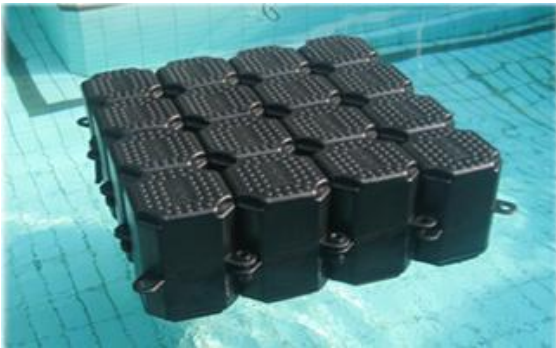
Gambar 1: floaton sbg bahan dasar DAM

Dermaga Apung Modular (DAM) adalah sebuah konsep dermaga yang terapung yang dibangun dengan menyusun kotak-kotak yang dibuat dengan bahan High Density Polyethylene (HDPE) yang dinamakan Floaton.