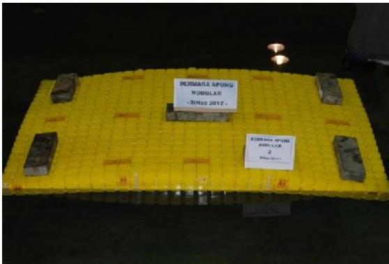
Gambar 2: Uji beban 50kg (50 ton)

Pengujian dilakukan dengan melakukan variasi pembebanan dengan skala 1:1000 untuk model DAM skala 1:10