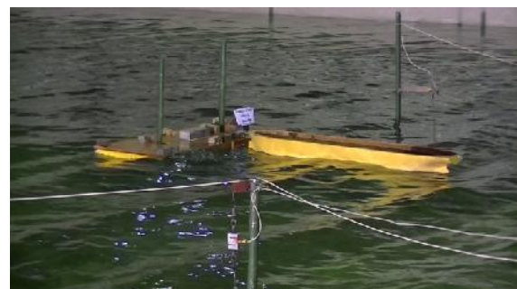
Gambar 8: DAM tipe pancang