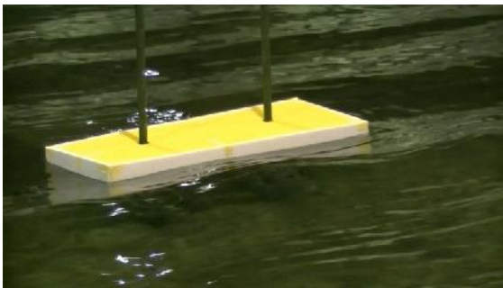
Gambar 6: uji DAM tipe pancang

Hasil pengukuran gaya gelombang pada tepi dermaga adalah 7499 N/m