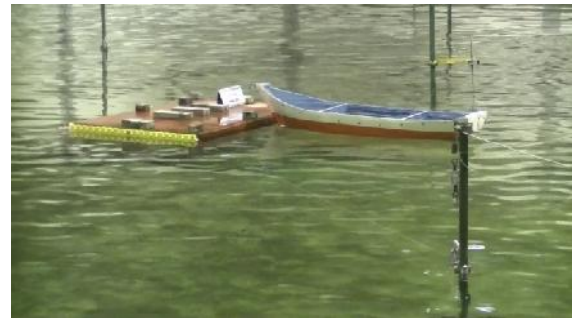
Gambar 7: DAM tipe tambat

yang akan digunakan pada DAM tipe pancang. Data untuk pengujian DAM tipe tambat dapat secara langsung diperoleh dengan memasang load cell pada tali tambat sehingga gaya tension akibat benturan kapal dapat direkam. Sedangkan untuk DAM tipe pancang, pengaruh yang dirasakan tiang pancang akan diturunkan dari gaya impact yang dihitung dari massa dan kecepatan kapal dan dengan memakai koefisien redaman yang telah diperoleh dapat diturunkan gaya impact pada tiang pancang.