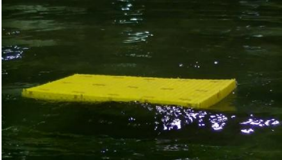
Gambar 5: uji DAM tipe tambat

Pengujian variasi gelombang dilakukan dengan dua macam variasi yaitu gelombang pendek dan gelombang panjang yang merepresentasikan kondisi gelombang ekstrim yang kemungkinan dialami oleh sebuah dermaga apung.