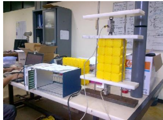
Gambar 3: Uji Redaman gaya impact

Sebelum pengujian dengan gelombang dilakukan, dibutuhkan satu macam pengujian di darat yaitu pengujian redaman model dermaga apung modular untuk mendapatkan koefisien redaman dari Dermaga Apung tersebut. Koefisien redaman ini akan digunakan untuk menghitung gaya impact yang terjadi pada tiang pancang akibat benturan kapal yang dialami oleh Dermaga Apung tersebut.