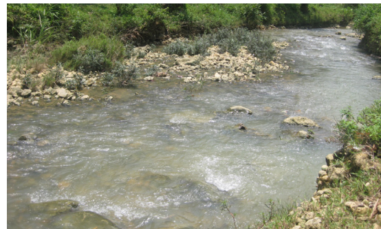
Foto 7. Singkapan material batugamping kersikan, rijang, dan batu lanau di DAS Kedungwungu

Kecamatan. Todanan, Singkapan yang tampak berupa material sungai seperti fragmen batugamping berukuran berangkal hingga bongkah yang menumpang secara tidak selaras di atas satuan batuan batugamping. Selain itu tampak beberapa batugamping kersikan berwarna merah dan kuning, rijang merah berukuran berangkal dengan bentuk agak membundar (Foto 7). Ketinggian lokasi 6 terletak 113 m dari permukaan air laut.