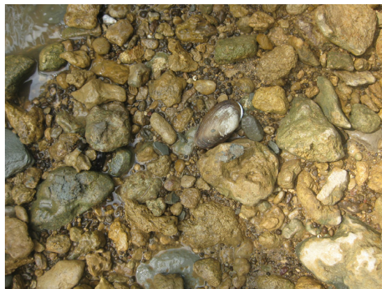
Foto 4. Singkapan berangkal batugamping kersikan dan beberapa rijang merah di DAS Sungai Kedungwungu

Singkapan yang tampak berupa material sungai yaitu, fragmen batu gamping berukuran berangkal - bongkah yang menumpang secara tidak selaras di atas satuan batuan batugamping. Selain itu, tampak beberapa batu gamping kersikan berwarna merah dan kuning, rijang merah berukuran berangkal dengan bentuk agak membundar (Foto 4). Ketinggian lokasi 2 terletak 115 m dari permukaan air laut.