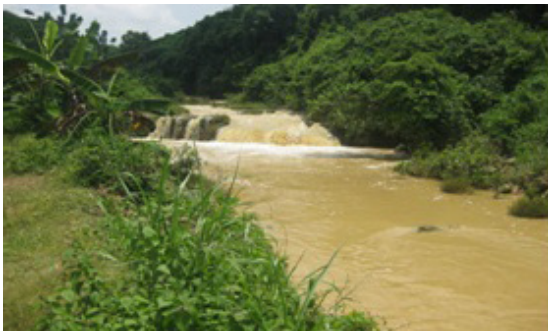
Foto 6. Kondisi kalisat yang menyingkap satuan batuan batu gamping

Terletak di Daerah Aliran Sungai (DAS) Kalisat, dengan topografi perbukitan terjal hingga bergelombang sedang (Foto 6). Satuan batuan yang tersingkap adalah satuan batuan batu gamping berwarna putih kecoklatan, travertine , dan beberapa gamping kersikan berwarna merah dan kuning. Satuan batuan batu gamping tersebut menunjukkan adanya rekahan-rekahan, bahkan di beberapa lokasi tampak adanya patahan sesar turun orientasi timur - barat. Sifat batuan fragmentaris, kekompakan sedang, berlapis, dan porositas tinggi, menyebabkan satuan batuan ini mudah runtuh. Ukuran endapan bongkah – berangkal yang berasal dari daerah sekitarnya. Ketinggian lokasi pengamatan 140 m di atas permukaan air laut.