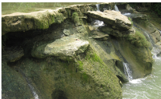
Foto 9. Singkapan kontak satuan batu gamping dengan satuan batuan batu lanau di Kali Jaten

Terletak di DAS Kali Jaten, Desa Kedungwaru, Kecamatan Todanan. Singkapan yang tampak berupa kontak antara satuan batuan batugamping dengan satuan batuan lanau (Foto 9). Selain itu, endapan aluvial material sungai seperti fragmen batugamping berukuran berangkal hingga bongkah yang menumpang secara tidak selaras di atas satuan batuan batugamping. Ketinggian terletak 98 m dari permukaan air laut.