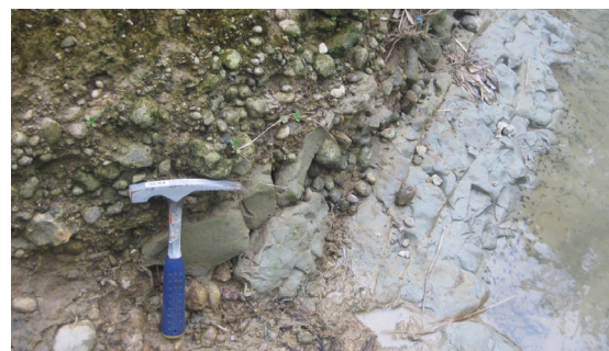
Foto 8. Endapan alluvial yang tidak selaras menumpang di atas batu lanau

Terletak pada daerah aliran anak Sungai Kedungwaru, Desa Kedungwaru, Kecamatan Todanan. Singkapan yang tampak berupa material sungai seperti fragmen batugamping berukuran berangkal - bongkah yang menumpang secara tidak selaras di atas satuan batuan batulempung. Selain itu, tampak beberapa batugamping kersikan berwarna merah dan kuning, rijang merah berukuran berangkal dengan bentuk agak membundar (Foto 8). Matrik batuan beku berukuran kerikil hadir dalam jumlah sangat sedikit. Ketinggian 117 m dari permukaan air laut.