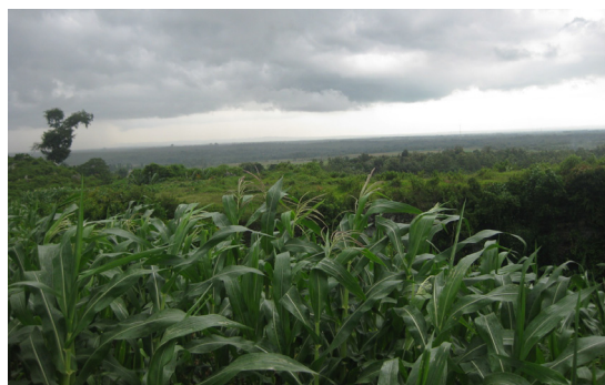
Foto 10. Topografi karst di sekitar Gua Kidang

Salah satu dinamika geologi yang terjadi pada satuan batuan batugamping adalah adanya gua-gua sebagai bentukan sungai bawah tanah. Begitu pula di daerah Kedungwungu dan sekitarnya banyak terdapat luweng dan gua. Sungai-sungai bagian hulu di daerah sekitar Gua Kidang merupakan stadia sungai muda dengan tebing yang agak curam dan bentuk daerah aliran sungai mengikuti topografi DAS anak-anak Sungai Kedungwungu yang merupakan bagian dari topografi karst (Foto 10). Sungai