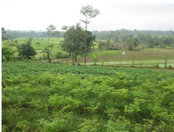
Foto 3. Penggunaan lahan sawah tadah hujan di sekitar Sendang Pengilon

Terletak di Desa Kedungwungu, morfografi perbukitan dan tebing-tebing gamping. Satuan batuan yang tersingkap adalah satuan batuan batugamping berwarna putih kecoklatan, travertine , dan beberapa gamping kersikan berwarna merah dan kuning. Satuan batuan batugamping tersebut menunjukkan adanya rekahan, bahkan di beberapa lokasi tampak sebagai ponor sungai bawah permukaan. Selain itu, sifat batuan fragmentaris, kekompakan sedang, berlapis, dan porositas tinggi, menyebabkan satuan batuan ini mudah runtuh. Sungai bawah permukaan yang muncul ke permukaan, oleh masyarakat setempat dibuat bendungan yang dinamai Sendang Pengilon (Foto 3). Topografi bagian selatan sendang, kelerengan bergelombang sedang hingga lemah, dengan penggunaan lahan sebagai sawah irigasi.