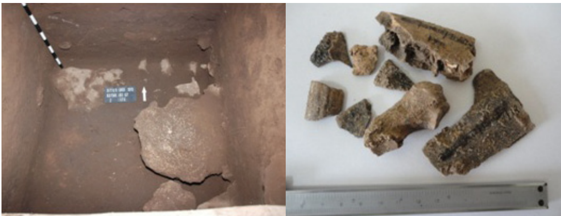
Foto 2. Akhir ekskavasi kotak B2U7 (kiri), temuan fragmen tulang yang terkonkresi tingkat lanjut dalam batu gamping/ proses fosilisasi (kanan)

Berdasarkan temuan ekskavasi yang dilakukan di Gua Kidang, banyak ditemukan cangkang kerang, tulang vertebrata, dan peralatan pendukung dari batu dengan silikaan. Dengan demikian pertanyaan, sejauh mana daerah eksplorasi manusia pendukung Gua Kidang mempertahankan hidupnya? Cangkang kerang, baik gastropoda maupun pelecypoda , menunjukkan habitat di daerah perairan air tawar seperti sungai, danau, dan rawa. Oleh karena itu, perlu dilakukan survei geologis – geografis