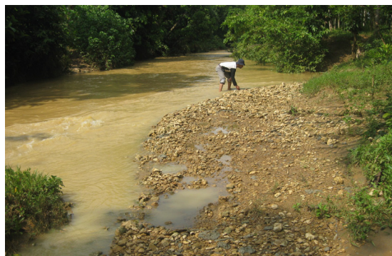
Foto 5. Singkapan aluvial endapan sungai, kontak langsung dengan satuan batuan batu lanau

Terletak di Daerah Aliran Sungai (DAS) Kedungwungu dekat pemukiman, topografi agak miring. Singkapan yang tampak adalah material endapan sungai seperti fragmen batu gamping kersikan berwarna merah, kuning, dan putih berukuran kerakal - berangkal. Material tersebut kontak langsung menumpang tidak selaras di atas satuan batuan batu lanau silikaan (Foto 5). Kemiringan satuan batuan batu lanau 140 relatif ke arah utara-selatan