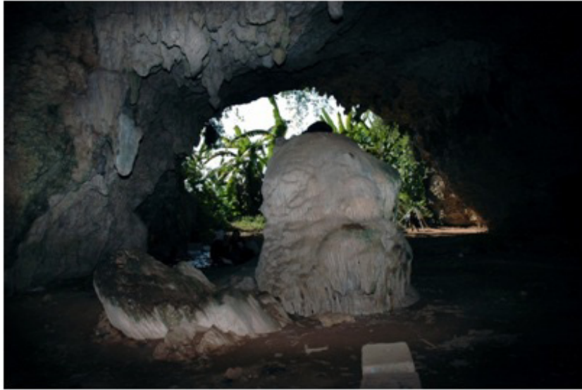
Foto 1. Gua Kidang dari bagian dalam

arkeologis dan temuan fosil di antara situs-situs Pleistosen (DAS Solo dan Sungai Lusi) dengan Gua Kidang.