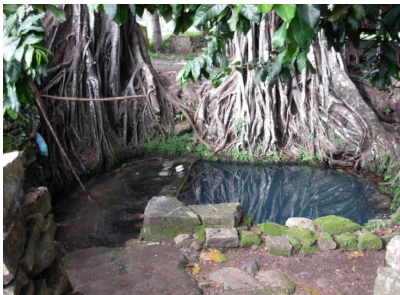
Foto 5. Umbul Karangtalun, sebuah mataair abadi yang tidak pernah kering sepanjang musim

Adapun lokasi tëlëng yang kedua, seperti telah disebutkan adalah sebutan untuk mataair yang terdapat di Dusun Karangtalun yang lebih dikenal dengan nama Umbul Karangtalun. Nama tempat itu dikenal juga sebagai tëlëng yang artinya mataair. Mataair di lokasi ini, dilihat dari letaknya yang berada di bawah pohon beringin yang jika melihat lingkaran batangnya mungkin sudah sangat tua. Mungkin saja mataair yang tidak pernah kering itu usianya lebih tua dari pohon beringin yang ada di atasnya. Apabila melihat jarak antara tempat ditemukannya prasasti dengan kedua nama Tëlëng tersebut dan usianya sudah sangat tua meskipun sekarang belum dapat ditentukan dengan pasti, maka yang paling mungkin sebagai Desa Tëlëng seperti yang disebutkan dalam prasasti adalah tëlëng yang ada di Dusun Karangtalun. Jarak antara Dusun Jatirejo dan Dusun Karangtalun yang 11,8 km, memungkinkan bahwa kedua dusun tersebut tadinya berada dalam satu wilayah, yaitu wilayah Huwusan.