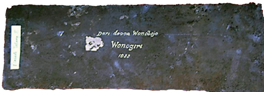
Foto 4. Prasasti Tlaṅ III yang sudah sangat aus