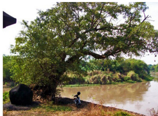
Foto 1. Batu tempat Joko Tingkir bersemedi di tempuran Sungai Bengawan Solo dan Sungai Pepe

Cerita mengenai Joko Tingkir sebagaimana tertulis dalam Babad Tanah Jawi ini diakui kebenarannya oleh masyarakat di tepi Bengawan Solo. Hal ini dibuktikan dengan adanya batu segi empat berukuran 50 x 50 cm dengan tinggi 80 cm terletak di tepi barat Bengawan Solo wilayah Surakarta yang dipercaya sebagai tambatan perahu Joko Tingkir. Tidak hanya itu saja, sebuah batu hitam besar dengan tinggi sekitar 150 cm juga ditemukan di tepi barat Bengawan Solo, di daerah pertemuan Sungai Pepe dan Bengawan Solo, dipercaya sebagai tempat bersemedi Joko Tingkir. Adanya sesajen berupa bunga-bunga di kedua batu tersebut menunjukkan bahwa dianggap keramat oleh masyarakat tepi Bengawan Solo. Pemberian sesajen dan semedi yang dianggap sebagai peninggalan Joko Tingkir itu merupakan upaya pemujaan roh nenek moyang, dan dilakukan oleh orang-orang Jawa untuk mendapatkan keselamatan dan kesejahteraan (Koentjaraningrat 1994: 343) (Foto 1).