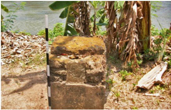
Foto 2. Batu tambatan perahu Joko Tingkir di tepi barat Bengawan Solo, Surakarta

yang ada di Bengawan Solo diharapkan dapat mendatangkan energi yang kuat bagi penduduk desa (Koentjaraningrat 1994: 341). Tempuran mempunyai arti magis dan tempat-tempat di dekatnya dianggap keramat oleh orang Jawa (Soeratman 2000: 67). Kepercayaan bahwa sungai memiliki fungsi magis sudah dikenal oleh masyarakat Nusantara sejak dahulu kala sebagaimana telah dikemukakan di atas (Foto 2).