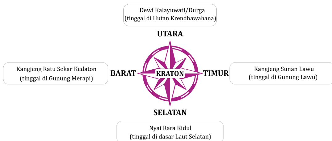
Gambar 1. Penerapan Pajupat Kalima Pancer (kesatuan dari empat arah dengan kelima sebagai pusatnya) di Surakarta (Sumber: Savitri 2015, digambar oleh Ari Mukti Wardoyo Adi 2012)

Dengan demikian maka jelaslah peran magis-religius Bengawan Solo dalam pemilihan lokasi Surakarta sebagai ibukota Mataram Islam dan pembentukan tata ruang kota Surakarta.