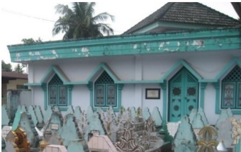
Gambar 2. Bangunan Makam di Mesjid Turikale tampak dari luar

Komplek makam kuna Mesjid Turikale berada di sebelah barat mihrab Mesjid Turikale. Di dalam bangunan masjid terdapat 10 makam, sedangkan makam lainnya terdapat di luar mesjid, tepatnya di sudut barat laut. Komplek makam ini diperuntukkan bagi keluarga dan keturunan bangsawan Turikale.