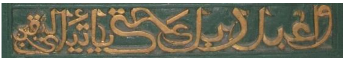
Gambar 7. Contoh kalimat tasawwuf yang bertuliskan Wa 'budu rabbaka hattayati al yakin , yang berarti Sembahlah Tuhanmu sehingga kamu menjadi yakin

Mengenai ragam hias pada bangunan makam di Komplek Makam Turikale, secara umum dapat dikatakan sangat disiplin menganut paham representative art dan menghindari aktivitas pengkultusan pada sosok selain Allah. Ragam hias pasif banyak terdapat pada makam di Komplek Makam Turikale. Sulur-suluran dan bunga ditampakkan sangat vulgar dengan kelopak bunga yang menengadahkan. Dalam falsafah Bugis-Makassar, penggambaran seperti ini menyimbolkan pandangan hidup yang terbuka dan progressif. Penerapan ragam hias pada makam yang merepresentasikan falsafah Bugis-Makassar ini dapat dimaknai sebagai simbolisasi dari kehidupan setelah kematian.