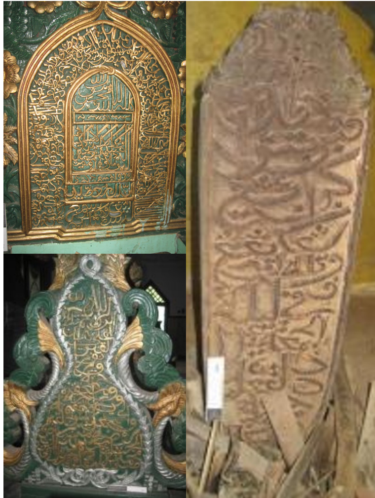
Gambar 8. Kaligrafi ayat Kursi pada hiasan pintu gerbang di jirat Makam Raja Turikale V dan kaligrafi pada jirat dan nisan berisi doa dan kalimat tasawwuf (searah jarum jam). Tiga artefak kaligrafi di atas menggunakan Khat Tsulus