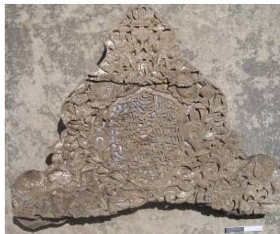
Gambar 5. Kaligrafi aliran Tsulus dari Komplek Makam Kassikebo, isi kaligrafi di atas adalah doa

Pada umumnya kaligrafi dan ragam hias banyak ditemukan pada makam, terutama pada bagian jirat dan nisan. Semua artefak kaligrafi pada makam di Komplek Mesjid Makam Turikale dapat digolongkan ke dalam aliran Tsulus atau Khat Tsulus . 4 Kaligrafi dengan Khat Tsulus ini juga ditemukan di Komplek Makam Kassikebo dan makam di Mesjid Nurul Muttaqin. Sekitar 40 kaligrafi makam yang tersebar di Komplek Makam Kassikebo, Turikale, dan di Nurul Muttaqin, telah diidentifikasi dan dianalisis. Semuanya memperlihatkan unsur Khat Tsulus yang kuat (Rosmawati 2013, 278). Aliran Tsulus merupakan salah satu dari delapan aliran kaligrafi di Arab yang sudah baku. Dalam perkembangannya, Khat Tsulus banyak dipergunakan untuk memberi hiasan pada manuskrip, 5 khususnya judul buku atau judul bab, atau pada dinding bangunan ruang dalam mesjid. Penggunaan Tsulus sebagai variasi hiasan banyak dikembangkan oleh Ibnu Al