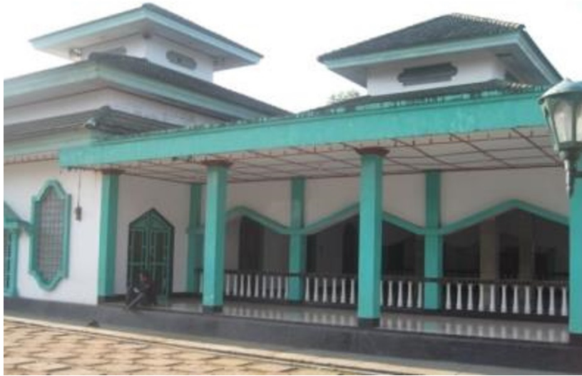
Gambar 1. Pendopo Masjid Turikale

Ruangan makam Masjid Turikale berada di sebelah barat mihrab. Tokoh yang dimakamkan adalah penganjur agama Islam yang juga membangun mesjid ini. Mesjid ini memiliki tiga kubah. Kubah utama lebih tinggi dari dua kubah lain, berada di tengah dan menaungi ruangan utama mesjid; kubah kedua berada di timur menaungi bagian mesjid yang tidak ber dinding (pendopo); sedangkan kubah ketiga berada di sebelah barat kubah utama, menaungi ruangan makam. Secara arsitektural, tiga kubah tersebut terangkai membentuk karakter arsitektur Mesjid Turikale sebagai mesjid kuna.