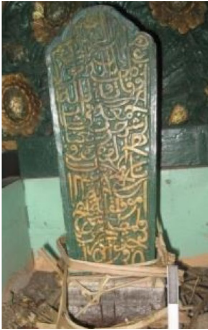
Gambar 6. kaligrafi aliran Tsulus dari Komplek Makam Turikale, isi kaligrafi di atas adalah doa

Bawwah dan Yakut Al Musta'shimi. Untuk penulisan mushaf Al-quran, jenis tulisan ini sudah sangat jarang dipakai karena dianggap kurang praktis (Situmorang 1993, 68-78).