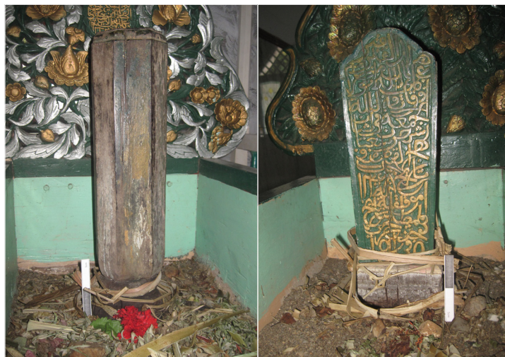
Gambar 4. Nisan Karaeng Turikale IV (kiri) dan nisan Karaeng Turikale V (kanan)

Makam Raja Turikale V yang berada di sebelah barat makam Raja Turikale IV dibuat dari konstruksi kayu, tepat. Meskipun dari bahan yang sama, makam Raja Turikale V lebih menonjolkan kaligrafi dan hiasan kelopak bunga mekar. Jirat sisi utara dan selatan juga berbentuk gunung, tetapi bentuknya lebih tinggi dan agak bulat. Warna cat minyak yang dipakai juga sama, yaitu warna hijau, perak, dan kuning emas. Hal