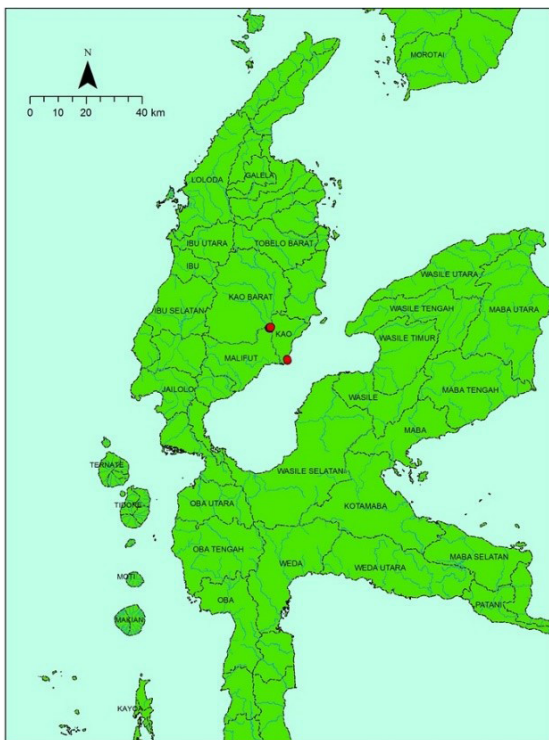
Gambar 1. Lokasi Situs Kampung Tua Kao

Di pedalaman Kao terdapat ragam makam kuno, keramik, dan data artefaktual lainnya. Hal ini membuktikan bahwa jaringan perdagangan Islam telah mencapai daerah pedalaman Pulau Halmahera, Selain sebagai pusat penyebaran Islam, sekaligus pusat aktivitas niaga tempat memasarkan komoditi dan memperoleh produk lokal (Tim Penelitian 2014; Handoko et al. 2016; Handoko 2017, 106). Penelitian ini menitikberatkan pada kajian arkeologi lanskap dan lingkungan pada situs permukiman kuno Kampung Tua Kao, yang terletak di wilayah pedalaman Halmahera Utara dan berkarakter situs permukiman tepian sungai. Kajian ini pada prinsipnya menjelaskan bagaimana kondisi lanskap dan lingkungan menjadi pertimbangan dalam pemilihan lokasi hunian, bahkan kemungkinan menjadi faktor determinasi sebagai salah satu pusat islamisasi di wilayah Halmahera Utara.