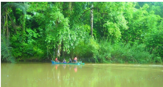
Gambar 3. Aliran sungai di percabangan Ake Jodo, Aer Kalak, dan Ake Ngoali

Meskipun cukup strategis, lokasi situs yang berada di pertemuan sungai besar mempersempit ruang gerak okupasi karena areal situs tidak bisa dihuni pada saat air sungai pasang dan meluap hingga ke daratan. Namun, permukiman dapat meluas ke areal lain yang lebih aman dari luapan sungai. Berbeda dengan wilayah Halmahera Utara lainnya, di wilayah Tanah Kao ditemukan daerah aluvial. Keberadaan kandungan tanah aluvial tentu saja membuat lahan-lahan pertanian di wilayah Kao lebih subur. Jenis tanah aluvial adalah jenis tanah yang terbentuk karena endapan (Hoeve 1980). Daerah endapan terjadi di sungai, danau yang berada di dataran rendah, ataupun cekungan yang memungkinkan