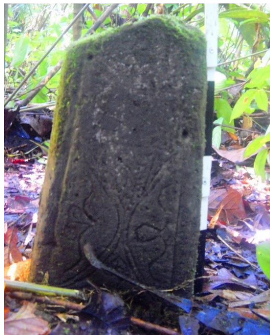
Gambar 5. Nisan kuno di Situs Kampung Tua Kao yang diperkirakan berasal dari batuan di perbukitan Gogoneng

Daya dukung lingkungan lainnya yang terdapat di wilayah Situs Kao adalah sumber bahan batuan. Sumber bahan batuan digunakan