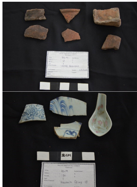
Gambar 4. Temuan fragmen tembikar dan keramik dari Situs Kampung Tua Kao

16 memiliki kesesuaian informasi dengan cerita tutur yang menyebutkan adanya hunian sejak abad ke-16 di Situs Kampung Tua Kao. Puncak-puncak permukiman kemungkinan terjadi pada masa Kolonial, yakni abad ke-18-19, sesuai dengan kuantitas keramik asing terbesar berasal dari jenis keramik asing pada abad tersebut. Menurut sumber tutur, sejak permukiman itu berkembang pada abad ke-16, Islam sudah berkembang di wilayah itu, dan permukiman itu sudah dihuni oleh sekitar 400 jiwa penduduk yang sudah mengenal Islam (Tim Penelitian 2014; Handoko et al. 2016).