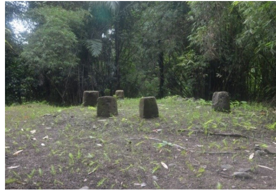
Gambar 7. Fitur umpak-umpak masjid di Situs Kampung Tua Kao

Pola permukiman bantaran sungai umumnya adalah pola linier karena berderet-deret sepanjang pinggiran sungai mengikuti bentuk sungainya (Goenmiandari, Silas, and Supriharjo 2010, 6). Berdasarkan pengamatan di lapangan, terdapat dua tipologi bentuk lahan ( landform ) di Situs Kampung Tua Kao. Pertama adalah dataran yang dimanfaatkan untuk permukiman penduduk, pemakaman umum,