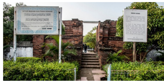
Gambar 19. Gapura Makam Kenari

Pada bagian paling selatan di Kawasan Banten Lama terdapat masjid dan makam kuno yang bernama Masjid Kenari. Masjid itu merupakan peninggalan Sultan Abdul Kadir Kenari (1596-1651) yang merupakan penguasa Nusantara pertama yang mendapatkan gelar “Sultan” dari Mekkah. Di lingkungan tersebut terdapat dua gapura kuno, satu gapura menuju masjid berbentuk paduraksa yang diplester dan diwarnai cat putih dan satu gapura berbentuk candi bentar menuju makam yang disusun dari batu bata. Masjid kuno itu terletak di permukiman padat dan pada bagian selatannya berbatasan dengan sawah. Berikut ini adalah foto-foto lingkungan masjid kuno (Gambar 18 dan Gambar 19).