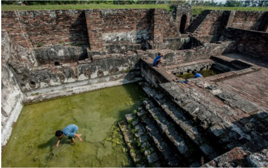
Gambar 7. Anak-anak menangkap Ikan di Pemandian di dalam Keraton Surosowan