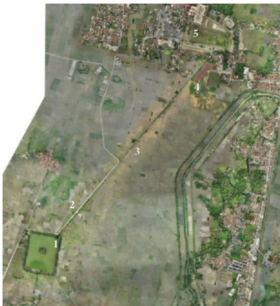
Gambar 20. Foto Udara Lingkungan Danau Tasik Ardi dan Sistem Filter Air ke Keraton Surosowan: (1) Danau Tasik Ardi; (2) Pangindelan Abang; (3) Pangindelan Putih; (4) Pangindelan Emas; (5) Keraton Surosowan

filter air ke Keraton Surosowan kini berada di lingkungan persawahan. Saat ini sistem pengairan tersebut telah mati, tetapi kondisi di lapangan menunjukkan bahwa sistem tersebut masih dapat dipugar dan dihidupkan kembali. Danau Tasik Ardi dan sistem filter air tersebut dibangun oleh Cardeel pada masa pemerintahan Sultan Maulana Yusuf (1570-1580). Terdapat sebuah pulau yang dinamakan Pulau Keputren di tengah-tengah danau tersebut. Berikut adalah foto-foto danau Tasik Ardi dan sistem filter air tersebut.