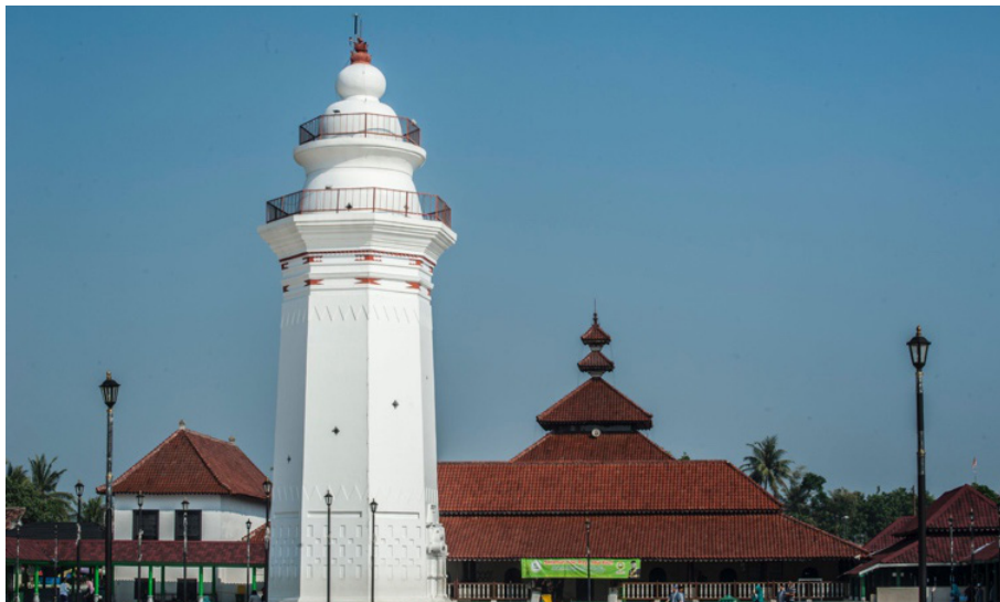
Gambar 5. Masjid Banten Lama

Lama masih terpreservasi dengan baik. Bangunan anjungan bergaya Belanda di selatan masjid dirancang oleh Cardeel, seorang tukang batu berkebangsaan Belanda yang bekerja untuk Sultan Ageng (Lombard 2008:179). Anjungan yang dibangun pada sekitar tahun 1675 tersebut juga terpreservasi dengan baik. Kawasan sekitar masjid dan keraton Surosowan ini sedang ditata oleh Pemerintah Provinsi Banten untuk menjadi kawasan cagar budaya. Berikut adalah hasil pemotretan udara yang dapat memperlihatkan kondisi keruangan masjid, menara, anjungan di selatan masjid dan keraton Surosowan yang terletak di tenggara masjid Banten Lama.