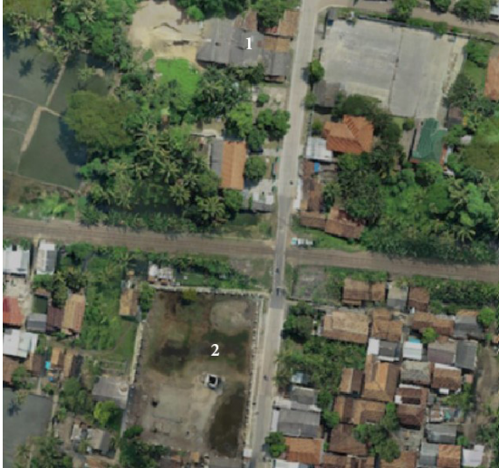
Gambar 11. Foto Udara Lingkungan Rumah Tionghoa dan Masjid Pecinan Tinggi: (1) Rumah Tionghoa; (2) Masjid Pecinan Tinggi