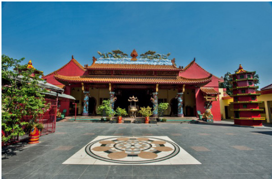
Gambar 9. Orientasi Vihara Avalokitesvara

kelenteng baru bernama Vihara Avalokitesvara yang dibangun di utara kelenteng lama yang terdapat pada peta kuno tahun 1630 M. Klenteng yang digambarkan pada peta tahun 1630 tersebut sudah hilang karena kebakaran. Berikut adalah foto udara yang memperlihatkan kawasan di muara pelabuhan internasional sebelah barat Kota Banten Lama.