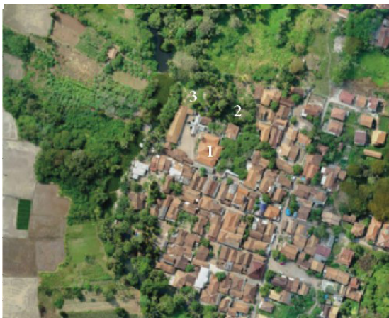
Gambar 16. Foto Udara Lingkungan Masjid Kasunyatan: (1) Masjid Kasunyatan; (2) Menara Masjid, (3) Kolam Pemandian

Pada gambar kuno Belanda digambarkan Pangeran Kasunyatan, sebagai seorang Kadi , yaitu pemimpin agama tertinggi dan Wali Raja (Kiayi Mas Patih Mangkubumi) sedang mengadakan di alun-alun Banten, di depan Masjid Besar pada Tahun 1596 (Guillot 2008:111). Hal tersebut juga menguatkan dugaan bahwa Masjid Kasunyatan dan wilayah di sekitarnya merupakan pusat keagamaan di Banten Kuno. Masjid Kasunyatan kini terletak di antara permukiman padat. Berikut ini adalah foto-foto masjid tersebut.