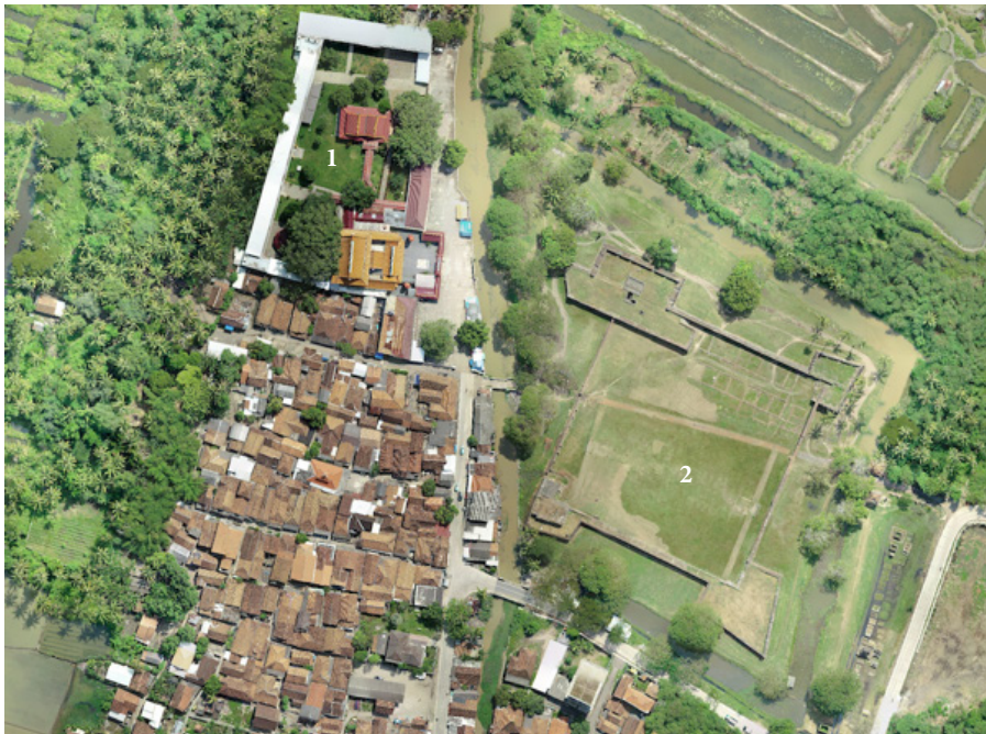
Gambar 8. Foto Udara Lingkungan Klenteng Banten Lama dan Benteng Speelwijk: (1) Vihara Avalokitesvara; (2) Benteng Speelwijk

Keraton Surosowan kini berupa reruntuhan istana berbenteng yang menunjukkan struktur bangunan yang dibuat dari bata. Benteng keliling dengan empat buah bastion di sudut timur laut, barat laut, tenggara, dan barat daya terpreservasi dengan baik. Kolam-kolam pemandian di bagian dalam benteng juga terpreservasi dengan baik. Situs arkeologi ini dimanfaatkan oleh warga sekitar dan pengunjung untuk rekreasi. Tidak terdapat