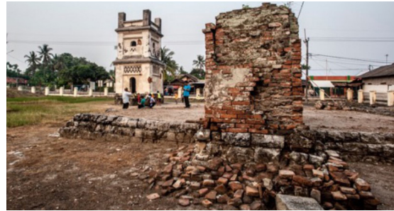
Gambar 13. Situs Masjid Pecinan Tinggi

Pada selatan rumah tersebut terdapat reruntuhan masjid kuno yang dinamakan Masjid Pecinan Tinggi. Masjid ini diduga kuat merupakan salah satu masjid tertua di Kota Kuno Banten Lama yang dibangun pada masa pemerintahan Sultan Maulana Yusuf (1522-1570) (Amalia 2017:A385). Pada bagian utara situs itu terdapat makam Tionghoa yang memiliki nisan dengan prasasti berbahasa dan aksara Tiongkok yang menjelaskan pemilik makam yaitu pasangan suami istri bernama Tio Mo Sheng dan Chou Kong Chian yang berasal dari Desa Yin-Shao. Batu nisan tersebut diperkirakan didirikan tahun 1843. Makam itu berdiri sendiri, tidak berada di dalam kompleks pemakaman (Amalia 2017:A389). Kondisi makam dan masjid sekarang tidak terawat dan digunakan oleh masyarakat untuk kegiatan rekreasi, seperti bermain bola. Berikut ini adalah foto-foto masjid kuno tersebut (Gambar 13).