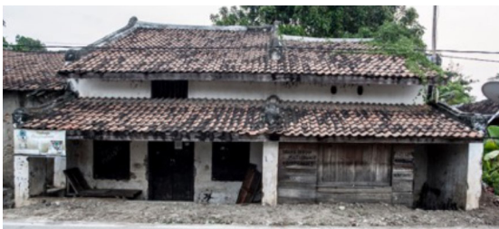
Gambar 12. Rumah Gaya Tionghoa Abad 18 M

Pada selatan rumah tersebut terdapat reruntuhan masjid kuno yang dinamakan Masjid Pecinan Tinggi. Masjid ini diduga kuat merupakan salah satu masjid tertua di Kota Kuno Banten Lama yang dibangun pada masa pemerintahan Sultan Maulana Yusuf (1522-1570) (Amalia 2017:A385). Pada bagian utara situs itu terdapat makam Tionghoa yang memiliki nisan dengan prasasti berbahasa dan aksara Tiongkok yang menjelaskan pemilik makam yaitu pasangan suami istri bernama Tio Mo Sheng dan Chou Kong Chian yang berasal dari Desa Yin-Shao. Batu nisan tersebut diperkirakan didirikan tahun 1843. Makam itu berdiri sendiri, tidak berada di dalam kompleks pemakaman (Amalia 2017:A389). Kondisi makam dan masjid sekarang tidak terawat dan digunakan oleh masyarakat untuk kegiatan rekreasi, seperti bermain bola. Berikut ini adalah foto-foto masjid kuno tersebut (Gambar 13).