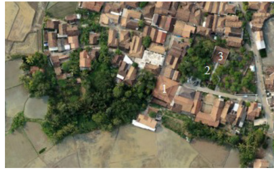
Gambar 18. Foto Udara Lingkungan Masjid Kenari: (1) Masjid Kenari; (2) Gapura Makam Kenari; (3) Makam Kenari