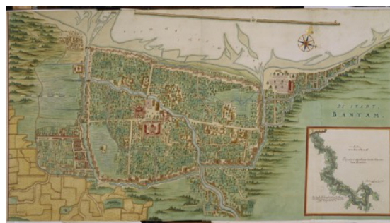
Gambar 2. Peta Peta Banten sekitar Tahun 1630