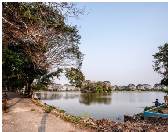
Gambar 21. Foto Danau Tasik Ardi (Fotografer: M. Iqbal Ibnu Syukur)