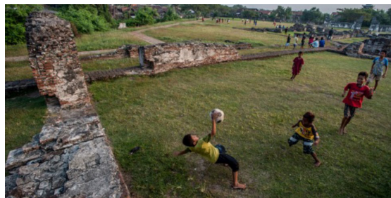
Gambar 15. Anak-anak bermain Sepakbola di Reruntuhan Keraton Kaibon