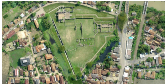
Gambar 14. Foto Udara Lingkungan Keraton Kaibon

Reruntuhan istana kuno lain di Kota Banten Lama yang masih dapat dipreservasi adalah Keraton Kaibon. Keraton yang namanya berarti “keibuan” atau tempat ibu ini terletak di selatan Sungai Cibanten. Keraton itu dahulu merupakan istana Sultan Syaifudin yang memerintah pada tahun 1809-1915. Istana tersebut masih terus digunakan sebagai rumah penguasa Banten setelah Kesultanan dihapuskan oleh VOC pada tahun 1816 (Baagil 2017:73). Reruntuhan Keraton Kaibon sekarang berbatasan dengan permukiman padat dan digunakan oleh masyarakat untuk rekreasi. Kegiatan rekreasi yang dilakukan tidak didasarkan kepada pemahaman pelestarian cagar budaya, contohnya bermain sepakbola. Berikut ini adalah foto-foto reruntuhan keraton tersebut.