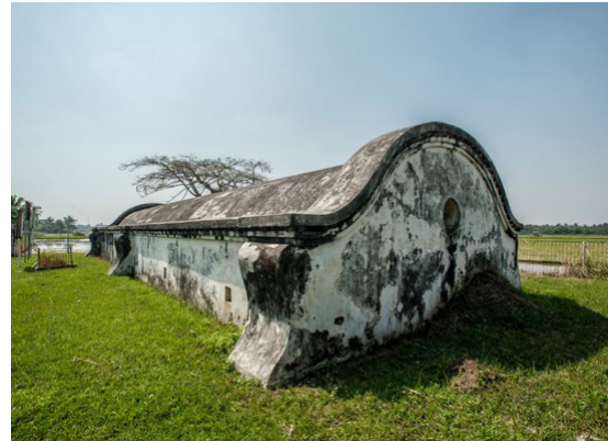
Gambar 22. Filter Pangindelan Putih