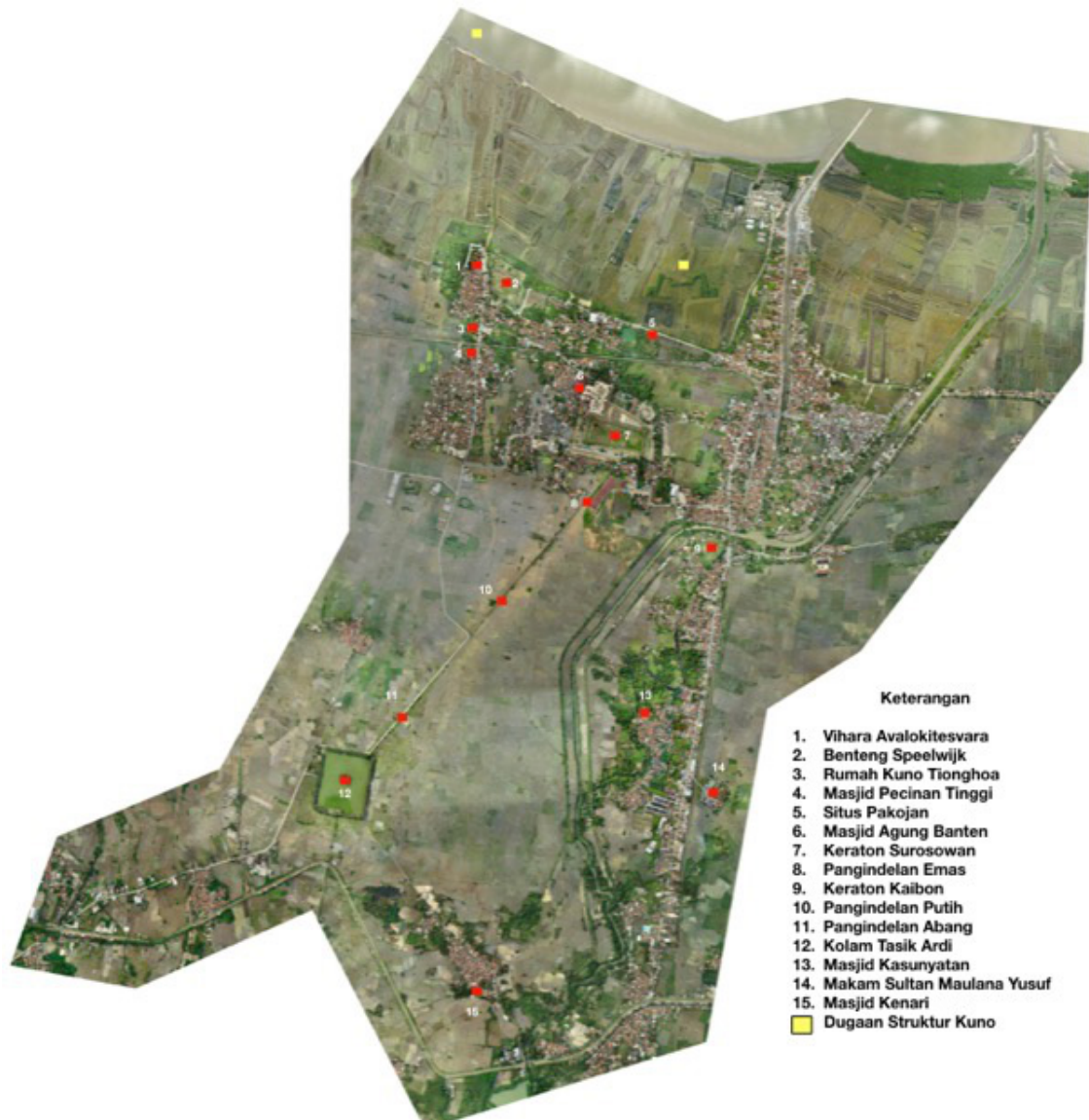
Gambar 4. Persebaran Peninggalan Kota Kuno Banten Lama (dimodifikasi dari foto udara karya M. Oksy Rahim)

Menurut data di laman Diskominfo Kota Serang Tahun 2018, Kecamatan Kasemen merupakan kecamatan kedua terpadat di Kota Serang dengan penduduk sebanyak 95.863 jiwa, dengan perbandingan laki-laki dan perempuan yang relatif sama. Mayoritas penduduk beragama Islam dan berada pada usia produktif dan anak-anak. Permukiman penduduk yang memadati kawasan cagar budaya telah berkembang dalam waktu yang relatif lama sehingga fasilitas umum seperti sekolah, masjid, dan puskesmas juga dibangun di dalam kawasan cagar budaya (Baagil 2017:59). Berikut adalah foto udara yang menggambarkan persebaran situs, bangunan,