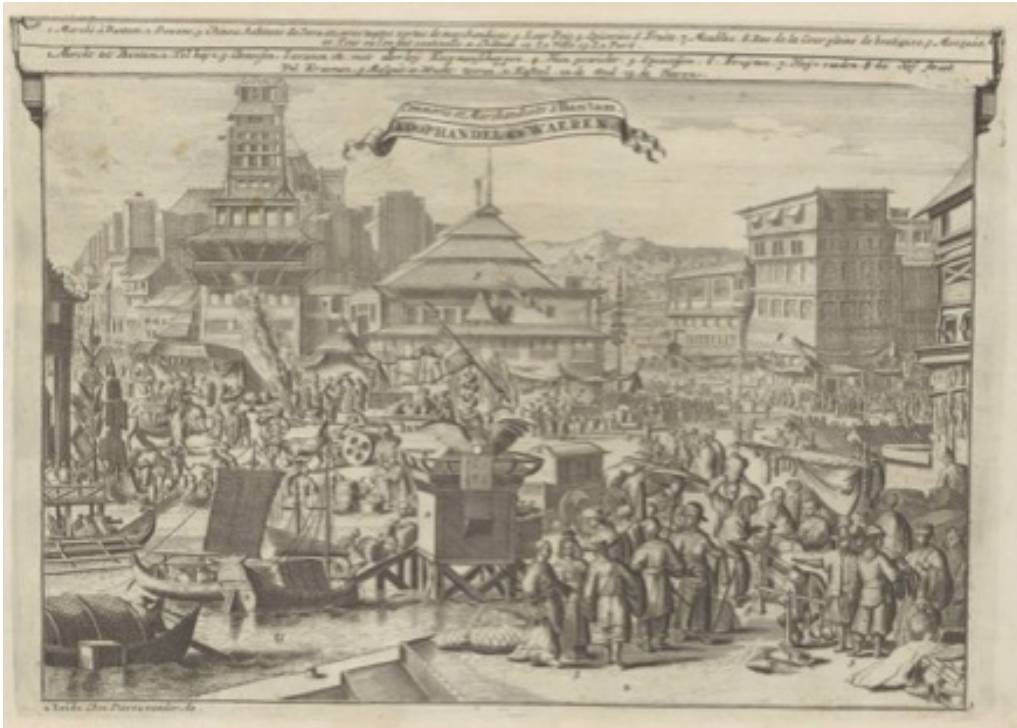
Gambar 3. Pasar dan Perdagangan di Banten karya Romeyn de Hooghe (1682 – 1733)

Sultan Ageng pada saat itu belum melimpahkan kekuasaan kepada putra mahkota, Sultan Haji (Guillot 2008:65). Kota Banten Lama pada tahun 1678 M merupakan kota terbesar di Nusantara, bahkan termasuk salah satu kota terbesar di dunia pada masa itu. Penduduk kota tersebut yang terdiri dari berbagai bangsa dan diperkirakan berjumlah ±150.000 orang (Guillot 2008:106).