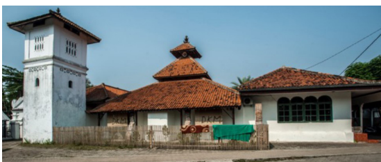
Gambar 17. Masjid Kasunyatan dan Menara