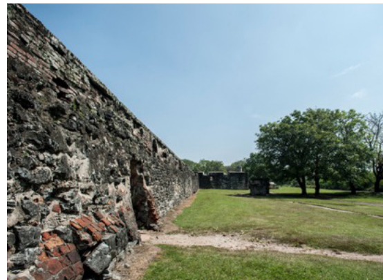
Gambar 10. Dinding Utara Benteng Speelwijk yang merupakan satu-satunya sisa tembok Kota Banten Lama

permukiman pejabat perusahaan, dan tentu saja barak tentara. Benteng itu terletak sangat strategis di muara sisi timur Sungai Pabean. Dari atas benteng itu orang dapat mengawasi Teluk Banten. Tembok sisi utara benteng itu adalah satu-satunya tembok kota Banten Lama yang masih tersisa setelah VOC menghancurkan seluruh benteng kota pada tahun 1682 (Boontharm 2003:61). Beberapa ratus meter di timur benteng itu terdapat pemakaman Belanda, dengan beberapa nisan yang dapat dikenali antara lain komandan militer Hugo Pieter Faure (1717-1763), seorang petugas pajak bernama Jacob Wits, istri Letnan Jan Van Doorn (1747-1769) yang bernama Catharina van Doorn, dan Maria Susana Acher, isteri dari petugas pajak bernama Thomas Schipers (Baagil 2017:80). Berikut ini adalah foto-foto benteng tersebut (Gambar 10).