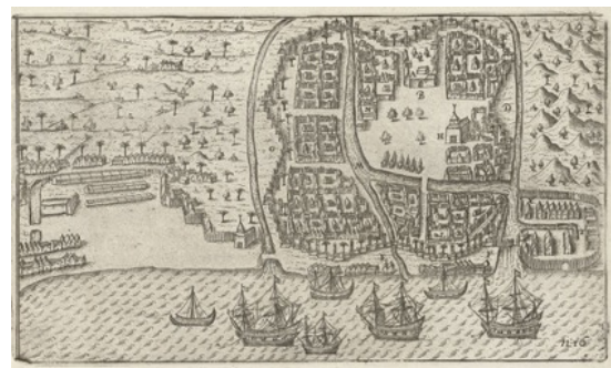
Gambar 1. Peta Kota Banten Tahun 1596

Pada tahun 1670an, Kesultanan Banten merupakan negara yang berdaulat yang berhasil beradaptasi dengan situasi politik dan ekonomi yang baru dimana peran orang Eropa semakin besar dalam perdagangan maritim Asia.