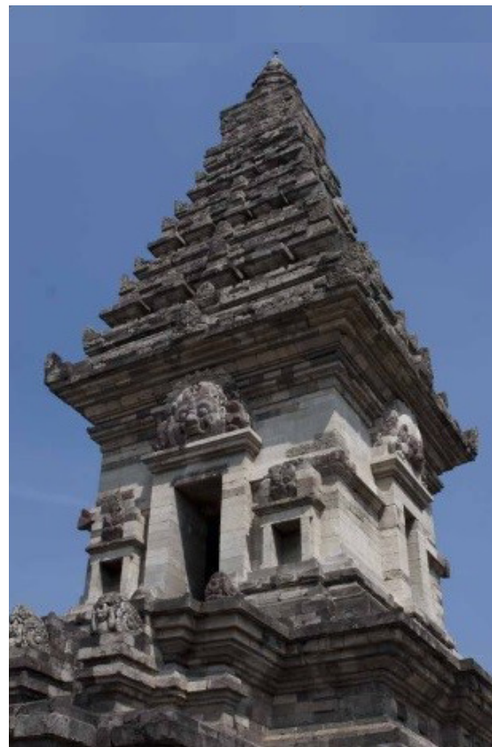
Gambar 1. Candi Jawi

di atas sebidang tanah yang ditinggikan. Candi menghadap ke timur, sedikit mengarah ke tenggara, dikelilingi oleh parit selebar 3,5 m dengan kedalaman 2 meter. Didirikan sekitar tahun 1300 Masehi, candi tersebut mempunyai gaya seni Jawa Timur. Candi tinggi langsing terdiri dari 3 bagian, kaki-tubuh-atap, berdiri di atas lapik tinggi. Secara keseluruhan, tinggi candi 21,5 meter dan luas 9,5 meter. Tubuh candi memiliki 5 relung, atapnya berbentuk śikhara , yang diakhiri kemuncak berupa sebuah kubus dan puncak sebuah stupika. Melihat strukturnya, candi Jawi adalah candi yang bersifat Siwa-Buddha ( Nāgarakṛtāgama 56:2..., cihnang candi ri sor kasaiwan apucak kaboddhan i ruhur ).