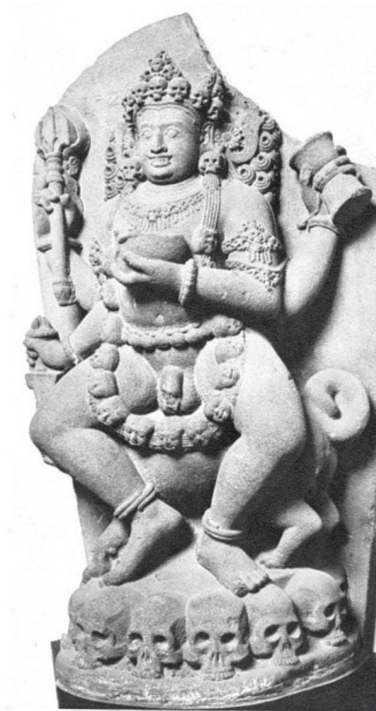
Gambar 4. Arca Bhairawa

Menarik perhatian, pada masa kerajaan Singasari, khususnya pada masa pemerintahan Kērtanāgara, terdapat usaha untuk mempertemukan/ membaurkan agama Siwa dan agama Buddha dalam wujud sebuah candi lainnya, yaitu Candi Singasari yang letaknya tidak jauh dari kota Malang. Sifat Siwa-