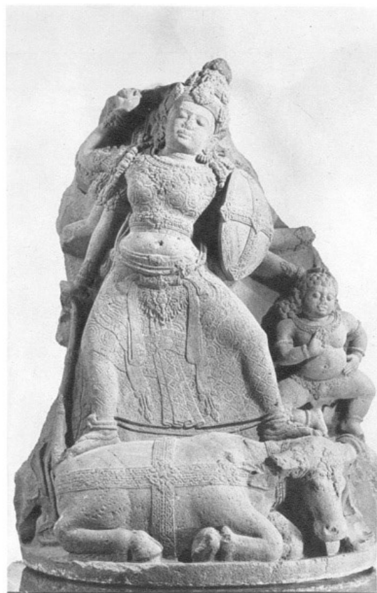
Gambar 2. Arca Durga Mahisa Suramardini

Bahwa Candi Jawi ini bersifat agama Siwa Buddha diperkuat oleh Nāgarakrtagama,