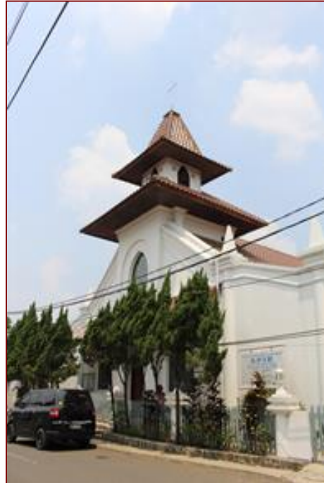
Gambar 2. GPIB Immanuel

Leander, 3) Bacas, 4) Loen, 5) Samuel, 6) Jacob, 7) Laurens, 8) Joseph, 9) Tholense, 10) Soedira, 11) Isakh, dan 12) Zadokh. Mereka kemudian membentuk suatu komunitas Kristen pertama di luar komunitas perkotaan Belanda.