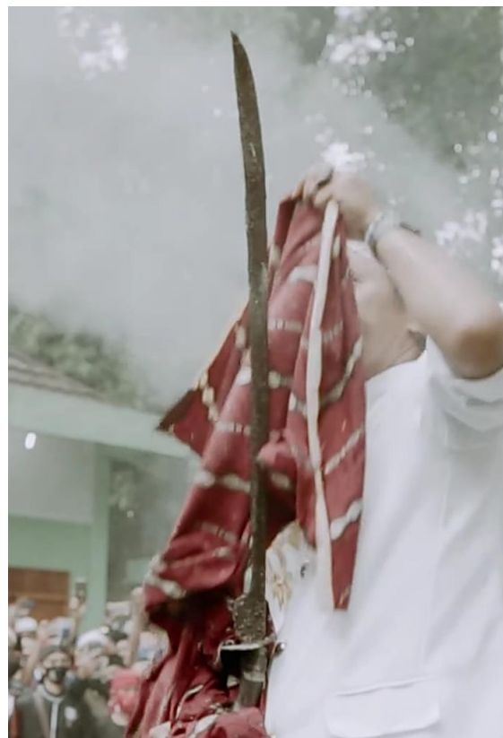
Gambar 2 Benda-benda (Pusaka), Termasuk Gunting Pinang, (yang Dikeramatkan) di Panjalu, Ciamis.