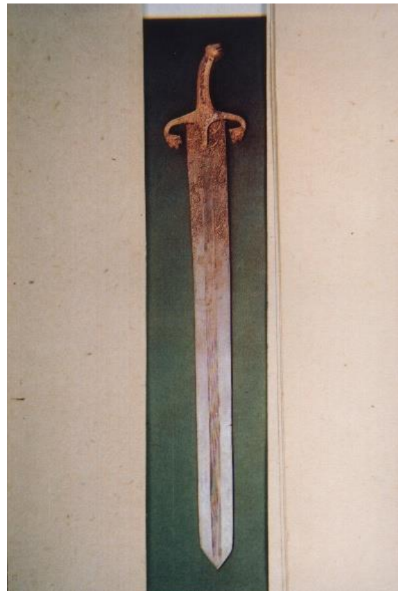
Sumber: Unsal Yücel, Islamic Swords and Swordsmiths , hlm. 27.

Gambar 6 Pedang Arab dengan Multi-Gerigi yang Memiliki Enam Lekukan di Samping Lima Guratan yang Ada di antara Kedua Setiap Muka Bilahnya, yang Berasal dari Periode Awal Islam. Sekarang Disimpan di Gudang Askeri (Military) Museum di Istanbul Bernomor Inventaris No. 2359.