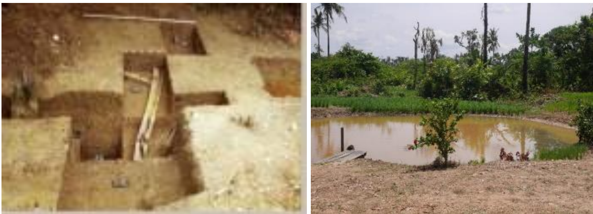
Gambar 3 Gabura Mantuil dan Citra Satelit Lokasi Mantuil