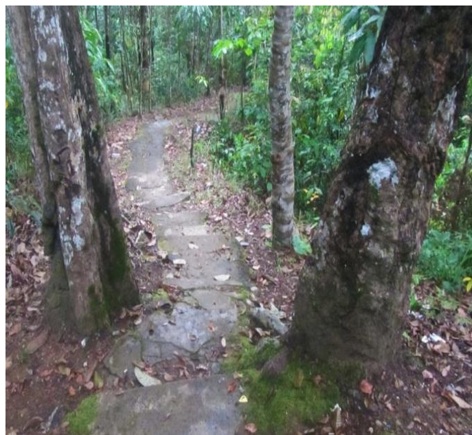
Gambar 7 Alur Penelitian