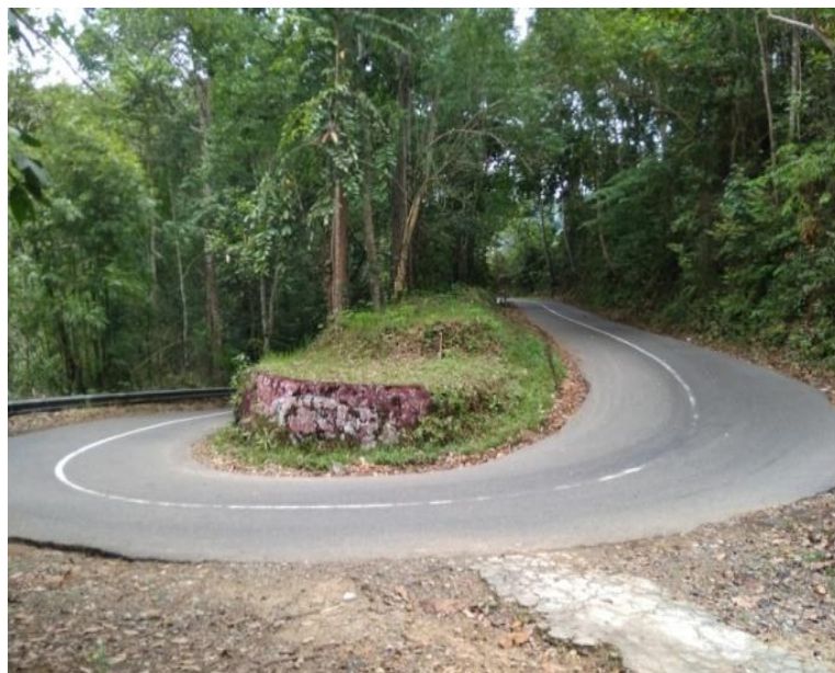
Gambar 5 Rumah Sakit Serukam di Sekitar Bukit Van Dering