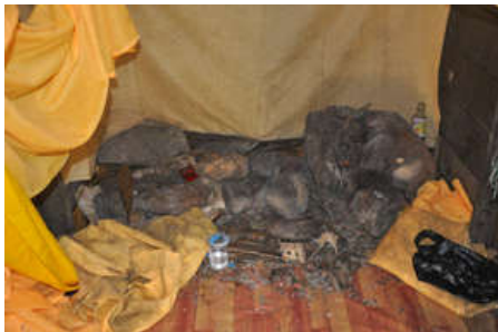
Gambar 3. Patahu batu bentukan alam

masa lalu. Sebenarnya keberadaan lingga dan batu arca juga menjadi satu petunjuk adanya komunitas Hindu pada masa lalu di daerah tersebut, tetapi seberapa besar kelompok ini, ada kemungkinan tidak sama dengan tempat yang ada bangunan candinya. Selanjutnya, meskipun disebut keramat batu ternyata tidak hanya batu yang berada dalam rumah panggung tersebut, meriam yang terbuat dari logam (besi) juga dikeramatkan oleh masyarakat. Benda ini mulai dikenal oleh masyarakat saat kolonial Belanda berkuasa, dan karena dianggap memiliki kekuatan, masyarakat juga memperlakukannya sama dengan batu. Dari bahan dan bentuk benda