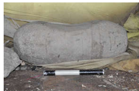
Gambar 5. Patahu batu asah