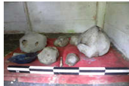
Gambar 4. Patahu batu kecubung putih