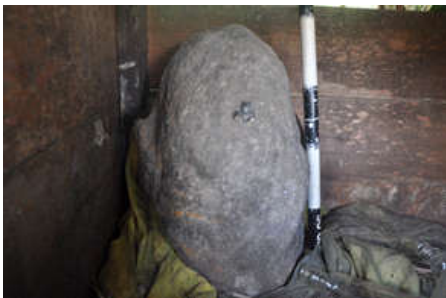
Gambar 6. Keramat batu berbentuk lingga