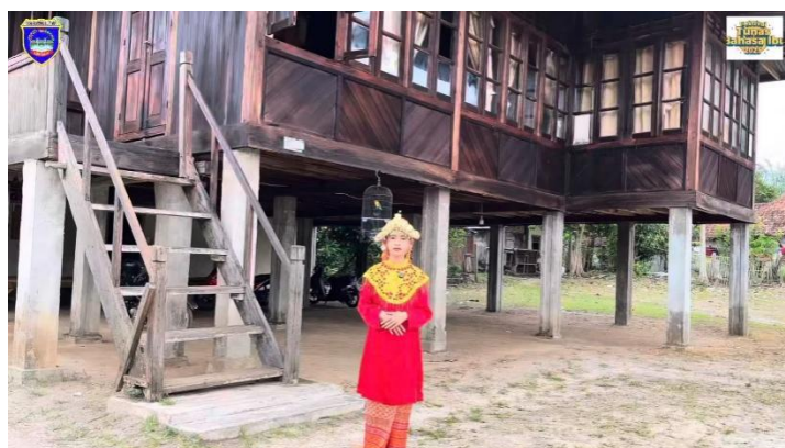
Gambar 2. Pementasan Cerita Seharuk dalam kegiatan Festival Tunas Bahasa Ibu (FTBI) di SDN Suko Harjo, OKU Timur.

Seiring perkembangan zaman, konteks penceritaan cerita Seharuk mengalami transformasi. Cerita yang sebelumnya hidup secara lisan mulai didokumentasikan dalam bentuk buku dan dimanfaatkan dalam kegiatan kebudayaan formal, seperti Festival Tunas Bahasa Ibu (FTBI). Hal ini terlihat dari pernyataan bahwa: “melalui buku ini, cerita Seharuk sudah diikutsertakan dalam berbagai lomba FTBI.” 13