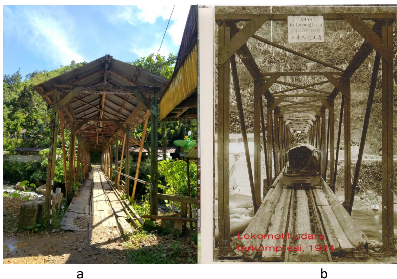
Gambar 3. a. Bentuk gerbang Jembatan Simau masa kini; b. Bentuk Jembatan Simau pada tahun 1924.

Jembatan Simau memiliki bentuk tapak persegi panjang. Panjang jembatan 44,21 m dan memiliki lebar 3,68 m. Bahan yang digunakan pada struktur jembatan didominasi oleh material besi dan baja. Akibat termakan waktu, warna material besi dan baja ini menjadi berwarna merah kecoklatan. Jembatan ini memiliki atap yang berfungsi melindungi para pejalan kaki yang melintas agar tidak terkena cahaya matahari langsung atau terkena hujan. Atap yang dipergunakan ialah atap bermaterial seng. Atap tersebut diperkirakan merupakan bagian yang ditambahkan pada waktu kemudian. Berdasarkan gambar 3, Jembatan Simau dahulunya tidak menggunakan atap. Penambahan atap baru dilakukan pada masa kemudian.