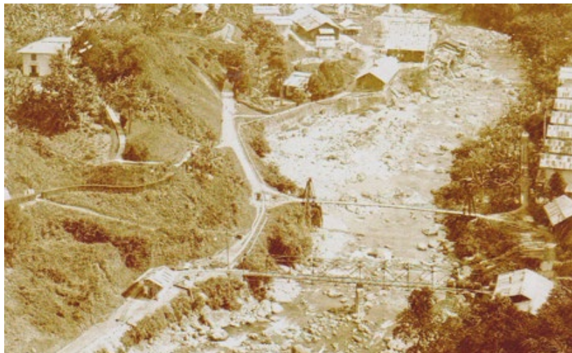
Gambar 4. Bentuk Jembatan Simau (jembatan bagian bawah) yang tampak pada arsip foto lama daerah Lebong Tandai.

Jembatan yang telah digambarkan mengindikasikan bahwa perusahaan swasta Belanda melakukan berbagai usaha untuk memperlancar proses eksploitasi emas di kawasan Lebong Tandai. Pembangunan jembatan tersebut memperlihatkan ramainya para pekerja, penduduk, dan para pelaku usaha swasta tambang Belanda yang lalu lalang untuk melakukan berbagai aktivitas di dalamnya (Izza, Wardoyo, dan Mahanani 2021), khususnya aktivitas yang berhubungan dengan kegiatan pertambangan pada akhir abad ke-19.