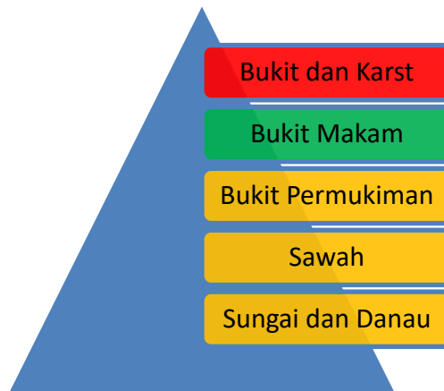
Gambar 6. Grafik bentang lahan kaitannya dengan kecenderungan okupasi manusia (Sumber: Laili, 2021).

Pengamatan lanskap di Kawasan Danau Bandung Purba memperlihatkan bahwa masyarakat memilih dan memanfaatkan lingkungan, beradaptasi dalam ruang dan waktu. Bentang lahan dan pola ketinggian situs memperlihatkan adanya variasi ketinggian yang diperlihatkan dari lokasi situs-situs yang diamati. Dominasi lokasi situs di utara menempati jumlah terbanyak dengan ketinggian lebih dari 800 m dpl dengan bentang lahan berupa domain bukit/kebun yang jauh dari permukiman, sedangkan pegunungan bagian selatan, penghunian lokasi-lokasi di lereng-lereng dengan bentang lahan berupa kebun dan makam, dan selanjutnya di dataran yang lebih rendah di wilayah cekungan bandung dengan bentang lahan berupa lahan yang relatif datar yang telah diolah menjadi sawah, ada juga berupa danau, dan dipadati permukiman. Indikasi pergerakan tersebut juga terlihat dari lokasi situs dengan keberadaan sungai-sungai terdekat.