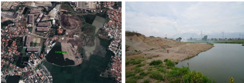
Gambar 5. Situ Cangkung yang pada bagian tengah sisi barat laut telah diurug material tanah dari bukit di sebelah timur. Bagian barat daya situ masih tersisa.

Lokasi jejak obsidian pada bentang lahan sungai/danau adalah di Situ (Danau) Cangkung, Rancaekek (Gambar 5). Situ Cangkung, Rancaekek, sekarang ini sudah diurug sebagian untuk lokasi perumahan baru. Bukit yang tersisa di wilayah tersebut merupakan bukit terisolir yang terbentuk akibat intrusi gunung api. Bagian selatan situ berupa permukiman padat. Wilayah di sekitar permukiman dan bagian selatan permukiman masih berupa persawahan.