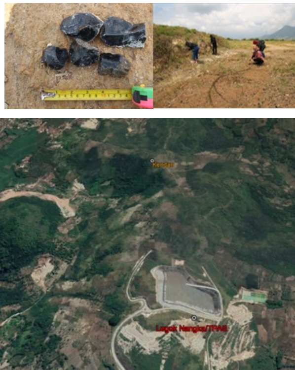
Gambar 3. Lokasi TPPAS Legok Nangka di selatan Bukit Kendan (Sumber: Dokumen Balai Arkeologi Jawa Barat, 2021).

Tinggalan arkeologi di Situs Batu Bedil berupa monolit besar yang disangga enam batu pada bagian dasarnya menyerupai ciri sebagai dolmen. Batu terbuat dari bahan andesit dengan orientasi barat—timur. Batu berukuran 100 cm x 230 cm x 50 cm pada denah berukuran 5 m x 6 m. Batu berada di puncak bukit dengan empat undakan dengan tatanan batu. Undakan batu tersebut tampak jelas di bagian barat. Sekitar lahan ditanami sayur, cabe, dan terong, dan pohon besar beringin pada puncak bukit. Jejak obsidian diperoleh di area situs berupa sebaran tatal obsidian.