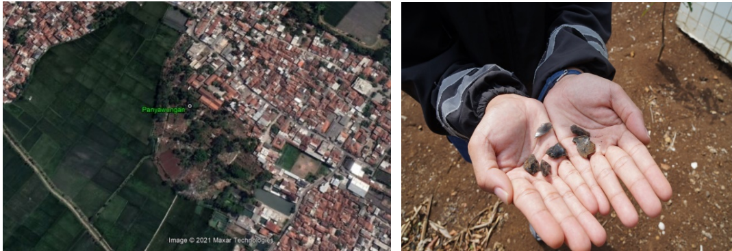
Gambar 4. Bukit Panyawungan dan temuan obsidian.

Sebaran obsidian insitu di lokasi ini termasuk terbanyak. Bentukan bukit Panyawungan terlihat jelas dari sebelah selatan makam atau di sekitar areal persawahan yang membentang hingga sebelah barat (Gambar 4).